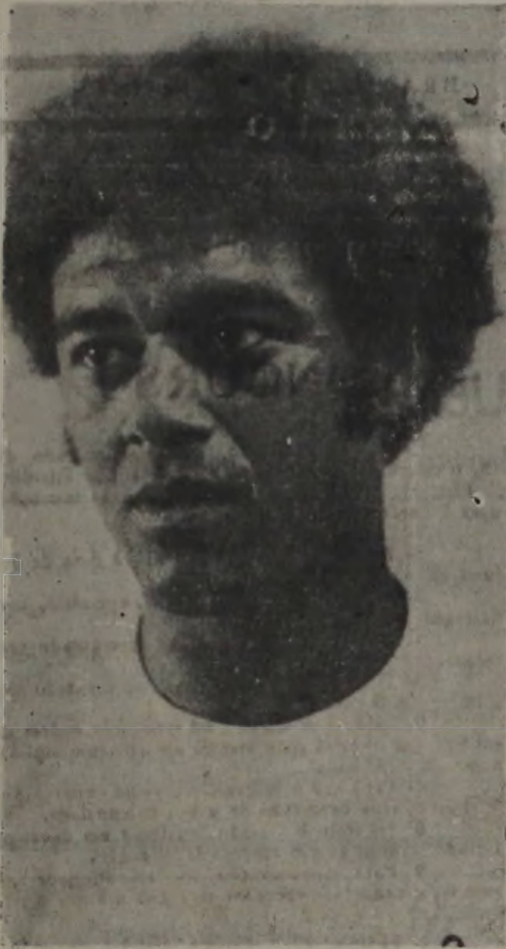
Romeu fará de tudo para o Timão