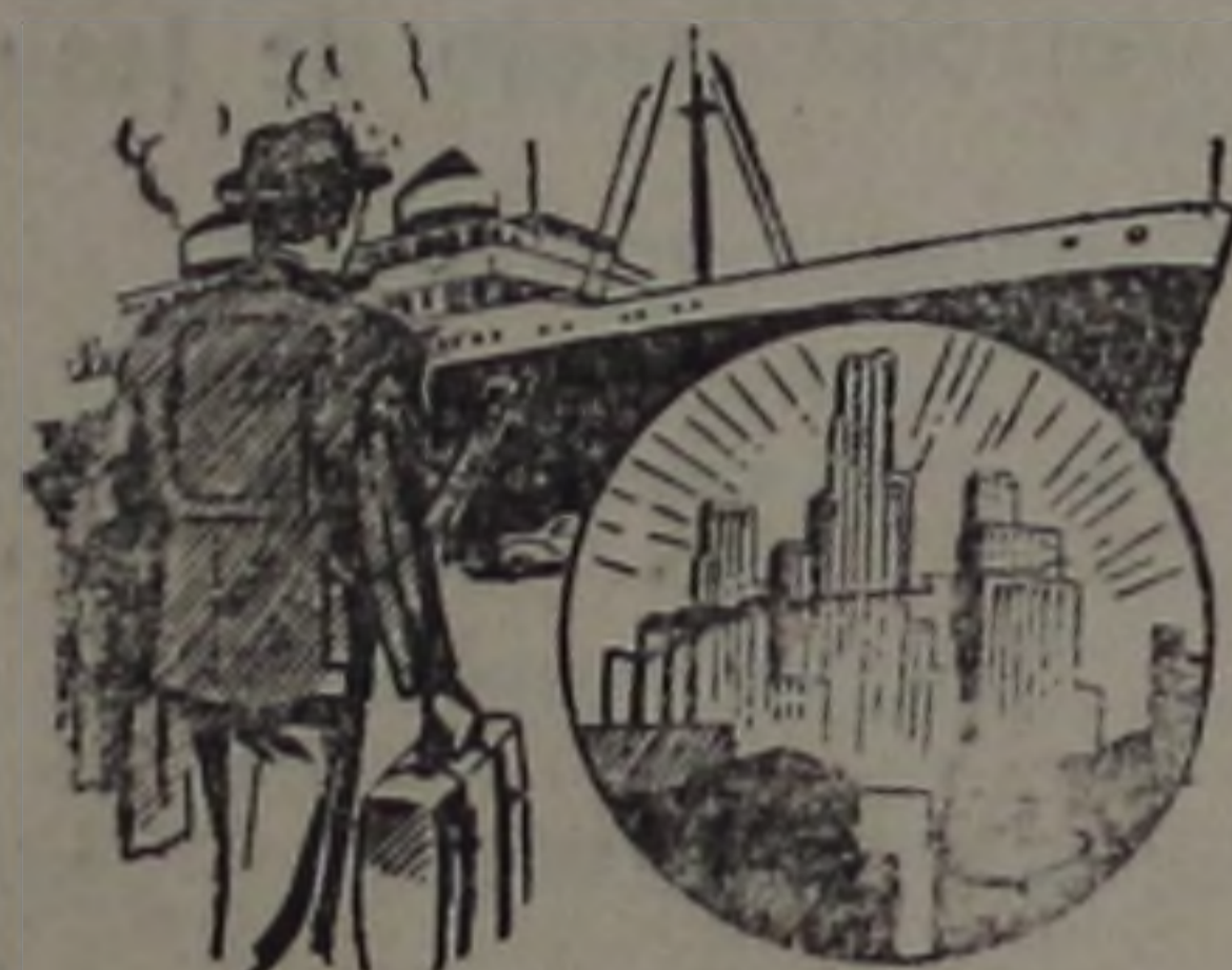
FOTO DE HOJE

O que o dirigente do time de vôlei de Bauru pensou fazer depois da derrota diante de Lençóis!