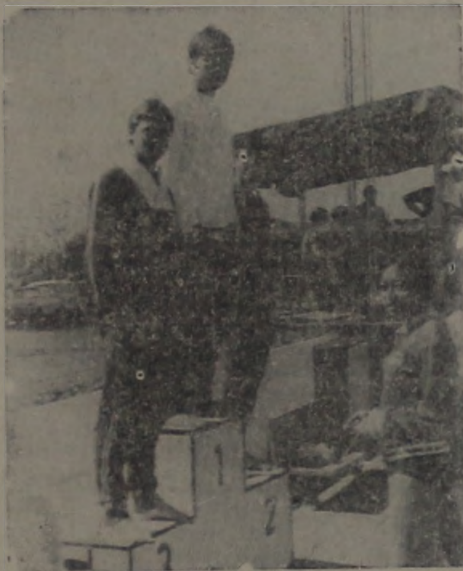
Lençóis entre os primeiros - uma tradição nos Jogos Regionais

Desejamos aos atletas e dirigentes as mesmas vitórias e disciplinas exemplares, que tem sido tradicionais na história dos jogos dos quais Lençóis participa.