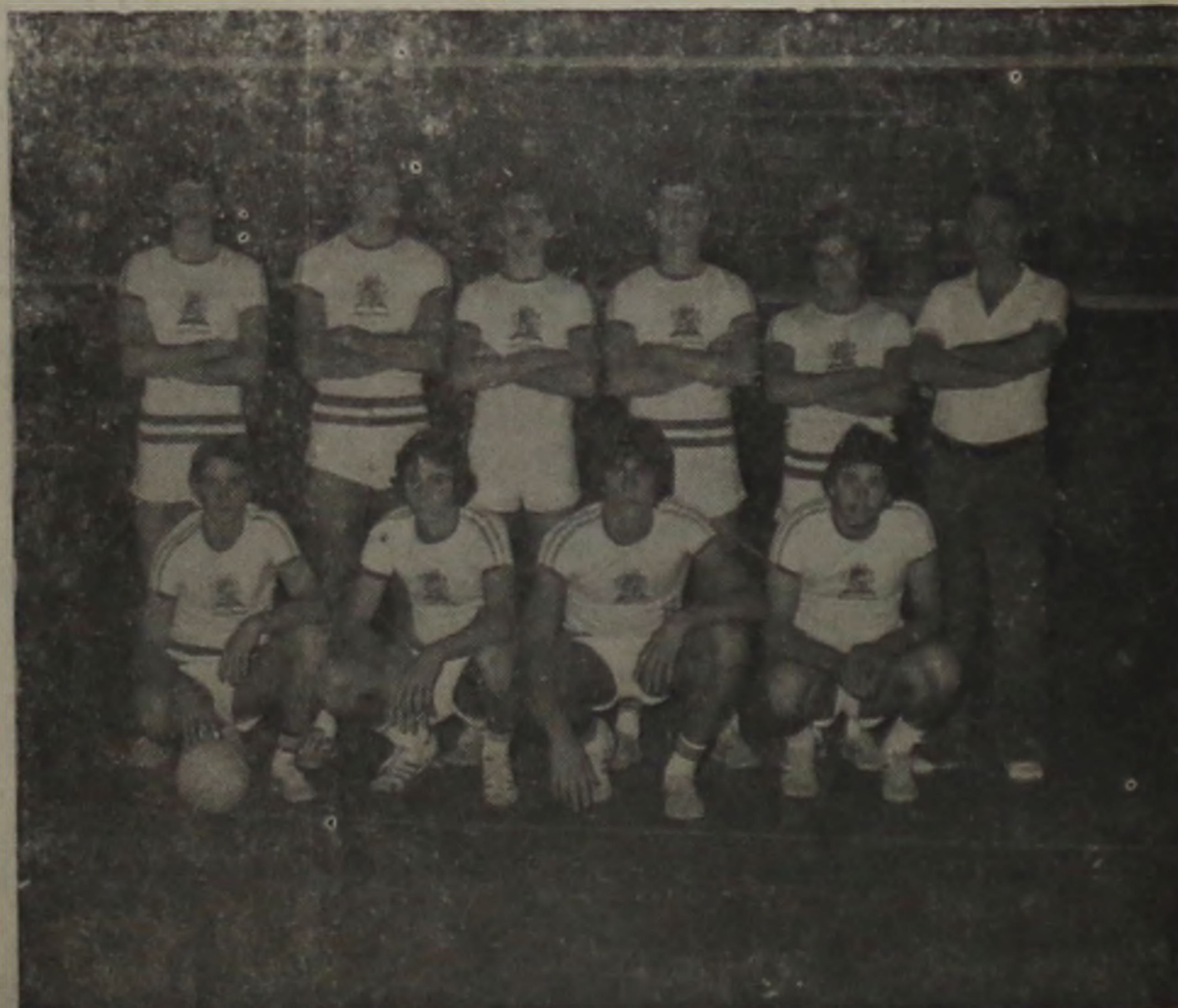
FOTO: Seleção de Voleibol Lençoense próximo ao título — campeão dos Jogos Regionais