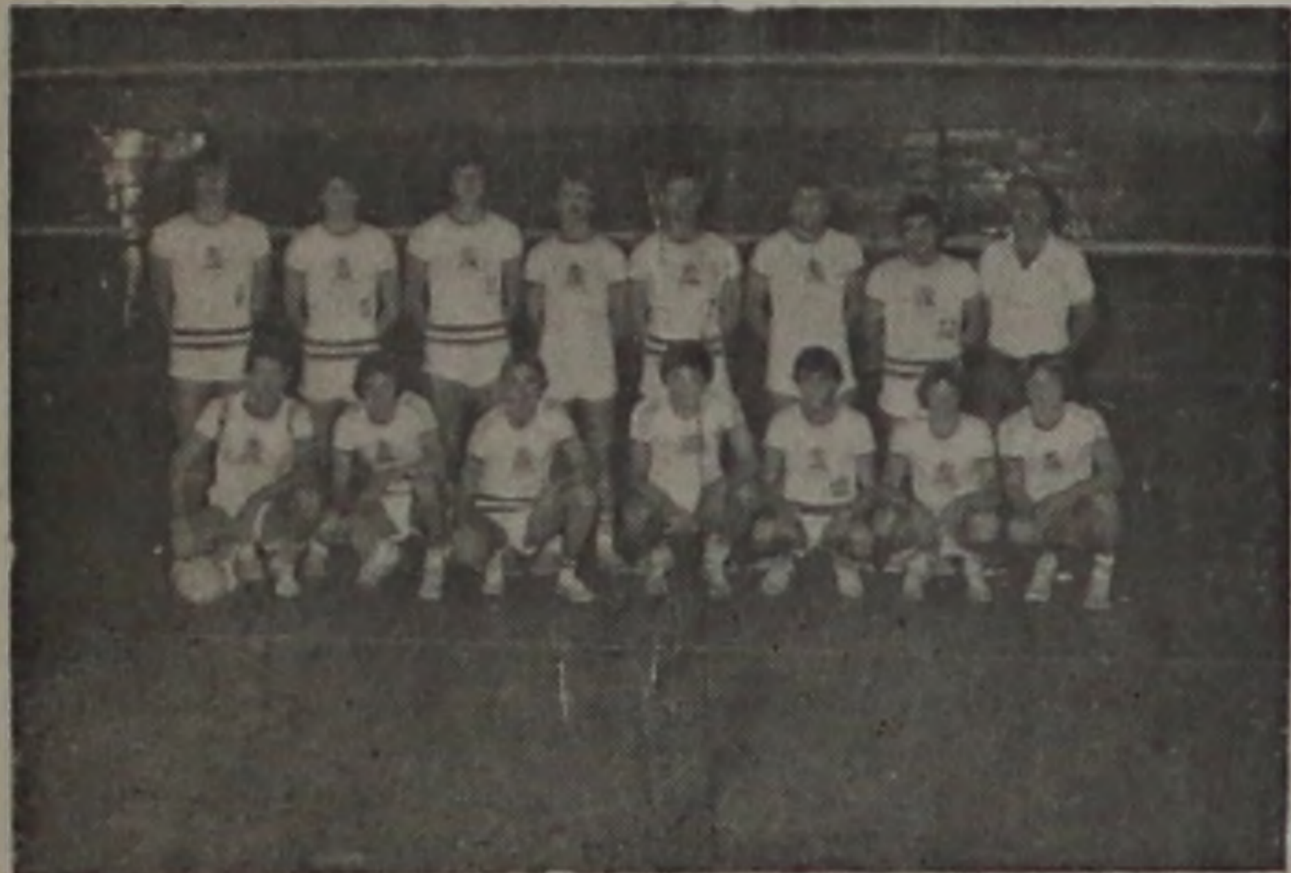
Equipe tri-campeã dos X Jogos da Zona Azul, em Tietê

Pela primeira vez na história de nossa cidade, uma equipe internacional virá participar de uma partida de voleibol frente a nossa agremiação. Trata-se da VSG BODENSEE, vice-campeã de voleibol da Alemanha.