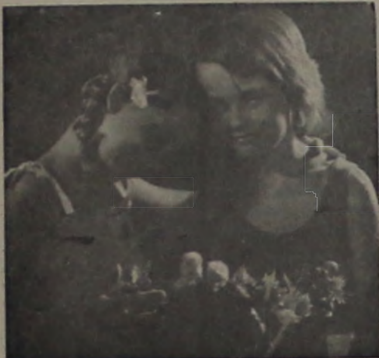
A música dará ao adolescente, todas as necessidades de seu mundo particular e indezessável

Uma das grandes falhas da época, no que se refere à educação, é justamente o setor musical. Com o aparecimento do rádio, da televisão e dos "estereos", a música tornou-se uma atividade inteiramente passiva; não há mais a necessidade de se tocar algum instrumento porque os melhores do mundo estão à nossa disposição a um simples girar de botões. Uma das principais consequências disso, embora tenhamos e lementos a técnica tirou do homem algo de muito importante: ele próprio fazer sua música, mal ou bem, construir seu mundo sonoro.