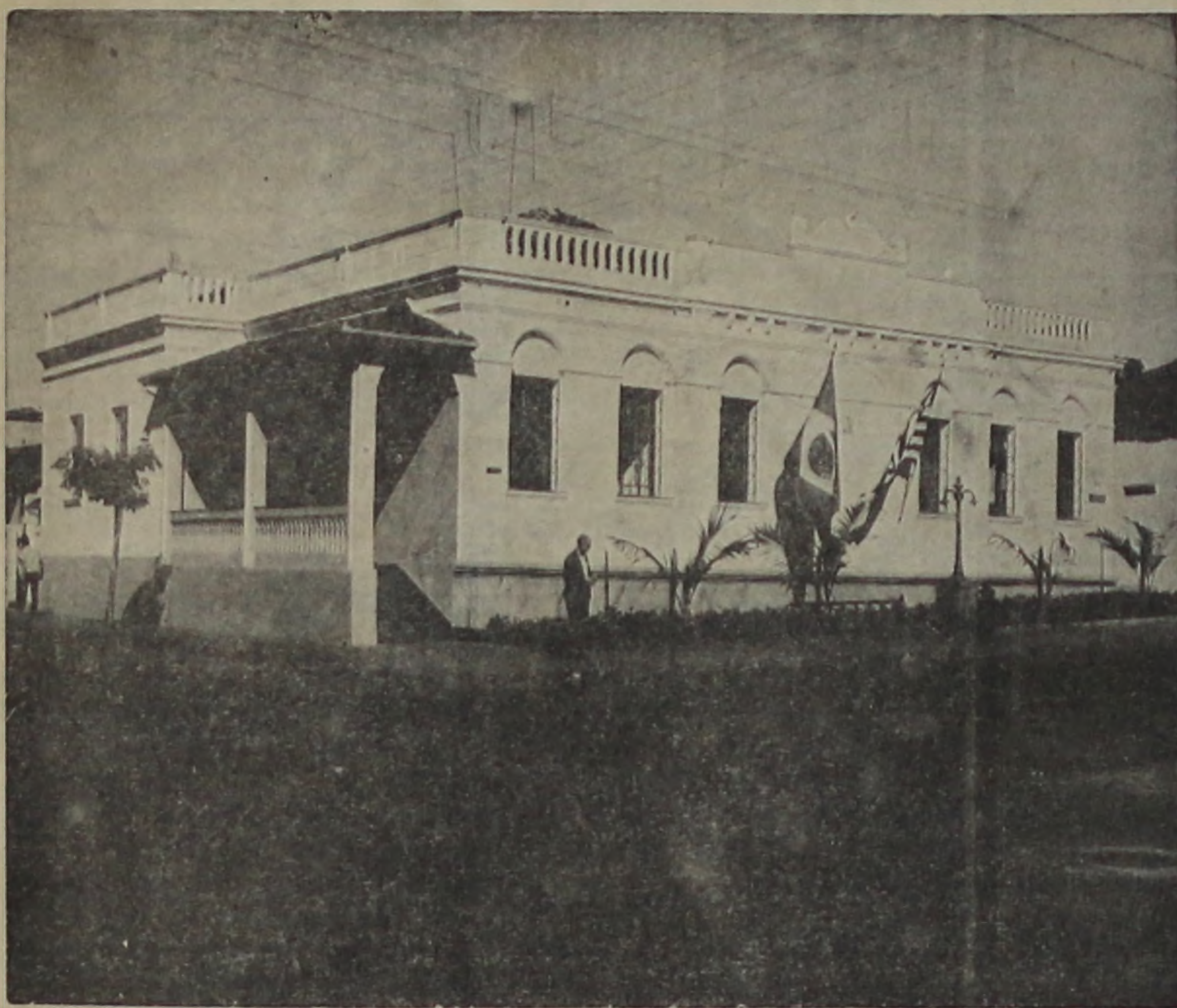
Tradição e cultura habitarão o velho Paço Municipal