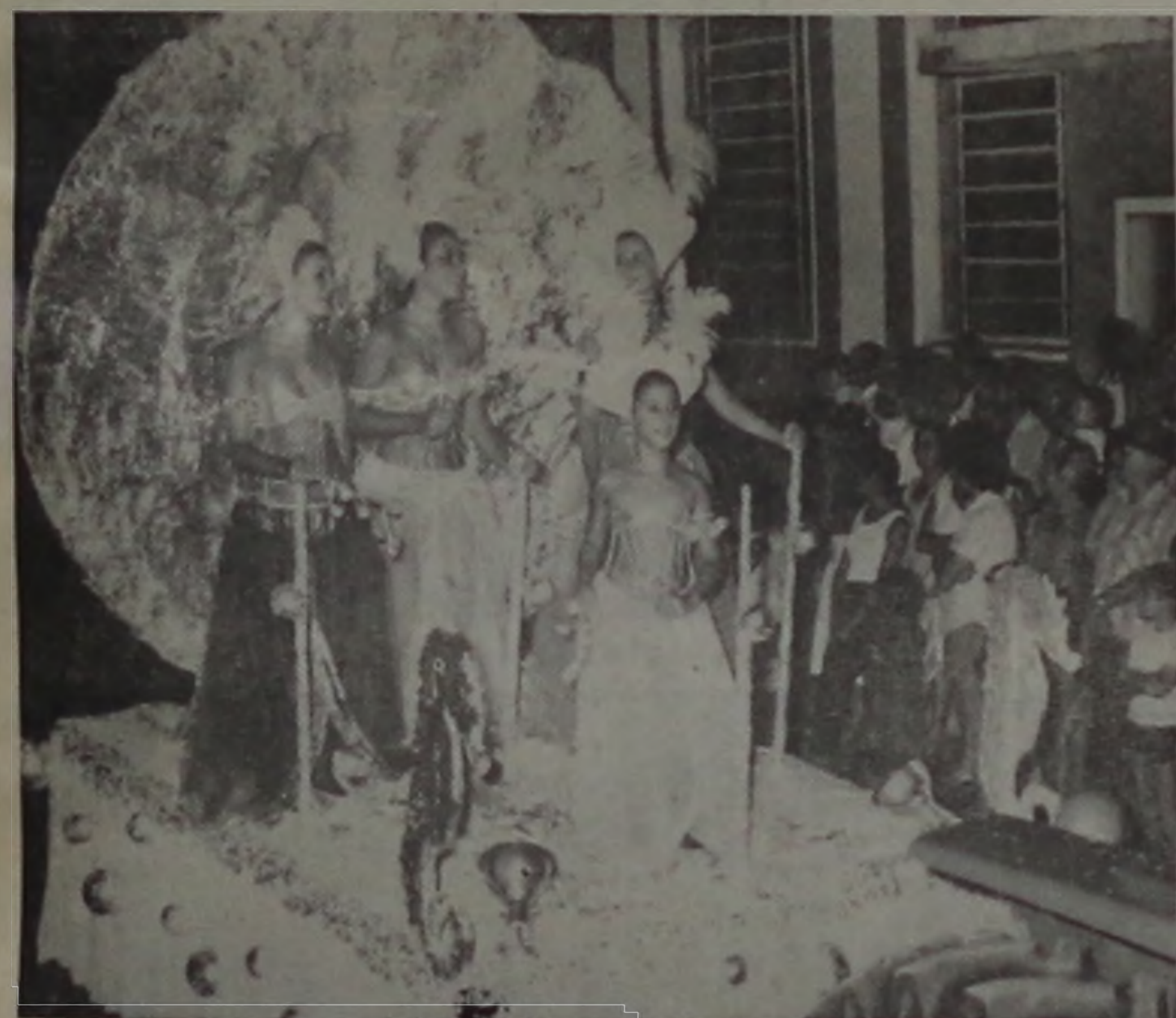
"O mar, tema eterno e suas Donzelas"

"Ficamos muito contentes por termos contribuído para que o povo tivesse novamente um carnaval de rua e felizes por tudo ter transcorrido na mais completa ordem", sentenciou.