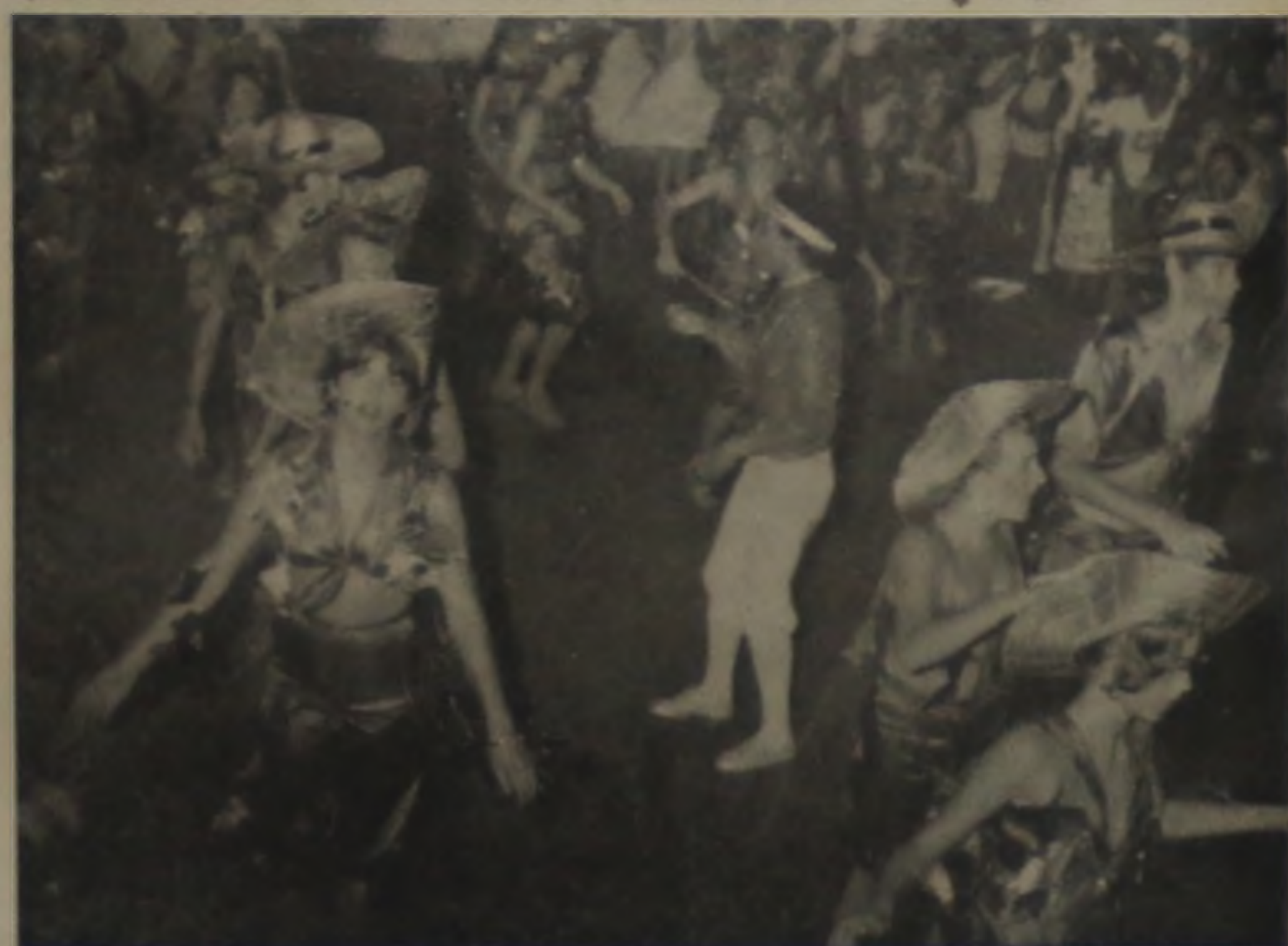
"Os Jangadeiros — Caiu na rede é peixe"