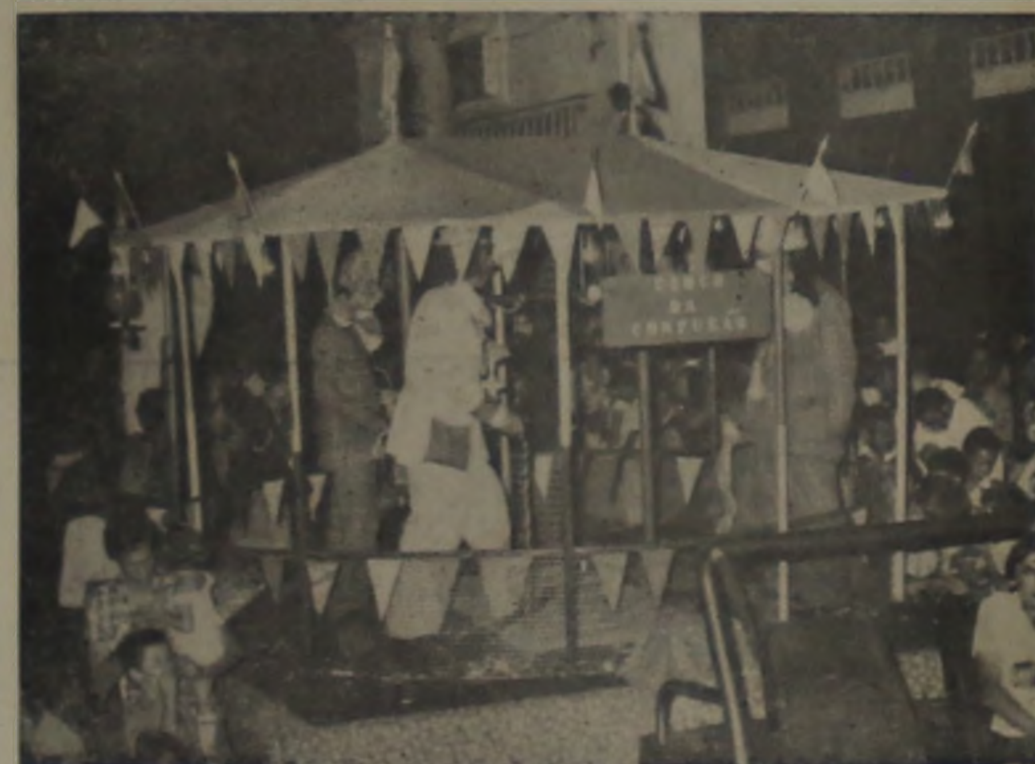
"O Circo — hilariedade para adultos e crianças"