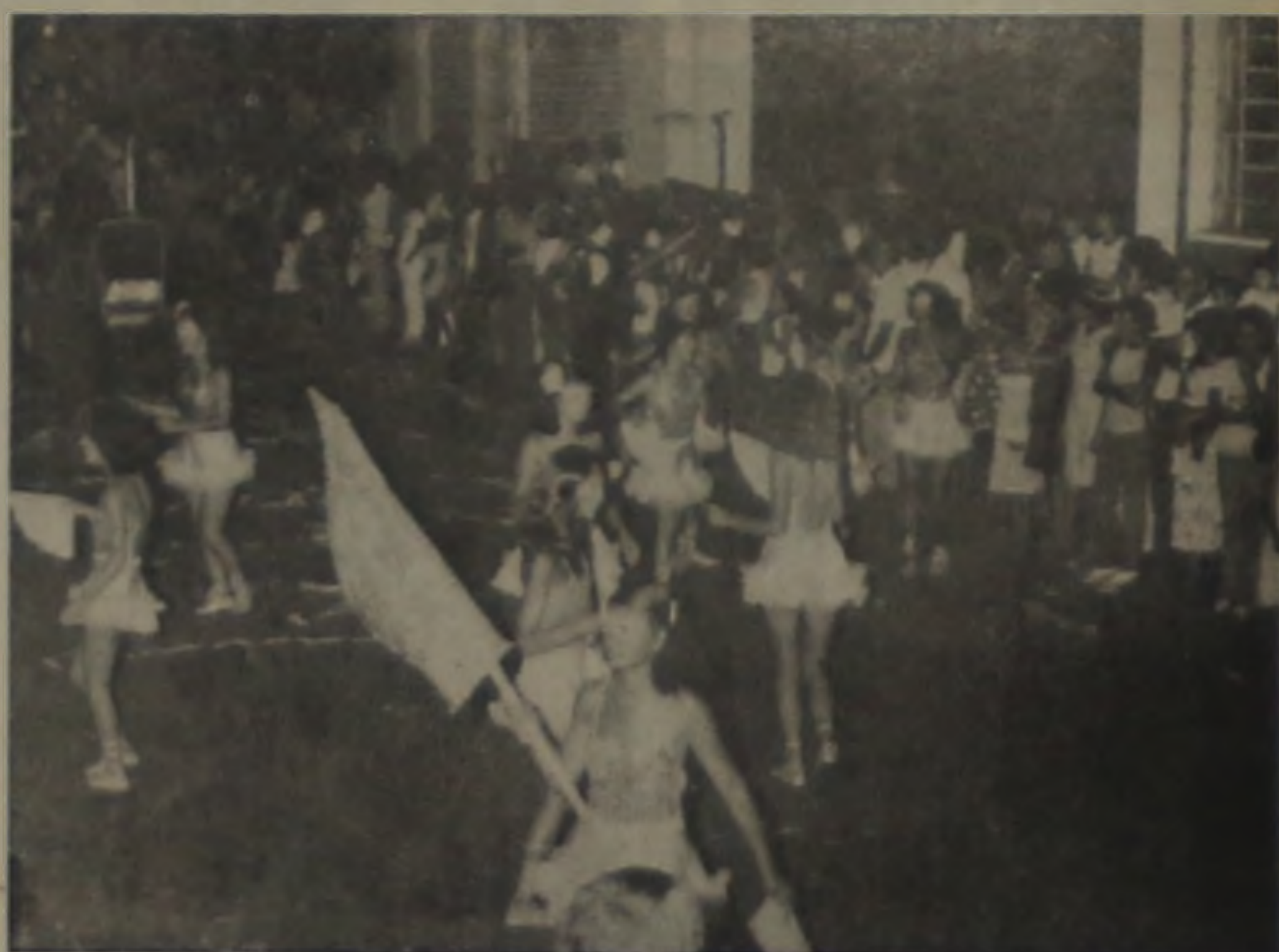
"Prás "Panteras", carnaval foi côr de rosa"