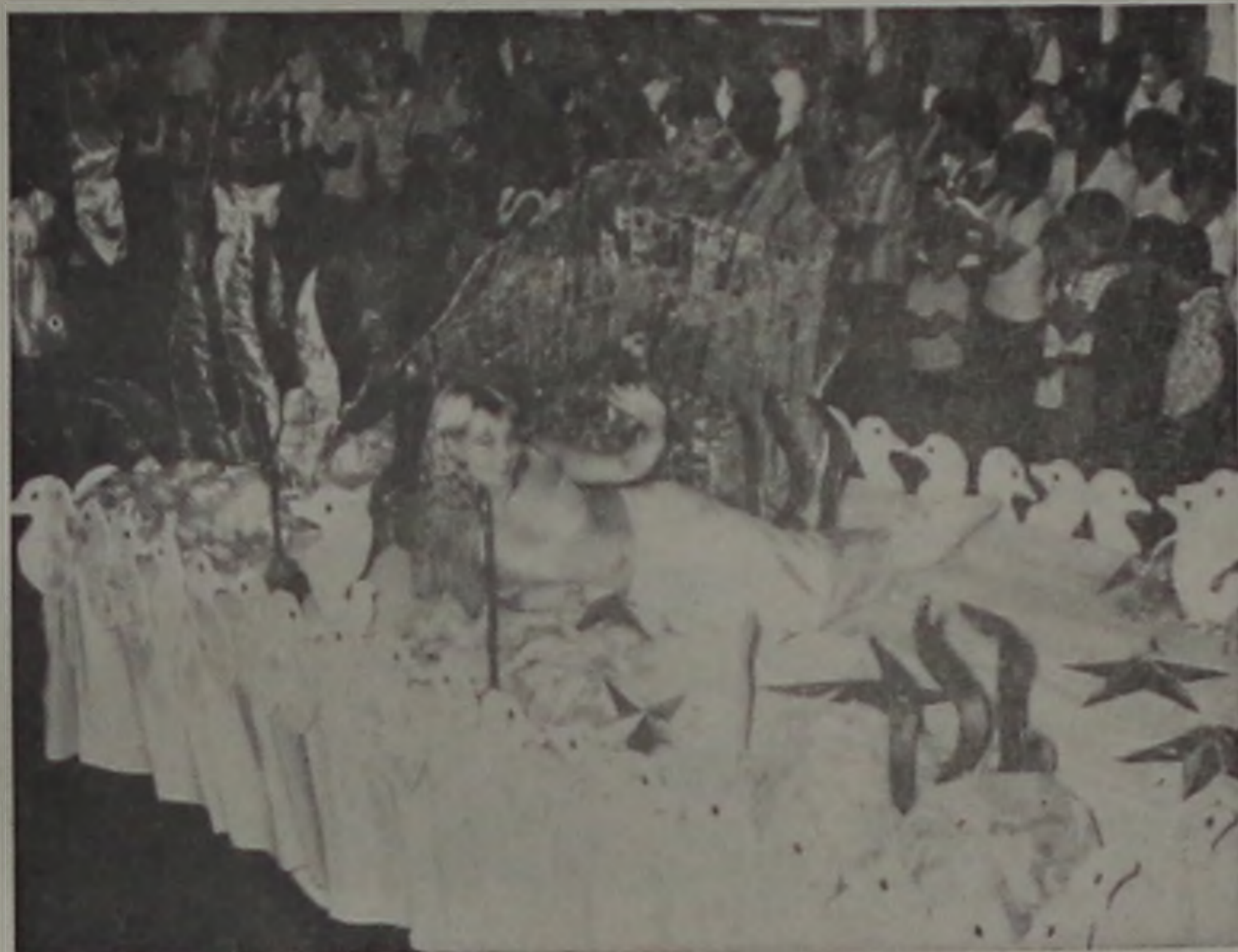
"Do mar a lenda — a loura uma realidade"

A Comissão Organizadora do Carnaval desem-