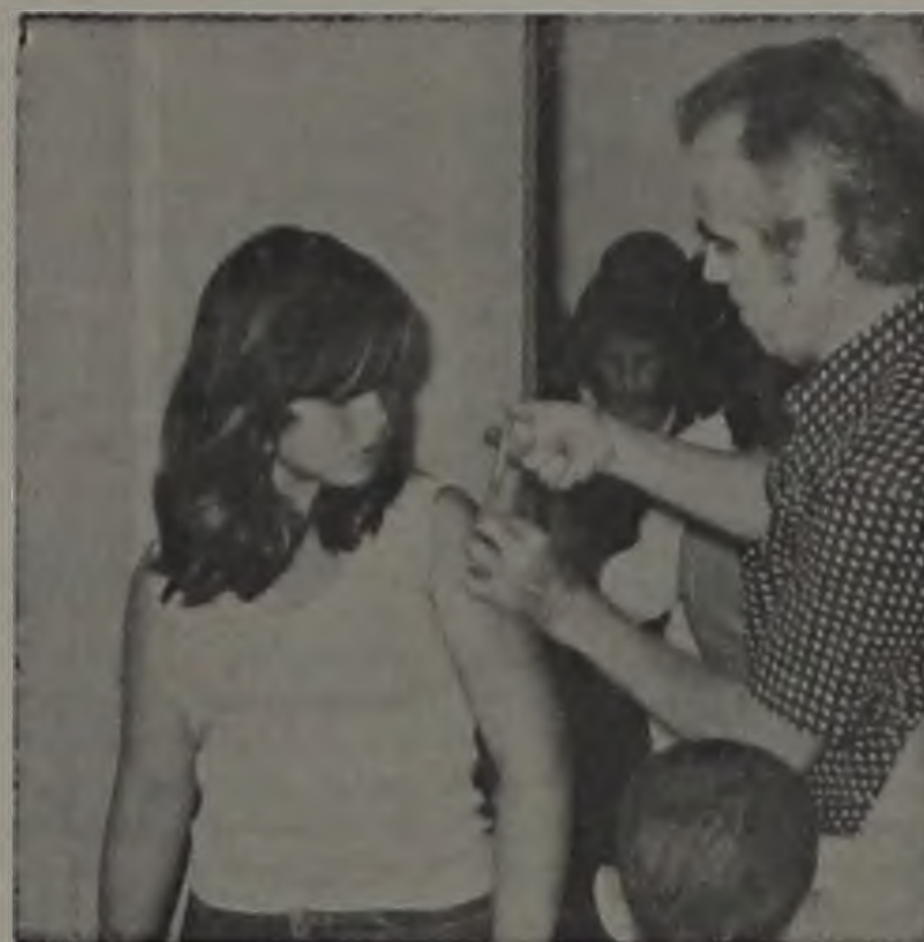
SEMANA DA VACINAÇÃO, DE 25 A 30 DE MAIO

1 — Todas as crianças menores de 5 anos devem ser vacinadas.