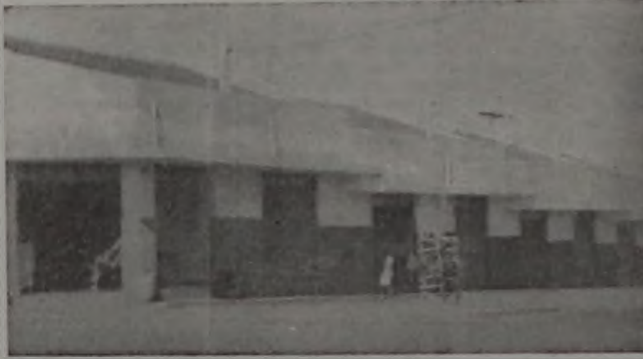
Essas portas estão fechadas. E a farmácia? E a Padaria

O ECO foi convocado e ouviu populares A moradora da casa 551, ao Posto de Saúde, principal-mente quando chove, têm que caminhar até o ponto final junto à caixa d'água, um trajeto de quase um quilômetro e além disso ao chegarem à Rodoviária precisam de outra condução até o Posto ou ir a pé. "Ninguém aqui tem condições de pagar 2 passagens. Já reclamei no escritório da