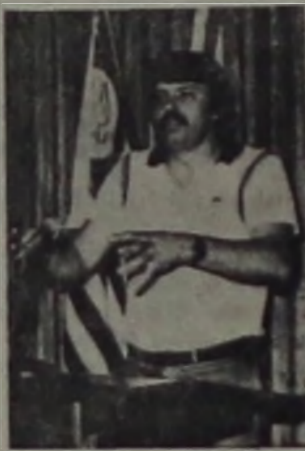
"SOU O MESMO DE 76"