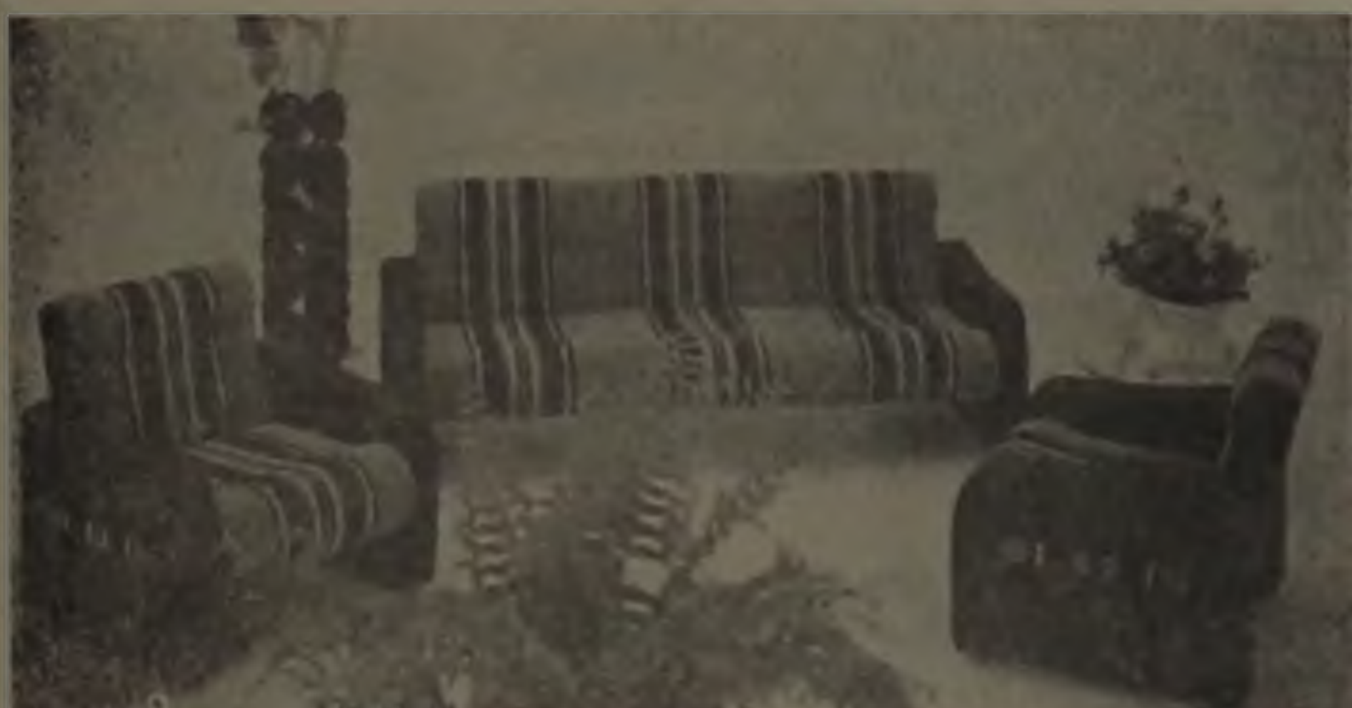
Estofado modelo Hawái revestido em chinle especial. — Côres a sua escolha — 10 pagamentos sem acréscimo