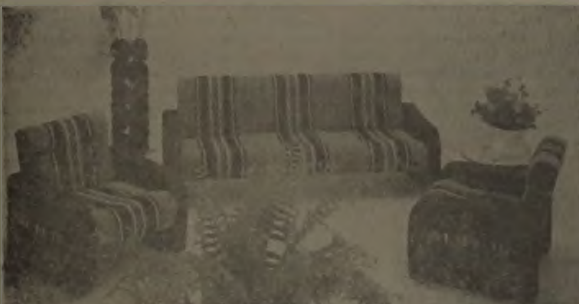
Estofado modelo Hawái revestido em chinilê especial. — Côres a sua escolha — 10 pagamentos sem acréscimo