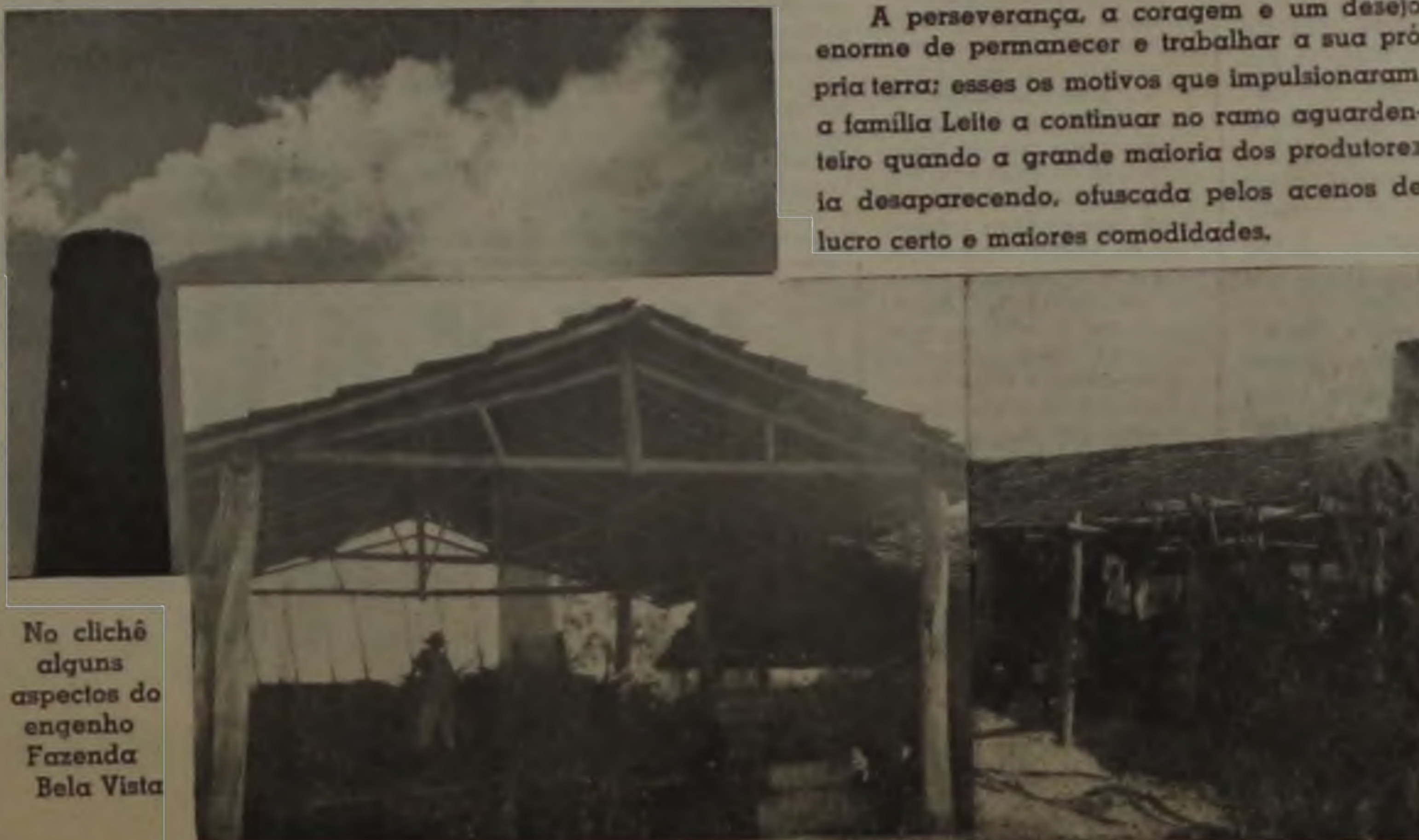
No clichê alguns aspectos do engenho Fazenda Bela Vista

Há 30 anos, um engenho primitivo moia suas primeiras canas (5 a 6 toneladas/dia), para atingir atualmente uma capacidade de 30 toneladas e produzir até 4