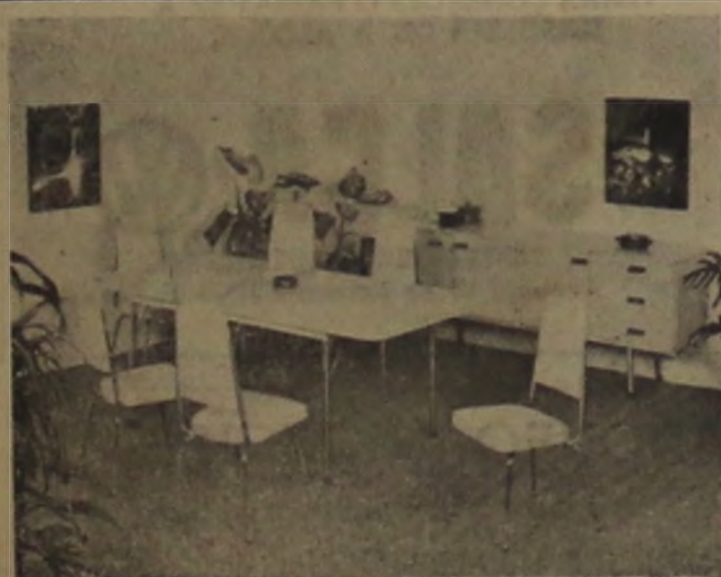
Copa fórmica, balcão baixo, mesa elástica, cadeiras estofadas. Tudo com estrutura cromada.

TRAV. JOAO RAMALHO, 35 — TELEFONE 631399 VILA S. JUDAS TADEU — LENÇÓIS PAULISTA