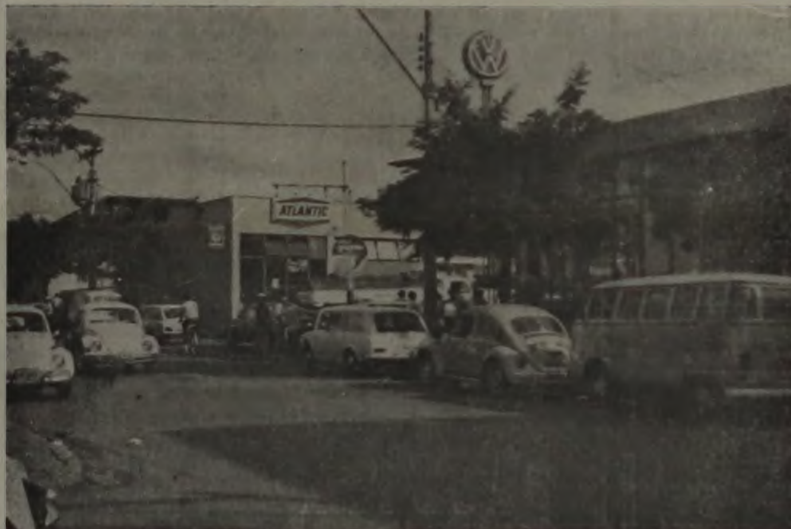
NA QUINTA-FEIRA, LONGA FILA DIANTE DAS BOMBAS DO POSTO DA SALCA

A crise no abastecimento de álcool combustível que atingiu seriamente a cidade nos últimos dez dias, chegou ao seu ponto máximo anteontem, quando nenhum dos postos locais dispunham do produto. No início da tarde, uma enorme fila se formou diante das bombas de abastecimento do posto Atlantic, anexo à SALCA (Agência Volkswagen), na Av. 25 de Janeiro, o único que ainda tinha uma reserva de estoque, mas que foi consumida rapidamente pela enorme quantidade de compradores.