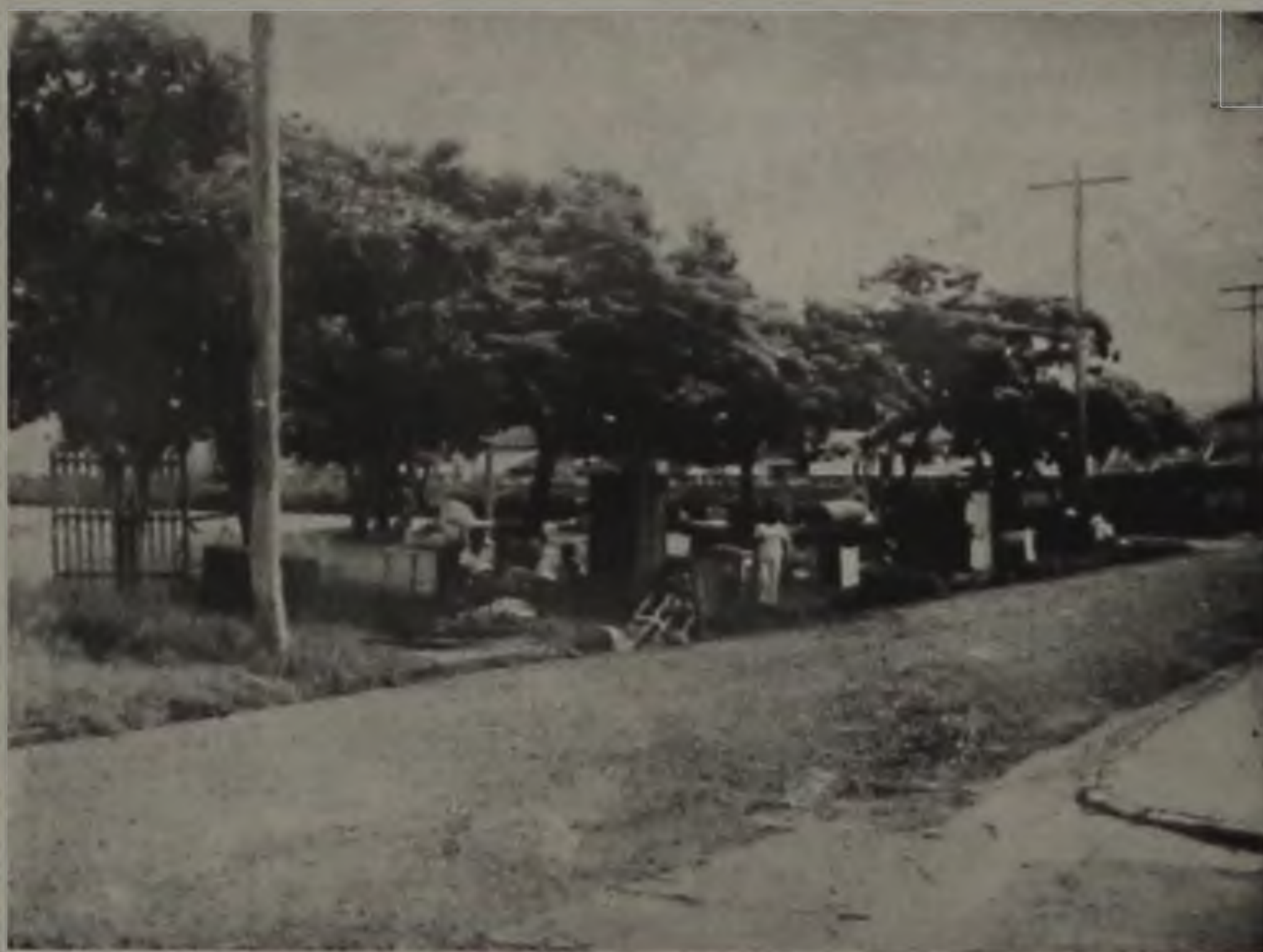
Os "sem-teto" ficaram ao relento na praça defronte à siderúrgica desativada.

Na véspera de serem "despejados", ocupantes da Sidelpa foram à Assistência Social, mas nem sequer foram atendidos pela presidente do órgão, mulher do prefeito, que mandou avisar que nada poderia fazer. O grupo se dirigiu, mais tarde, à residência do alcaide e também não obteve uma resposta satisfatória. Pelo contrário,