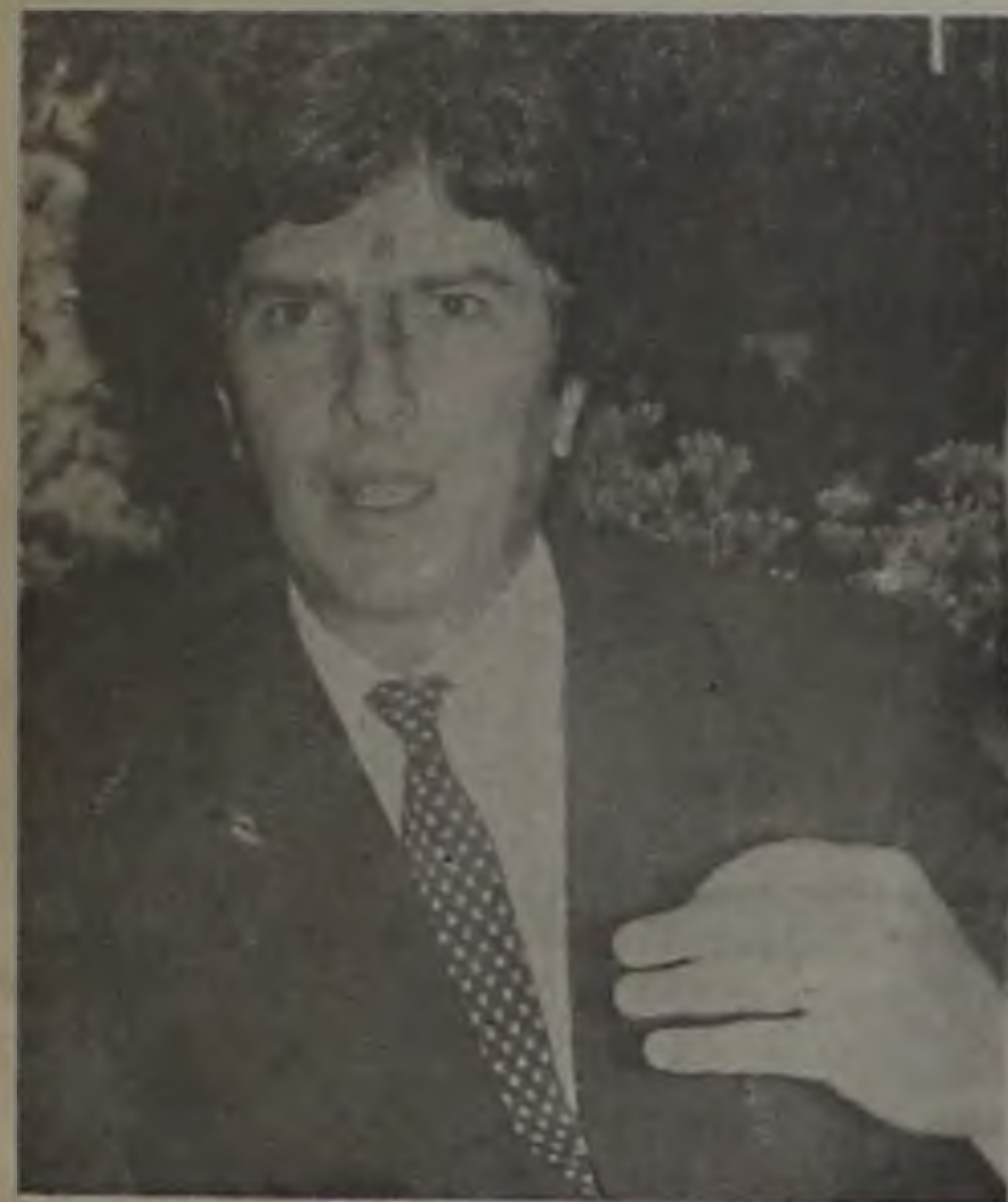
Collor: "governar para os descamisados"

Pela primeira vez nos últimos trinta anos, Brasília esteve em festa na manhã de quinta-feira para as solenidades de posse de um presidente eleito pelo povo. Fernando Collor de Mello e o vice Itamar Franco fizeram o juramento à Constituição às 9h55 e foram declarados empossados pelo presidente do Senado, Nelson Carneiro.