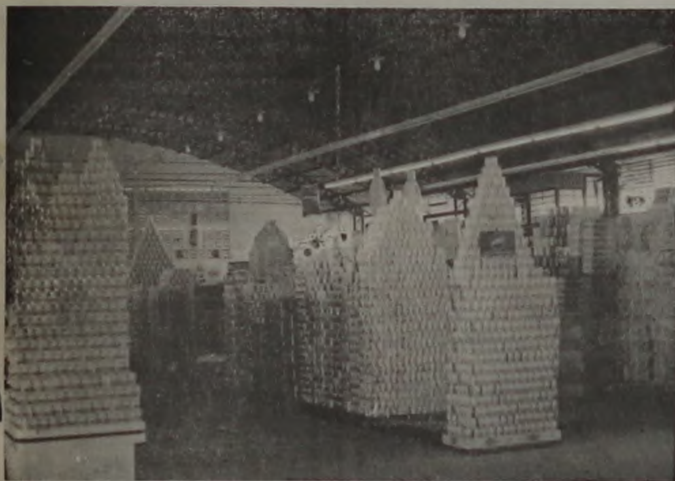
PESQUISAR E IMPORTANTE, SOBRETUDO NOS SUPERMERCADOS

Ao contrário do que aconteceu quando da decretação do Plano Cruzado, a população de Lençóis não está abusando do consumo e, até mesmo, tem proporcionado um movimento bem abaixo do normal no comércio. A falta de dinheiro não é a única razão para esse fenômeno, pois há também a expectativa de que os preços baixem ainda mais em função da urgência que os comerciantes têm de girar o estoque e com isso refazerem o caixa.