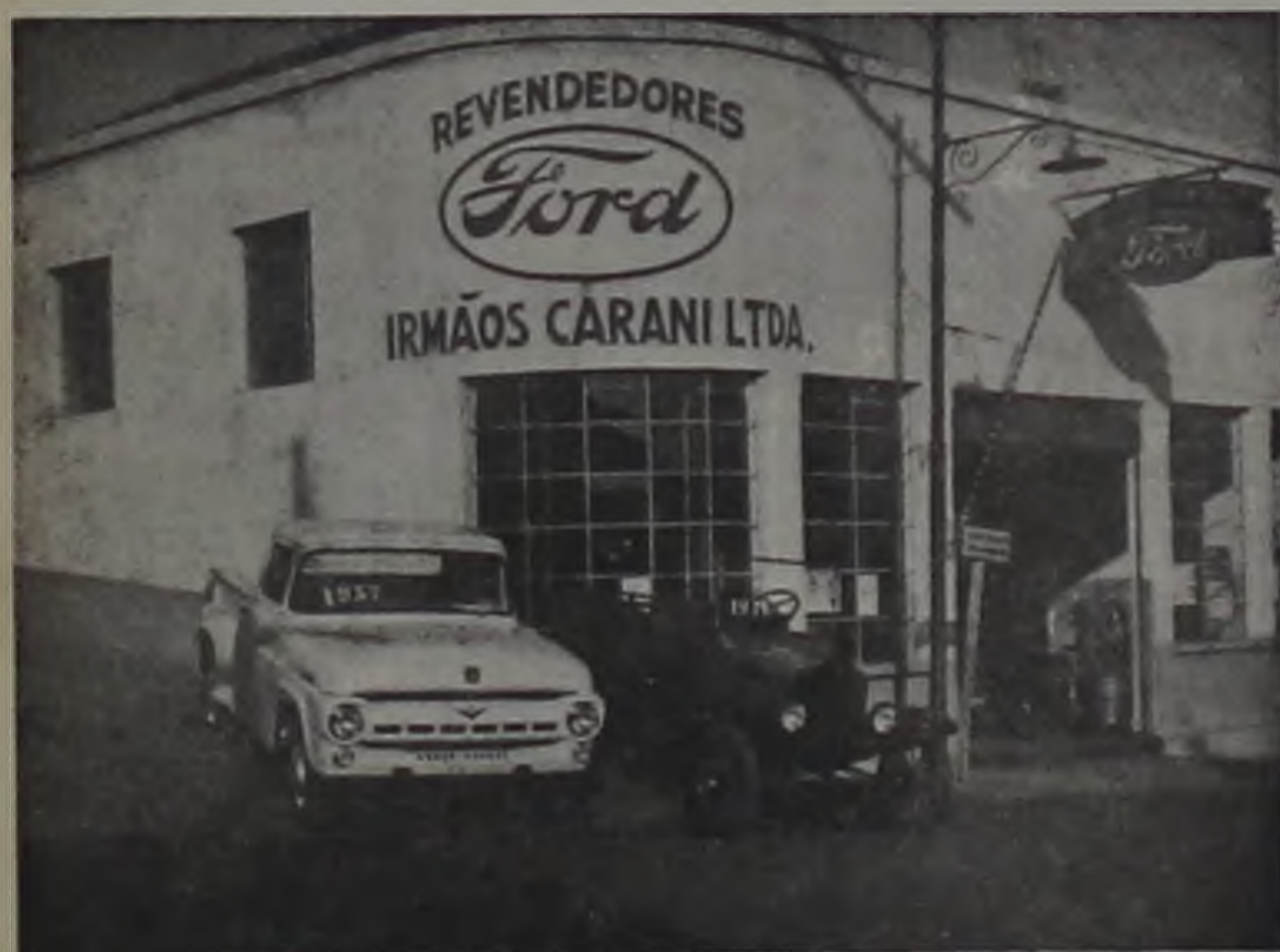
UM DETALHE SAUDOSISTA: ANO DE 1957, A INDICAÇÃO S. PAULO, NA RUA XV.