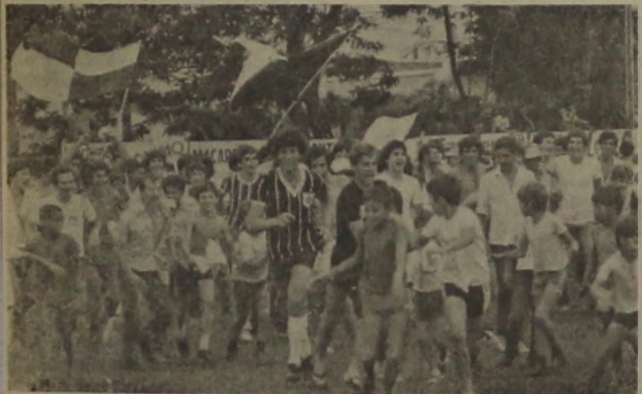
Depois do jogo a festa. Havíamos vencido o único adversário capaz de nos tirar o título.

Era domingo e, embora a equipe representante da cidade no campeonato da Terceira Divisão ainda tivesse três adversários pela frente, Lençóis vivia um clima de decisão. O adversário, o C.A. Jalesense, era a única equipe que até então ostentava a condição de invicto além do nosso "Demolidor", o C.A. Lençoense, equipe que fez a melhor campanha de todo o certame.