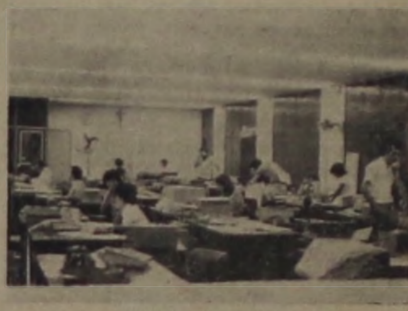
Vista dos estúdios da indústria

Publicar assim que receber a graça. M.L.P.O