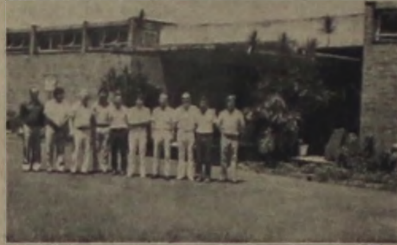
Mostra a entrada da fábrica com os representantes das entidades conveniadas

Por mais este ato de fé e caridade cristã, a família enlutada agradece.