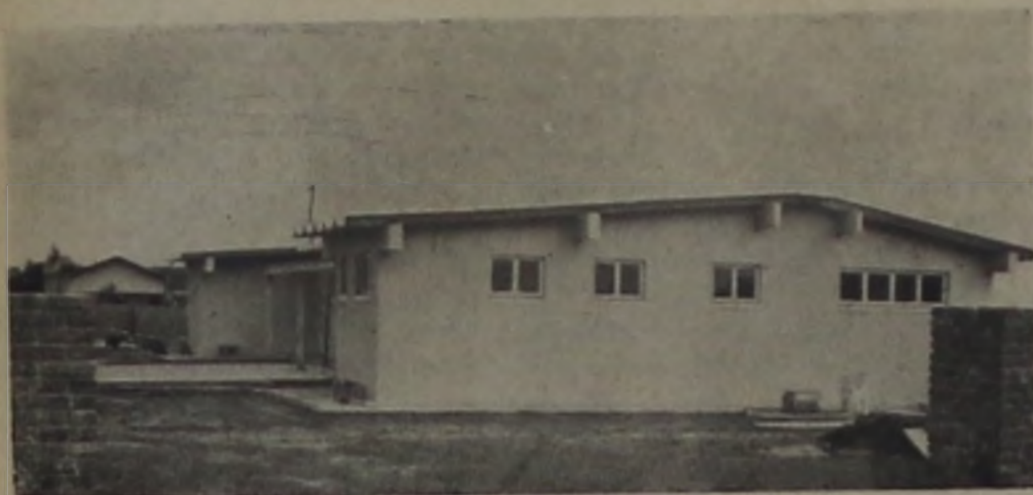
O novo prédio da Polícia Militar

Foi das mais significativas a solenidade de inauguração do prédio da Cia. de Polícia Militar, na Vila Humaitá. Lá estiveram autoridades e o povo local e lideranças regionais, entre elas os prefeitos de Duartina, Iacanga, Agudos, Arealva e Lucianópolis, que vieram numa atitude de homenagem à Polícia Militar e à própria comunidade lençoense.