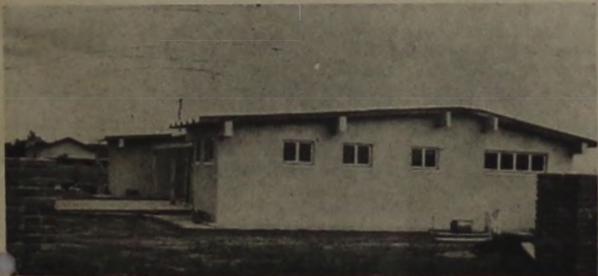
O novo prédio da Polícia Militar