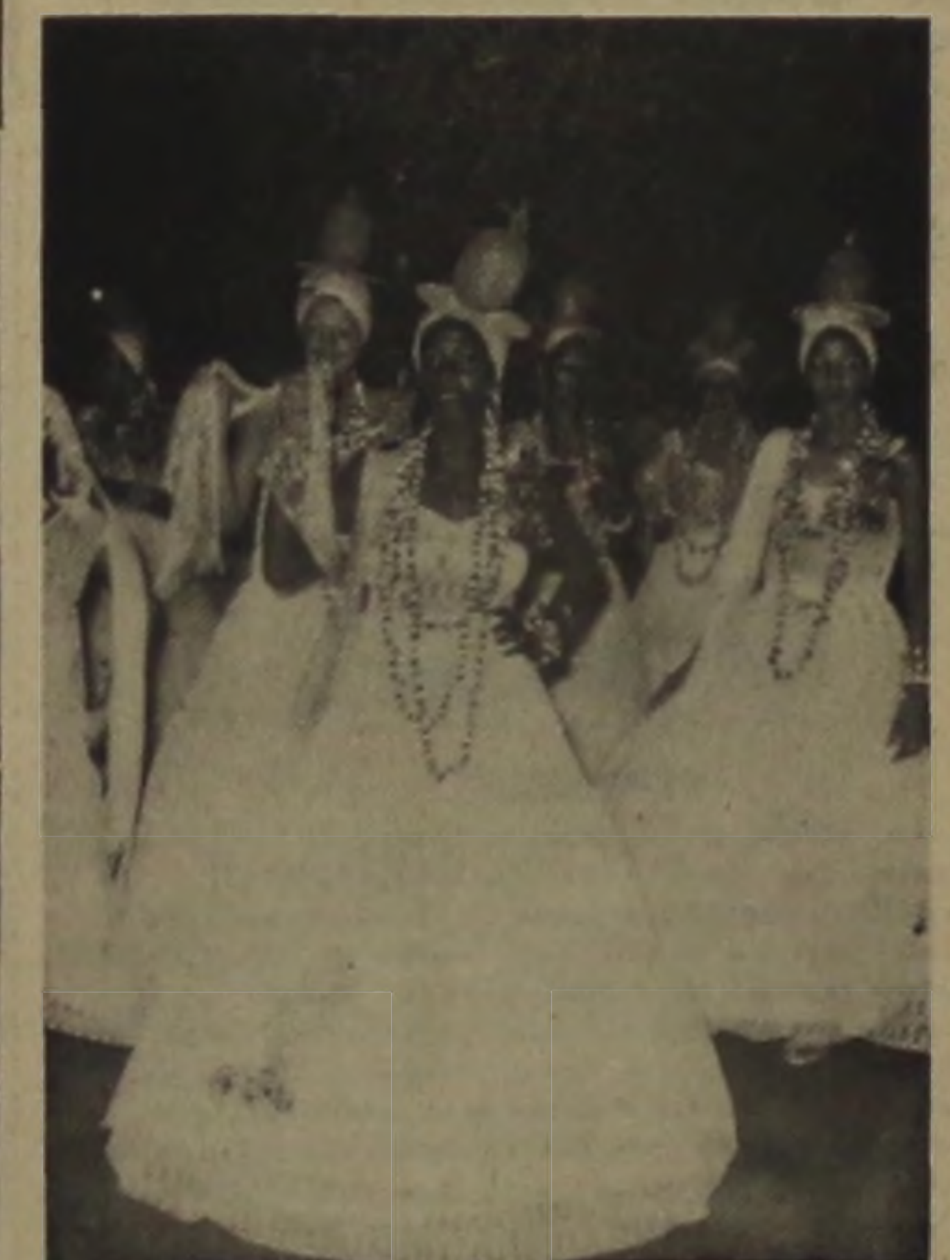
A preocupação com a Escola de Samba começa cedo pois, sem ela, não há carnaval.