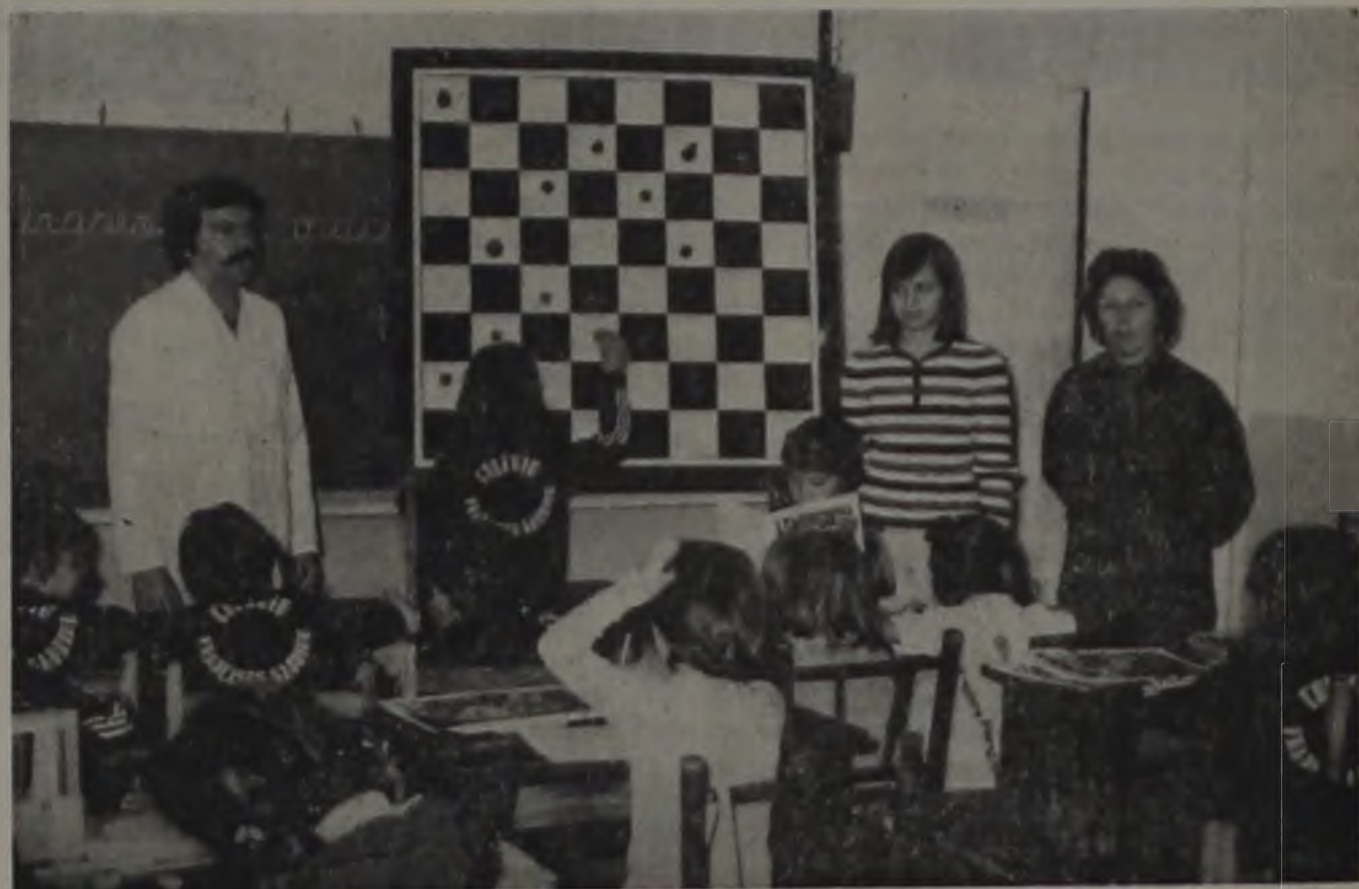
Conhecer a escola de seu filho é uma forma de incentivá-lo nos estudos, pois aí ele passa as horas mais importantes do seu dia.