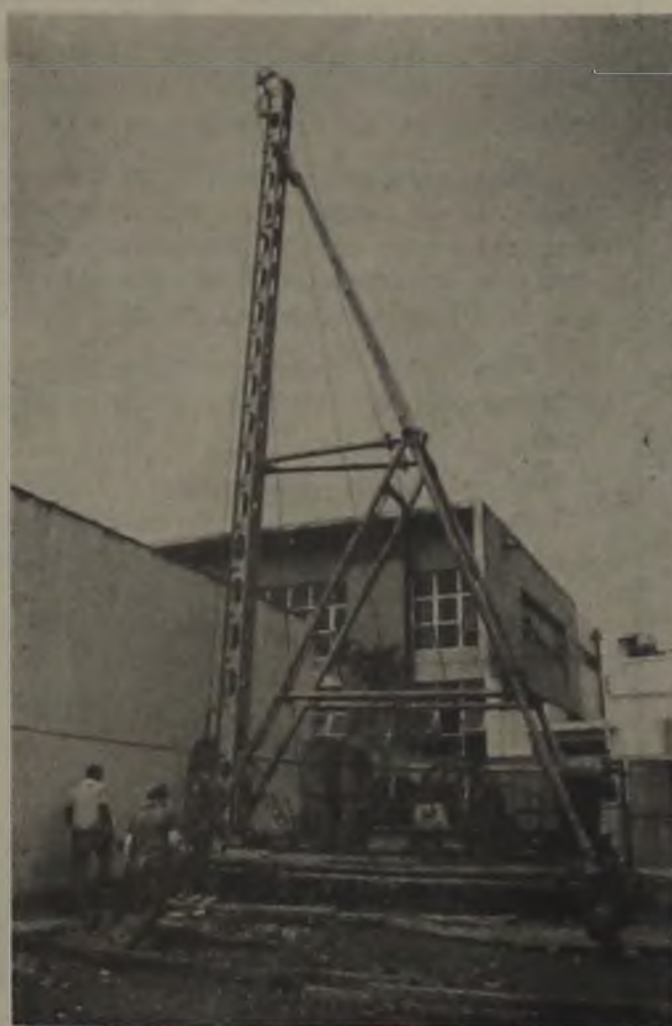
O início da obra, deu-se há apenas alguns meses.

Está em fase adiantada de acabamento a obra do novo prédio do Banco Itaú, na confluência das ruas XV de Novembro e Cel. Joaquim A. Martins. Esta semana já estavam em fase de colocação os vidros. Em casa nova o Itaú terá condições de ampliar e prestar de melhor forma os seus serviços à sua clientela lençoense.