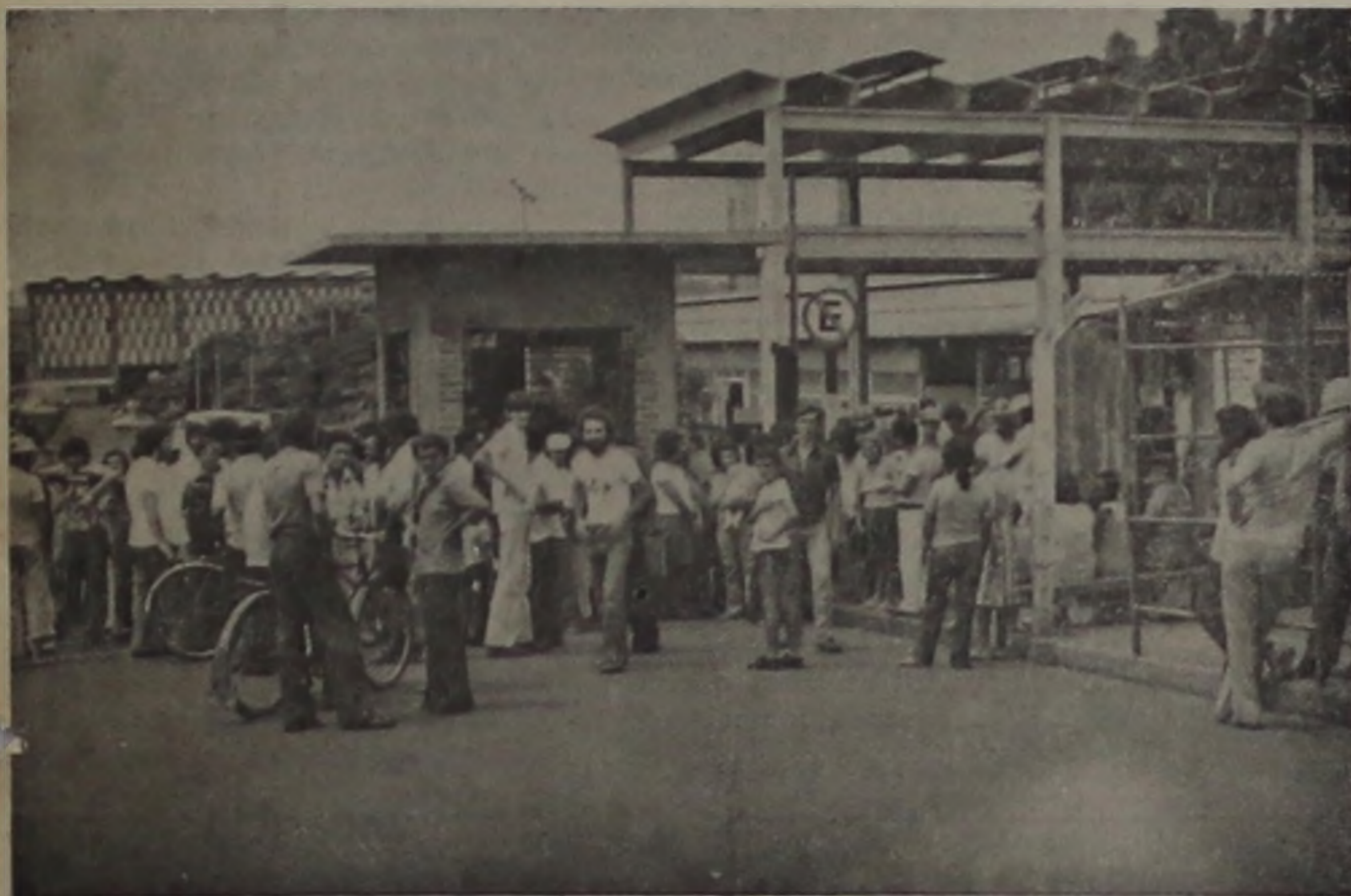
Cenas como essa não voltarão a ocorrer na Sidelpa, pois o decreto de Ideval vai sanear a economia da empresa para ela poder continuar oferecendo os 300 empregos diretos e os 700 indiretos à cidade e região

— Atitude mereceu aplausos em vários setores, inclusive na Câmara Municipal de São Paulo —