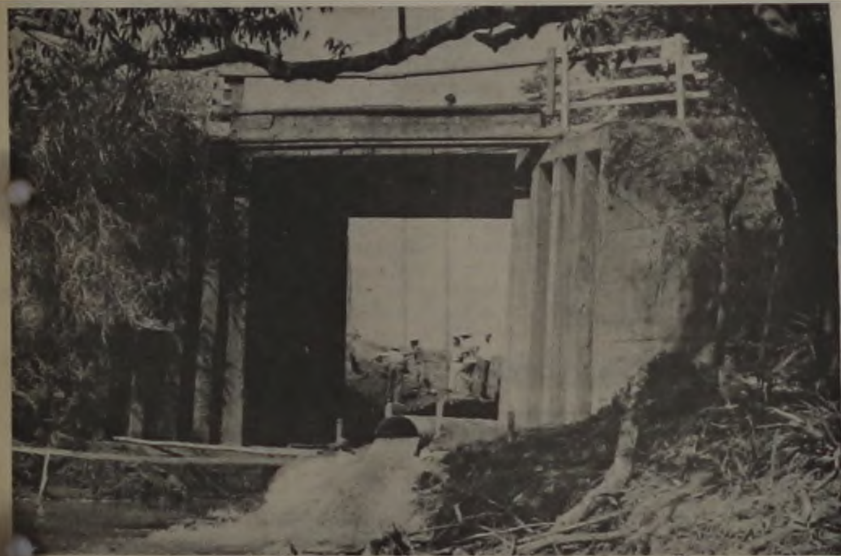
Algum tempo atrás os moradores da Cecap não imaginavam que esta ponte seria completamente remodelada.

Está terminado o serviço de ampliação da ponte de ligação do Jardim Cecap. Aquilo que em princípio parecia um pequeno reparo transformou-se praticamente num proje