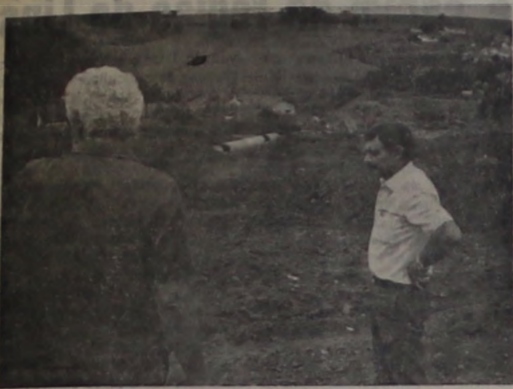
— Via de acesso em construção e logo começa a implantação da ponte

SEJA BEM MAIS EXIGENTE. SABENDO O QUE A SALCA TEM PARA LHE OFERECER: