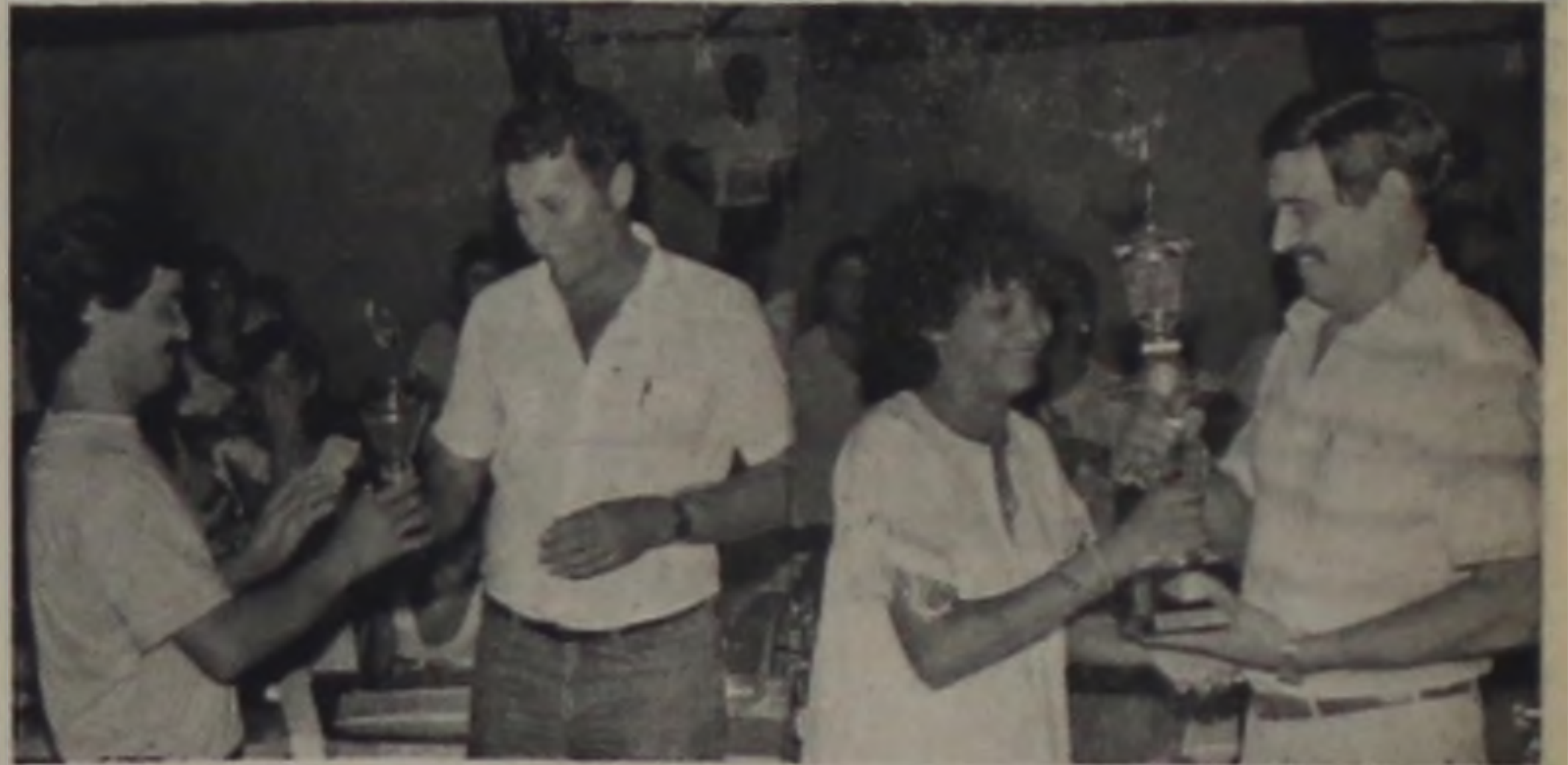
No momento da premiação, a emoção dos contemplados