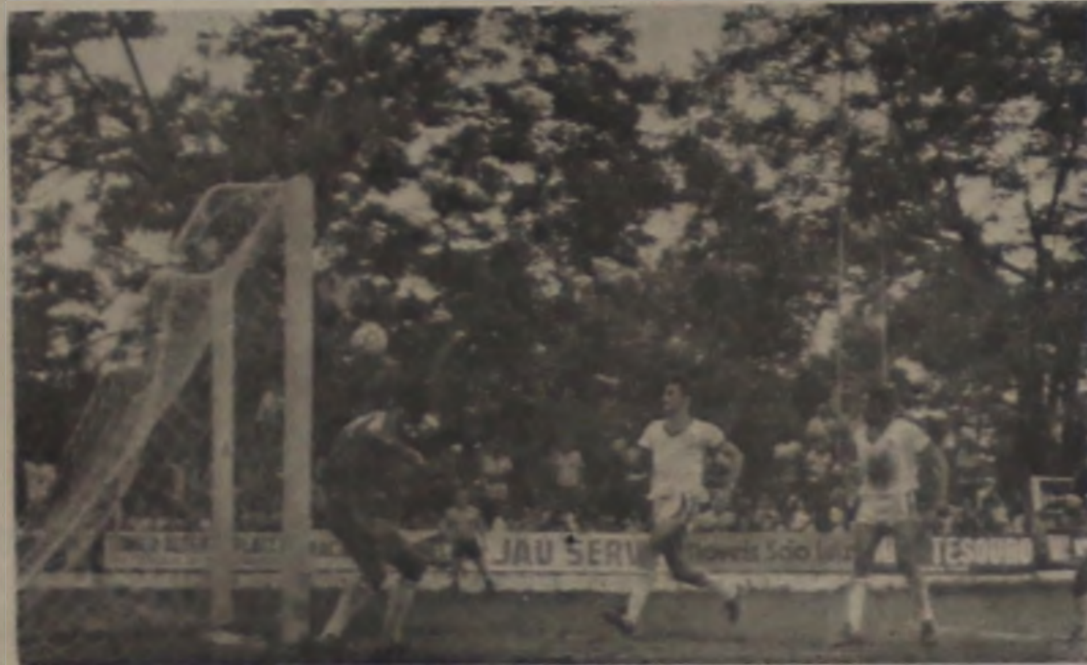
Marin exigiu ampliações para que o "Bregão" comporte 5 mil torcedores

Por determinação do presidente da Federação Paulista de Futebol, Lençóis Paulista corre o risco de mais uma vez ver o seu time em condições de inferioridade. Na semana passada o clube recebeu o ofício assinado por José Maria Marin, que exige a ampliação do estádio local dos atuais 1670 para nada menos que 5 mil lugares, além de outras obras, para que o nosso clube possa permanecer disputando a 2.ª divisão. E o pior de tudo é que — como quem desconhece o tempo que duraria uma obra dessa natureza —, o sr. Marin está exigindo que tudo esteja pronto até o próximo dia 7, isto é, amanhã. Caso contrário o time estará fora.