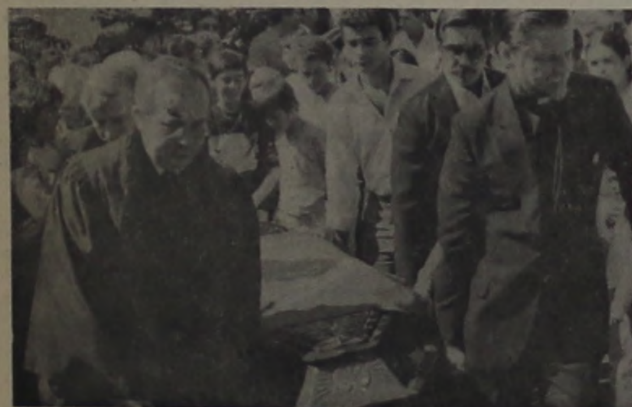
Da igreja, o corpo do imortal saiu pelas mãos de seus familiares.