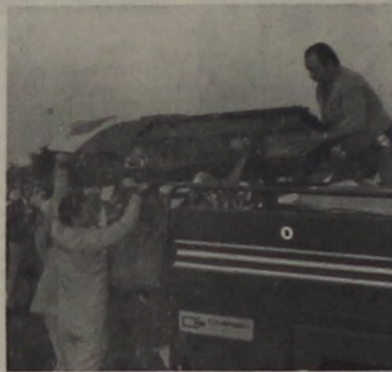
No aeroporto de Bauru, a transferência da esquife para o carro-bombeiro

Ideval decretou luto oficial por três dias e ponto facultativo na terça-feira até o meio-dia para que a população participasse das últimas homenagens ao conterrâneo ilustre.