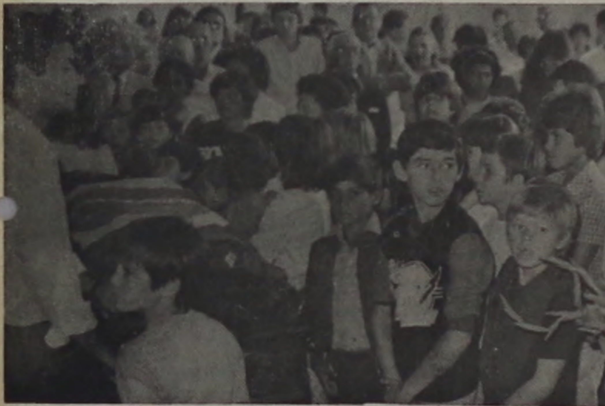
RODEADO DE CRIANÇAS, COMO SEMPRE VIVEU...