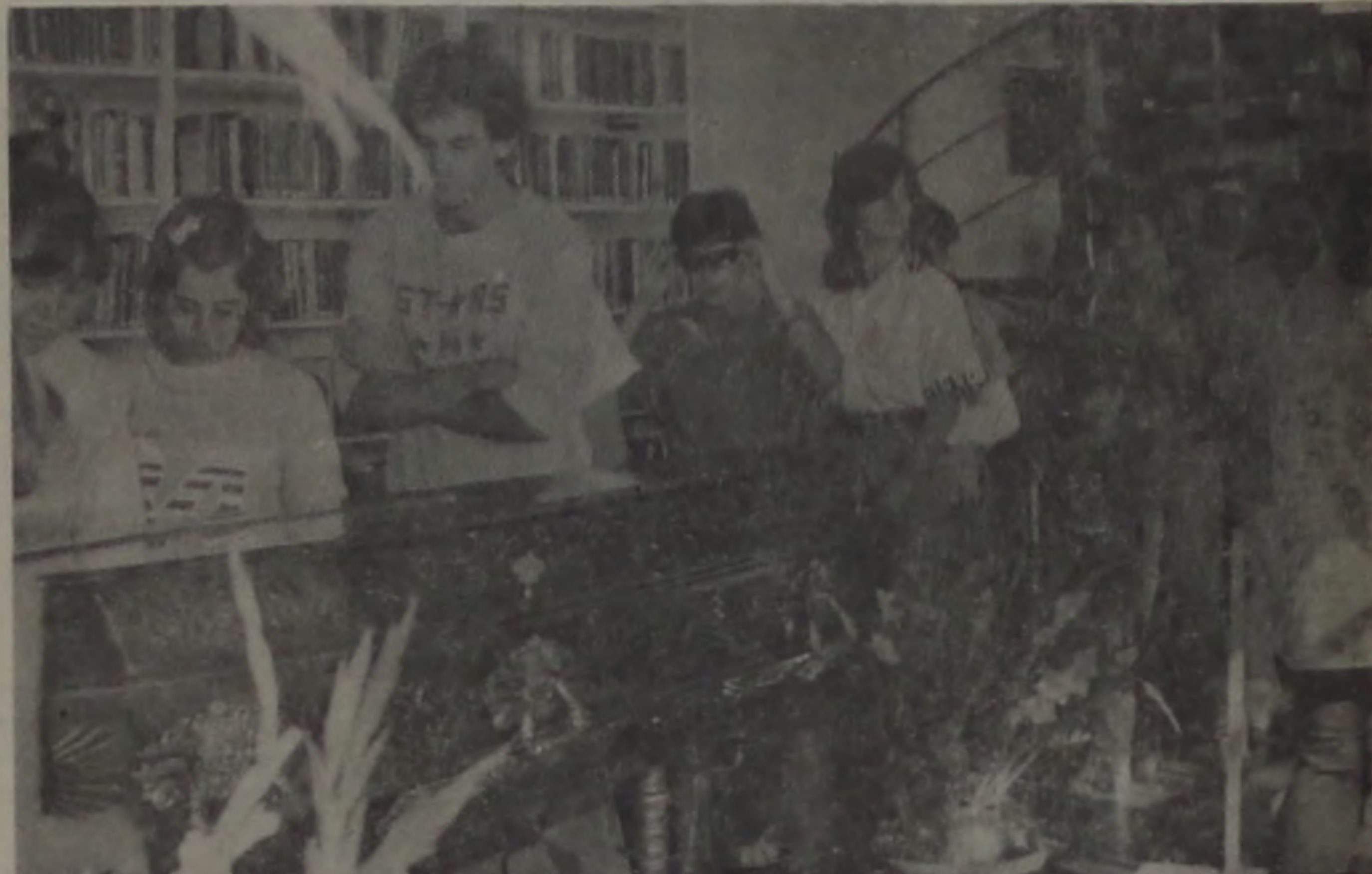
Filas intermináveis durante a visita à biblioteca