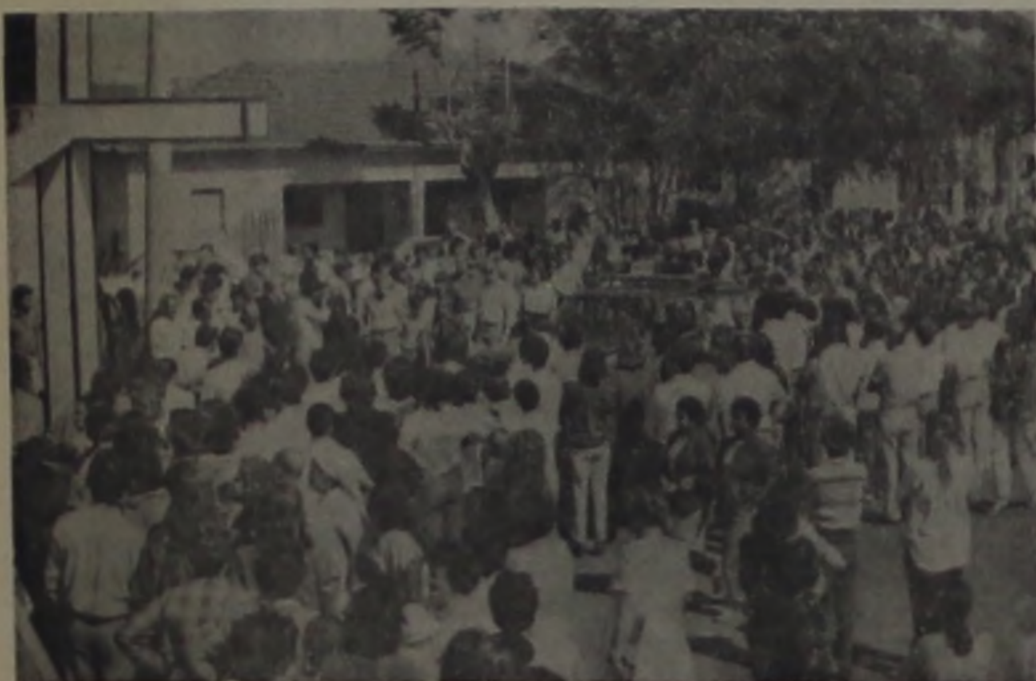
Além do acompanhamento, muita gente já esperava no cemitério