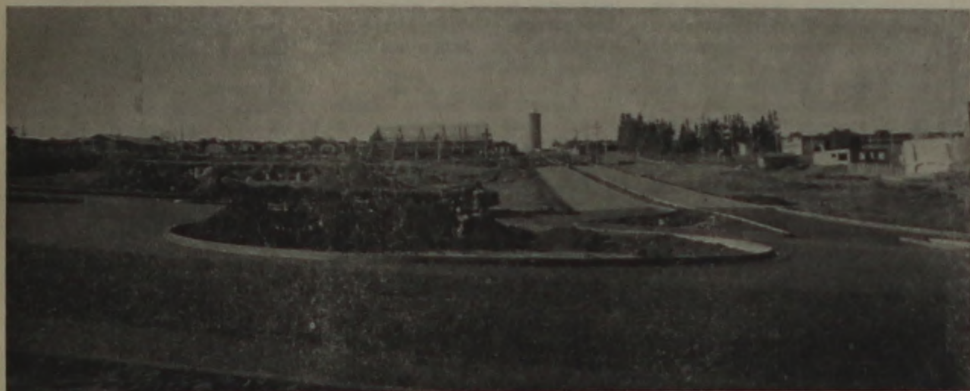
As avenidas Perimetral e Nações Unidas já receberam o asfalto.

Já de posse da lei, ao mesmo tempo em que sua assessoria providencia a elaboração do convênio com a Caixa, o prefeito terminou à equipe técnica e ao setor administrativo que providenciam o primeiro contato com os proprietários, buscando sua aprovação. Como em todo trabalho comunitário, o serviço proposto será executado desde que 80 por cento dos proprietários estejam de acordo.