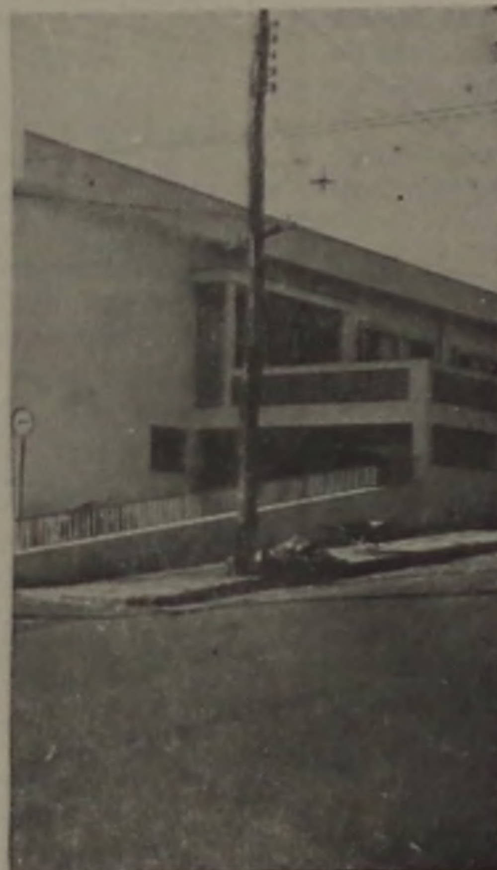
Fachada do Hospital N.S. da Piedade — foto arquivo

Após entendimentos com a direção do Hospital "Nossa Senhora da Piedade", o prefeito Ideval Paccola determinou no início da semana o reajuste da subvenção que o Município concede àquela entidade para a manutenção do serviço de pronto socorro. A verba, que era de Cz$ 18 mil para pagamento dos médicos plan-