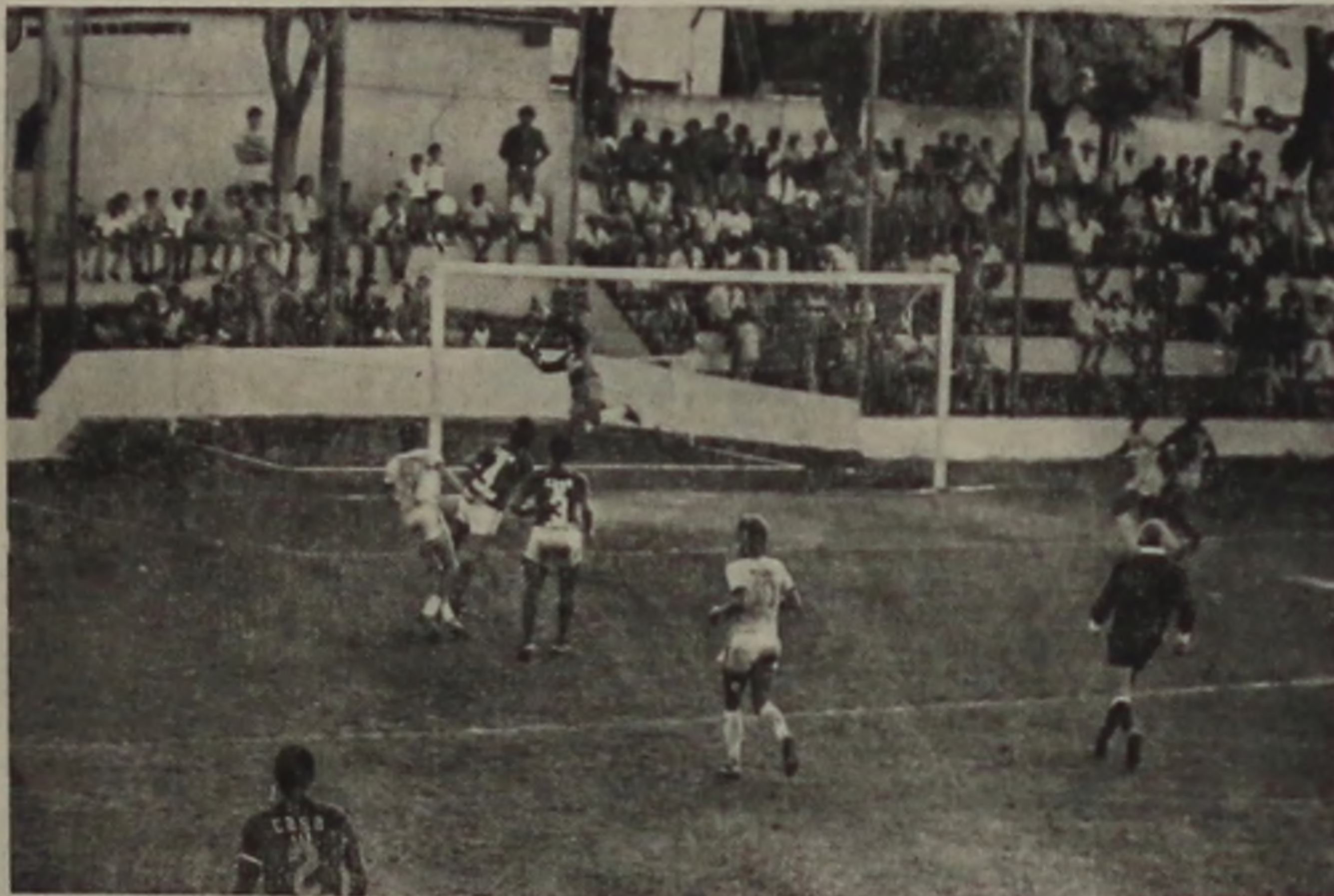
O "Bregão" é o próprio de maior valor entre os negociáveis