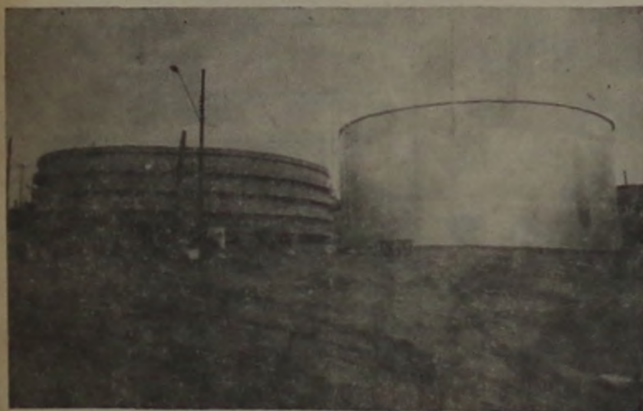
Ao lado deste reservatório será o poço profundo.

Terá início na próxima segunda-feira o trabalho de perfuração do poço profundo que deverá garantir o perfeito abastecimento de água potável para a cidade nos próximos anos. No valor de Cz$ 4,3 milhões o empreendimento é possível graças a um convênio entre a Prefeitura e o Departamento de Água e Energia Elétrica do Estado. Como é sabido, a estação de tratamento do SAAE está funcionando com sua capacidade total, e o desenvolvimento urbano exige novas fontes de abastecimento.