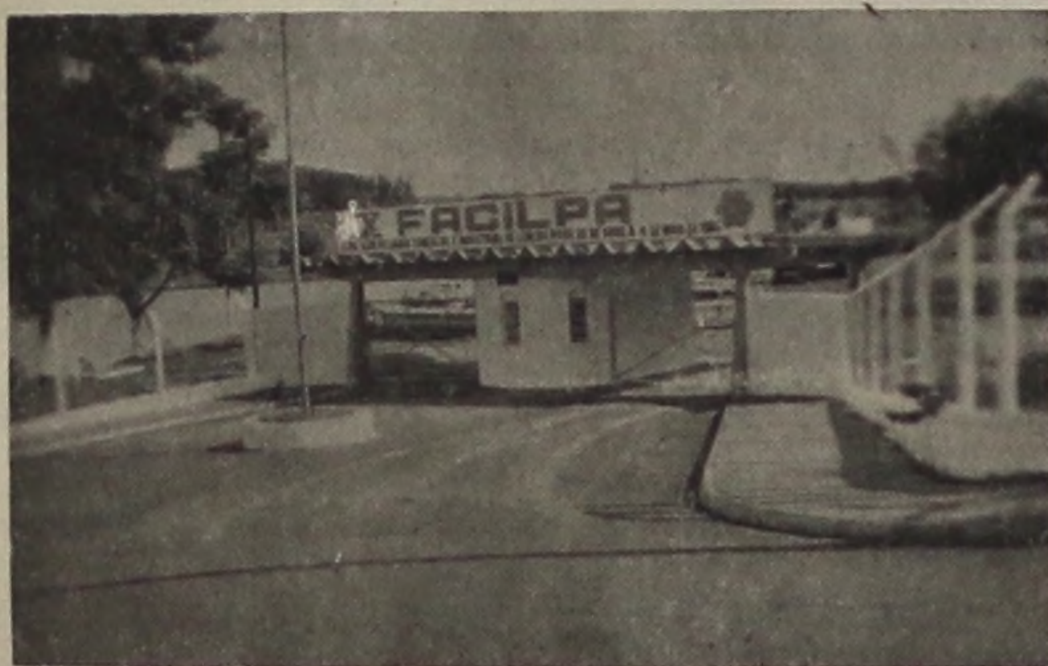
A mostra de gado leiteiro abrigada pelo parque da Prata já é considerada a segunda do Estado e a primeira do sudoeste paulista.