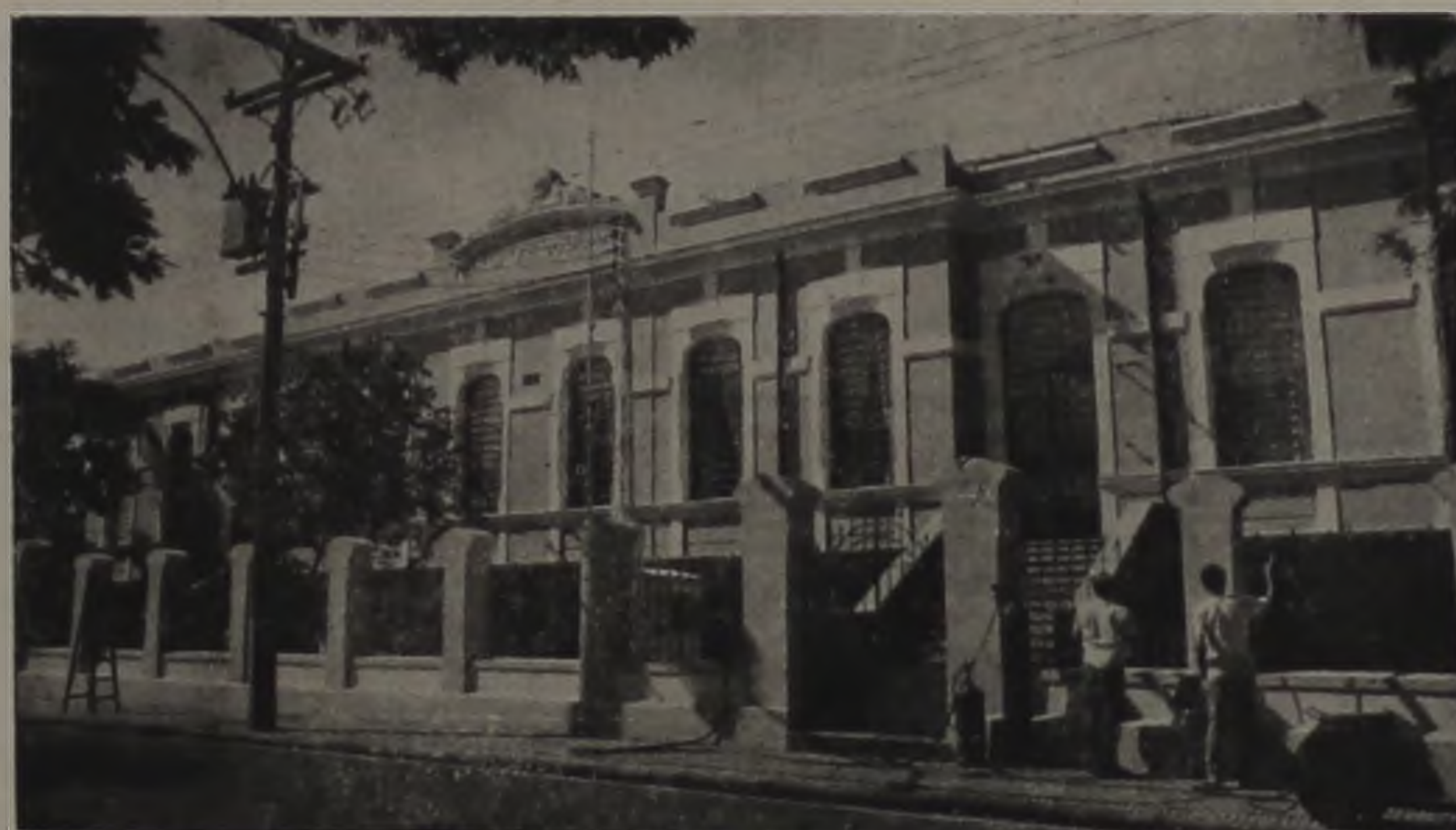
MUITAS SALAS ESTÃO OCIOSAS EM NOSSAS ESCOLAS...