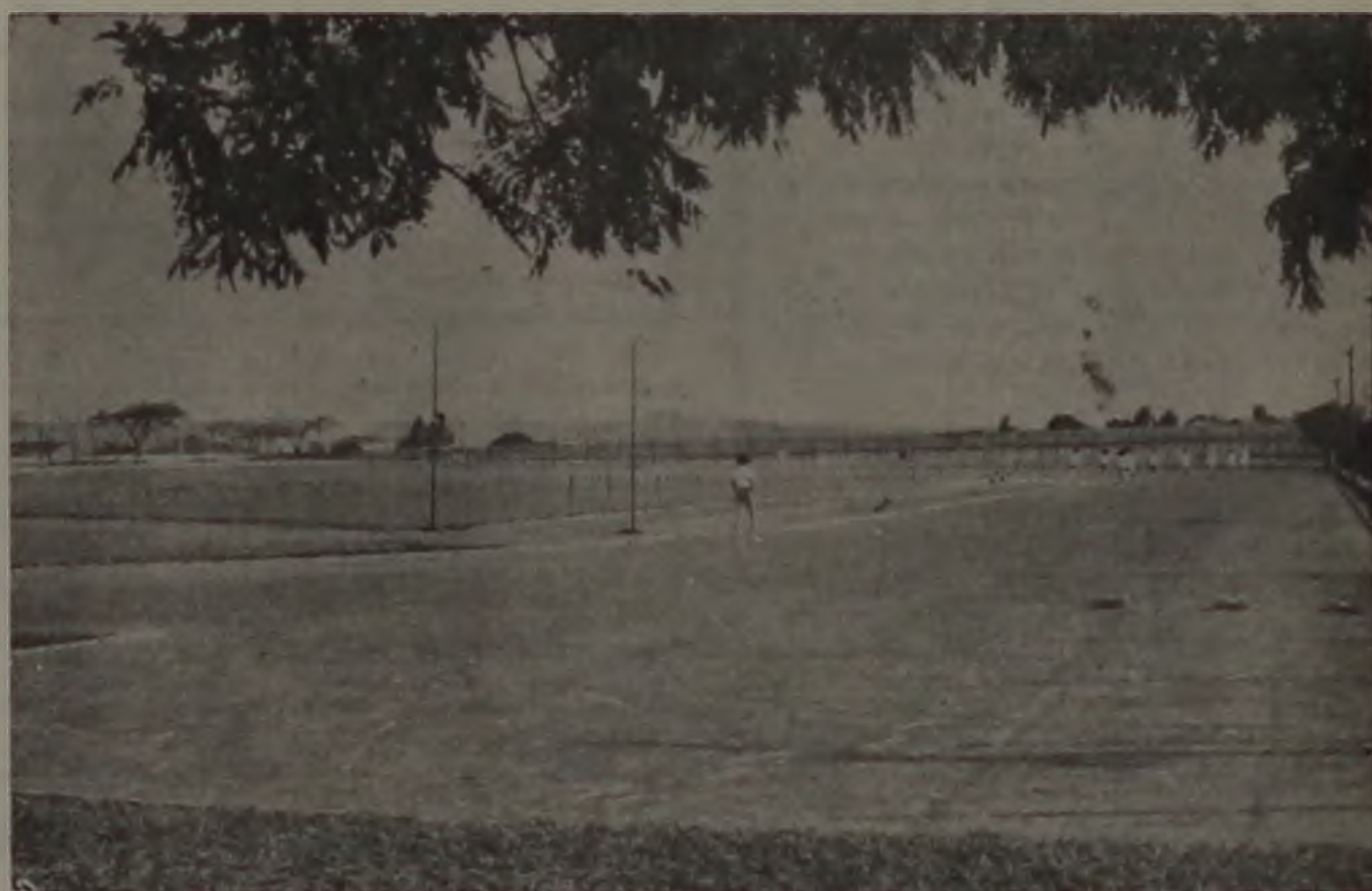
AS PROVAS DE ATLETISMO SERÃO HOJE NA PISTA DO "TONICÃO"

Teve início na noite de ontem, com cerimônia de abertura realizada no estádio "Archangelo Brega", a 1.ª Olimpíada Duçula-Barra Grande, reunindo centenas de atletas das duas Usinas, cujas equipes se defrontarão em mais de 20 modalidades, em competições diárias, até o dia 19.