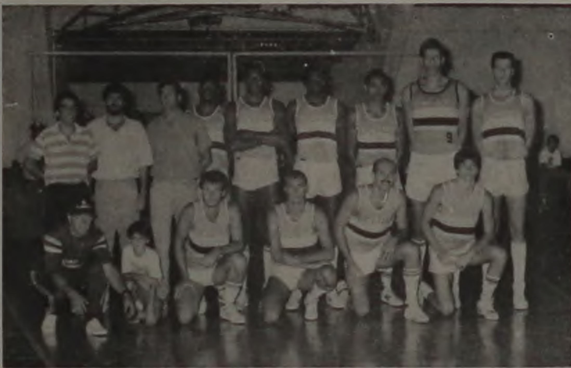
A maioria dos jogadores que atuaram no ano passado permanece no elenco.