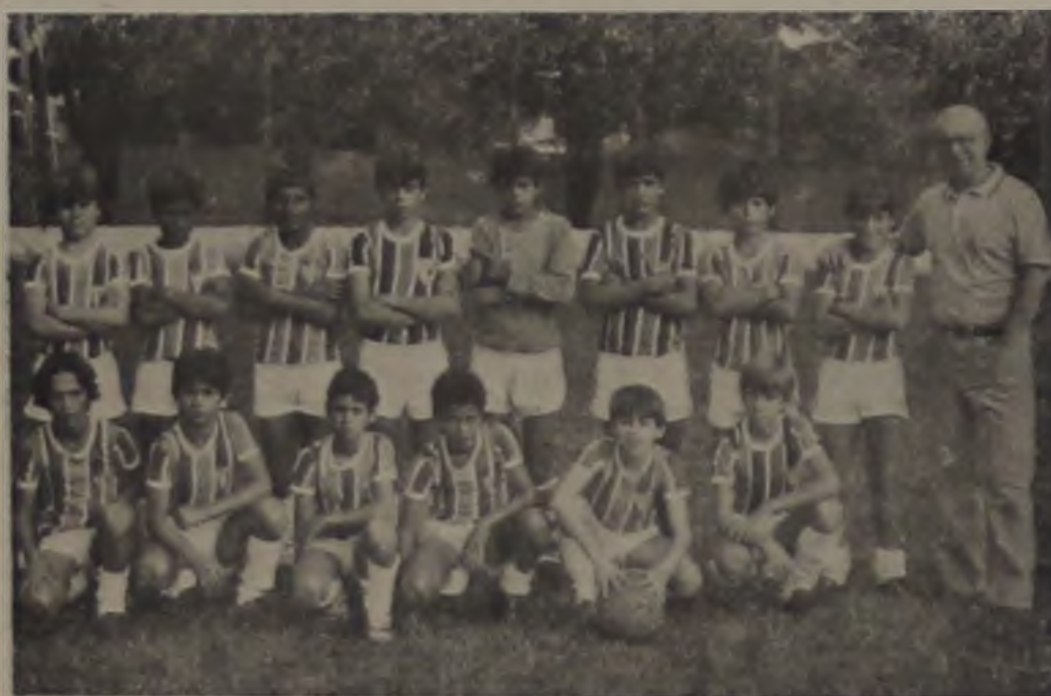
PADRE JOAO E UMA DAS FORMAÇÕES RECENTES DO CALZINHO

Uma missa festiva, hoje, às 21 horas na Igreja N.S. da Piedade, abrirá as festividades de comemoração dos 20 anos de existência da equipe dente de leite do C.A. Lençoense (Calzinho). No programa esportivo, estão previstos jogos entre ex-jogadores de 1977 contra a Associação Vozes, de São