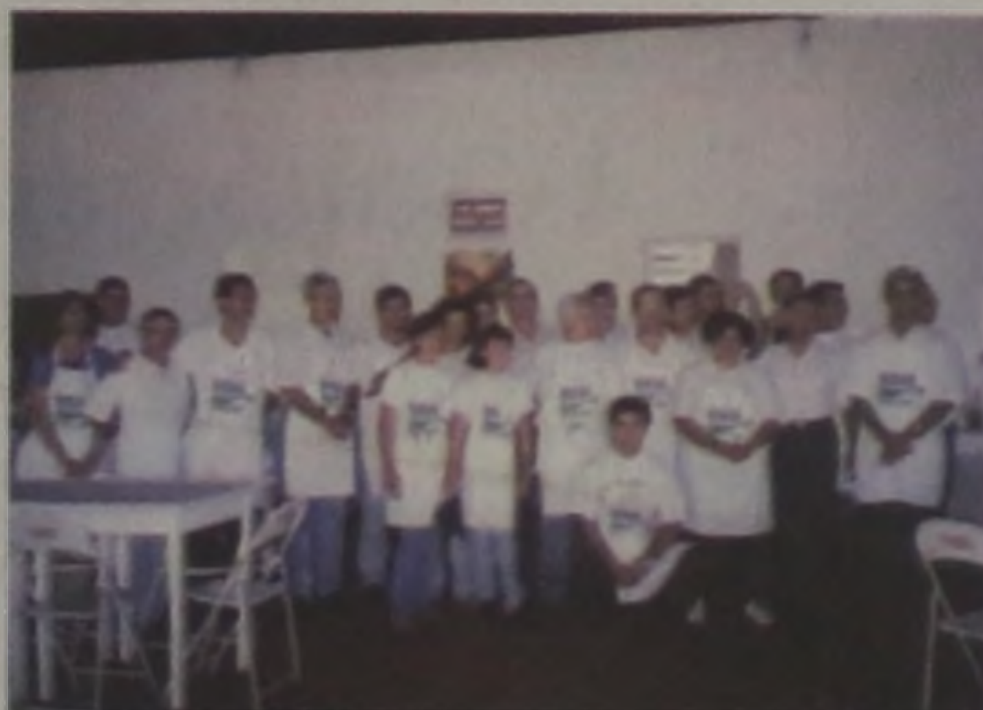
almoço beneficente que foi realizado no domingo, 20, no Corvo Branco. Leia matéria na página 7.

Através de parcerias, eventos e promoções junto à comunidade, uma equipe de aproximadamente 50 pessoas integram o Instituto Espírita de Educação e Cidadania em nossa cidade. Com o projeto da criação de uma escola onde além de fazer acompanhamento escolar, estarão oferecendo cursos profissionalizantes, apoio às famílias e apoio na área de saúde. Os integrantes desta entidade, deram a largada inicial através de um