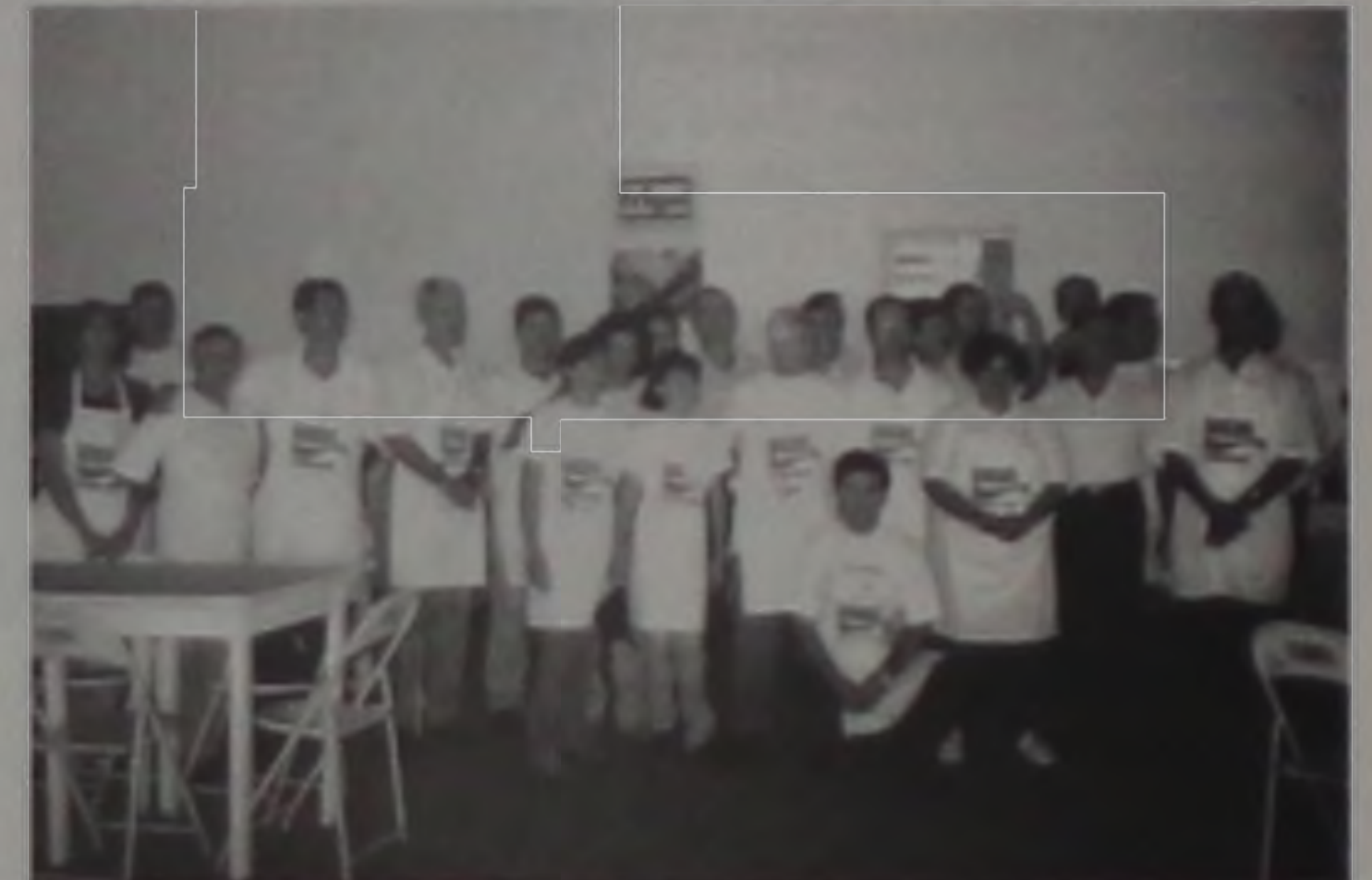
Equipe de voluntários durante almoço beneficente