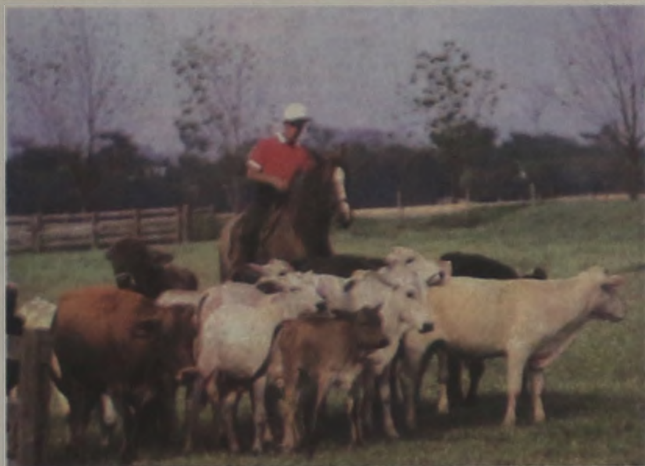
Total erradicação da febre aftosa, meta de todos os produtores

Os bovinos até um ano que foram vacinados em dezembro obtiveram uma resposta imune que se elevará bastante após a aplicação do reforço, portanto aqueles que não receberam a vacina em fevereiro ficarão bem menos protegidos da doença que poderá voltar e causar uma verdadeira tragédia na pecuária de todo o