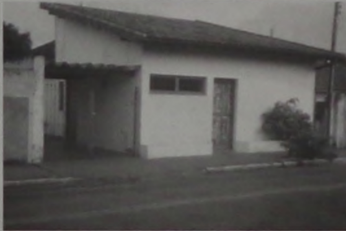
Atual sede do IEEC

Para um melhor desenvolvimento de suas atividades, o IEEC necessita de um prédio novo e de amplo espaço físico. O projeto da escola prevê a construção de um prédio de aproximadamente 50 mil metros quadrados, onde terá a sede e desenvolverá todas as atividades previstas. Ainda não há nada de concreto quanto a área, Conti explica que tudo existe no papel e está em estudo, aguardando definição de parcerias. Neste espaço deverá conter enfermaria, consultório médico e dentário, entre outros benefícios.