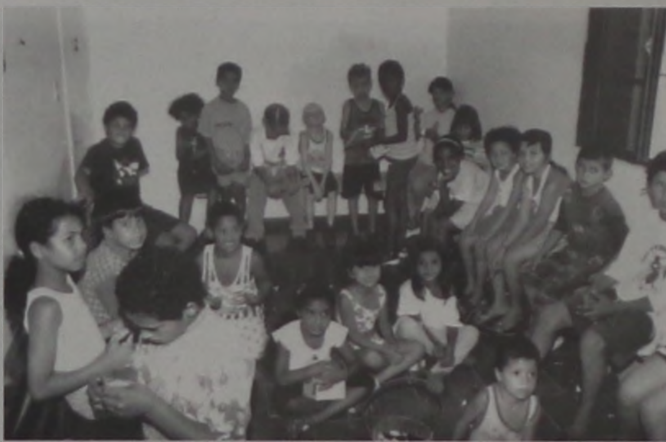
Crianças em atividades no Instituto Espírita de Educação e Cidadania