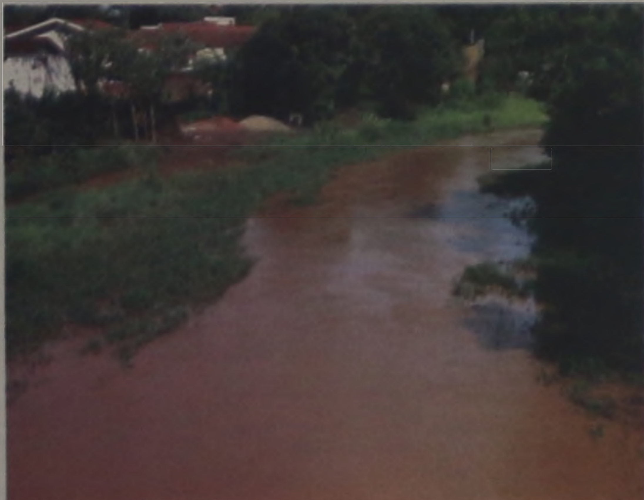
Estão previstos 12 km de coletores-troncos e quase 8 km de emissários

A cidade de Jaú, conta hoje com 100% de cobertura de redes de esgoto, cujos dejetos são lançados nos córregos Pires e da Figueira, e em seguida no rio Jaú, sem qualquer tratamen-