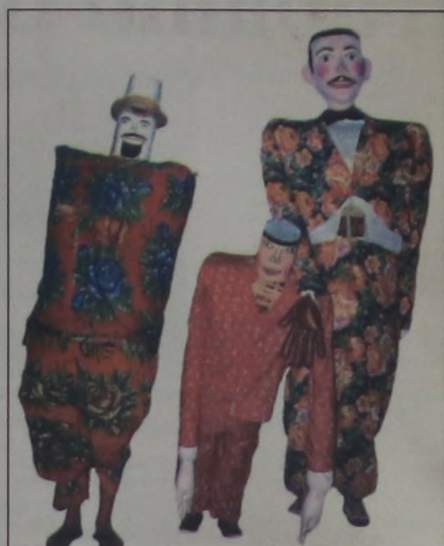
Manifestação da cultura popular brasileira

Outra boa saída, é participar do Rebanhão, atividade desenvolvida pelo movimento católico da cidade, e será realizado na APAE.