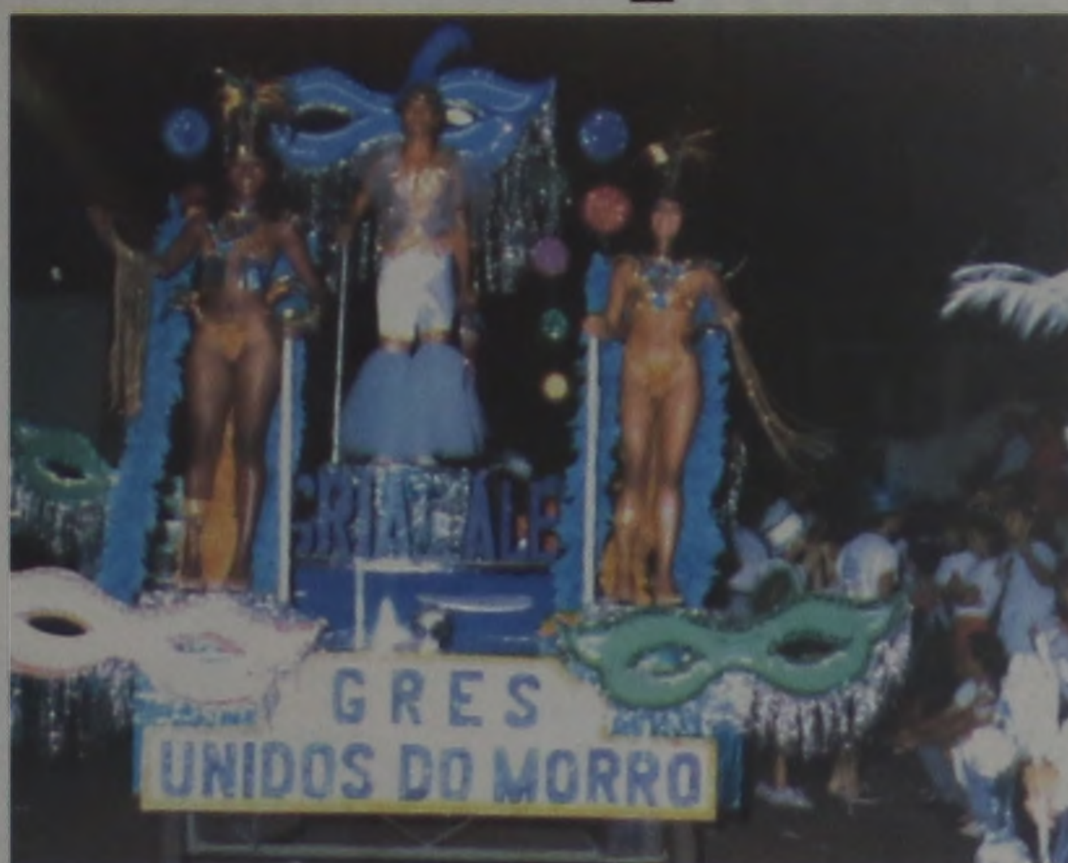
Unidos do Morro tetracampeã do carnaval de Lençóis em 1989

No Brasil, o Carnaval deriva das misturas africanas, indígenas e européias. Em cada região tem suas características próprias. Enquanto os cariocas desfiliam fantasias sumárias em carros alegóricos, na cidade de Lençóis Paulista a Comissão Municipal de Festas da Prefeitura definiu a programação para mais este Carnaval Familiar. O evento está programado para o período de 3 a 7 de março, com a realização de 5 noites e 2 matinês. Os bailes acontecerão na rua Dr. Antonio Tedesco, no trecho compreendido entre a Avenida Bra-