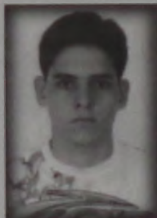
Hoje, 28, é a passagem de seu aniversário, mais um ano de vida. Eu não poderia deixar de enviar os parabéns a você e te dizer mais uma vez que te amo muito. Eu.