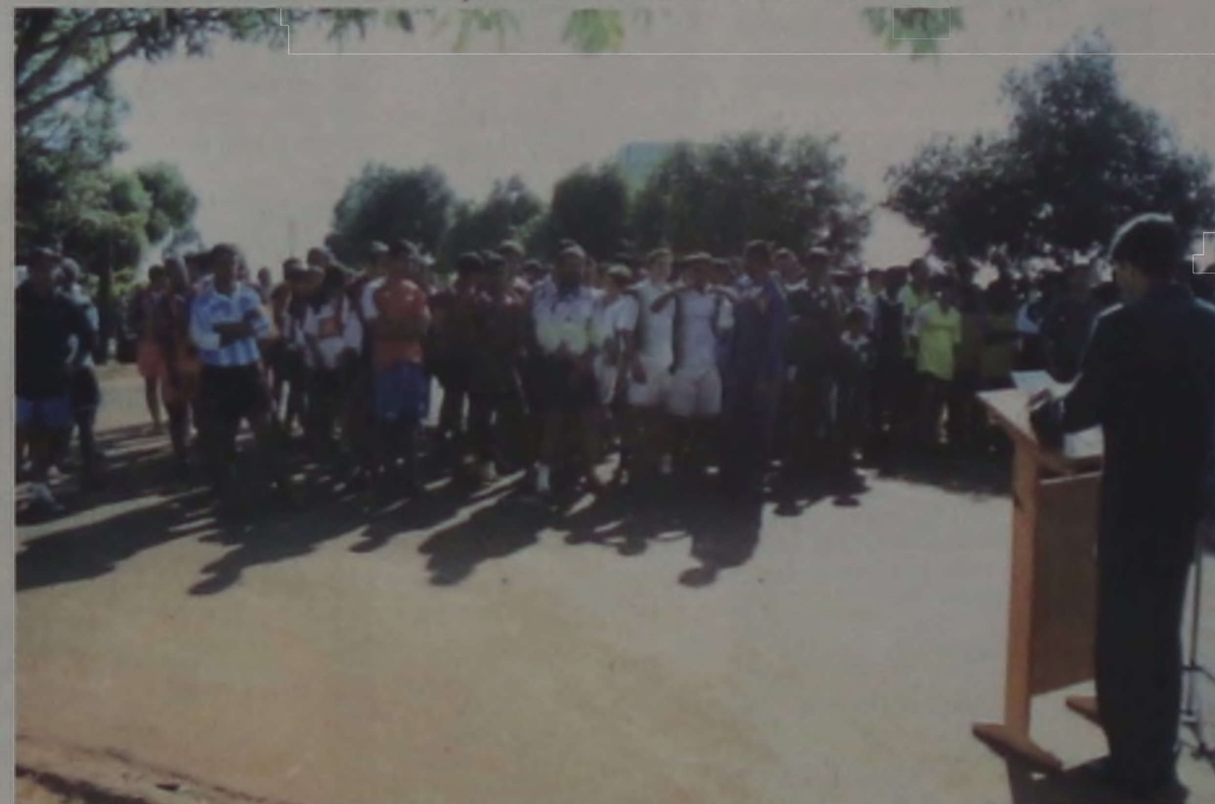
Athletas participantes acompanhando a execução do Hino Nacional Brasileiro

Teve início na manhã de domingo, 27 no campo de futebol de areia do bairro de domingo, 27 no campo