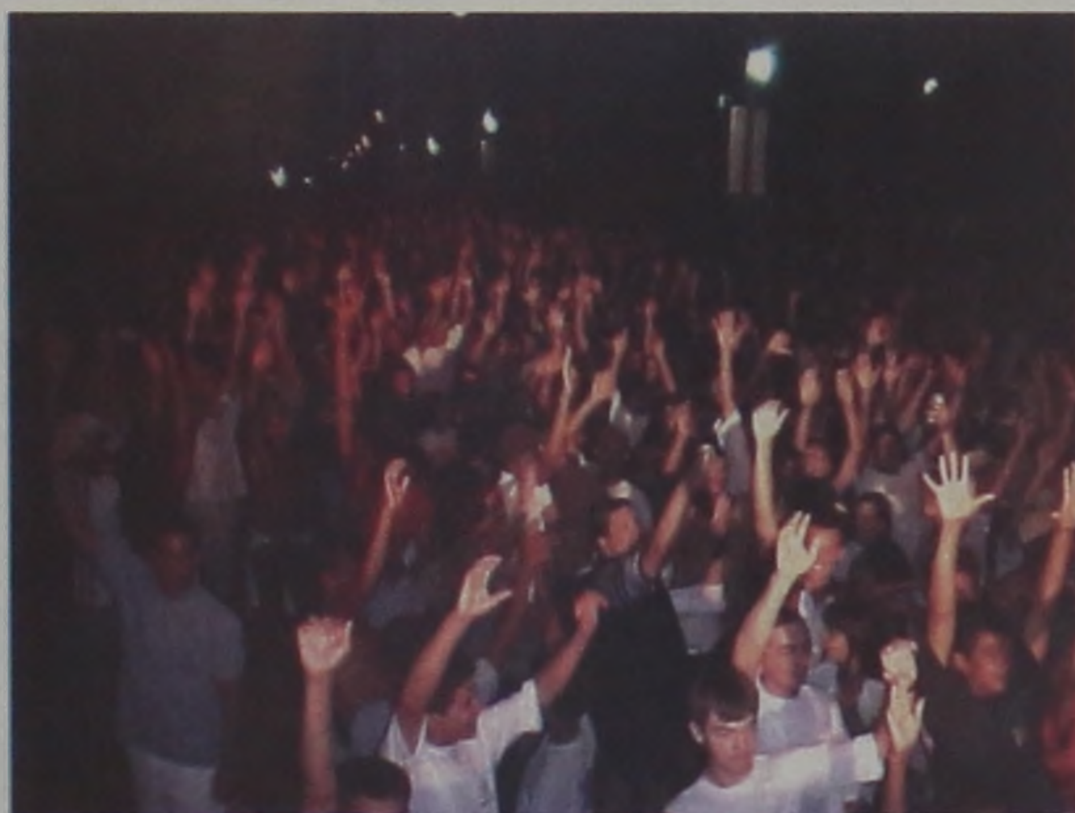
Grande público prestigiando o Carnaval durante as noites de folia

Durante a realização dos bailes e matinês, foram