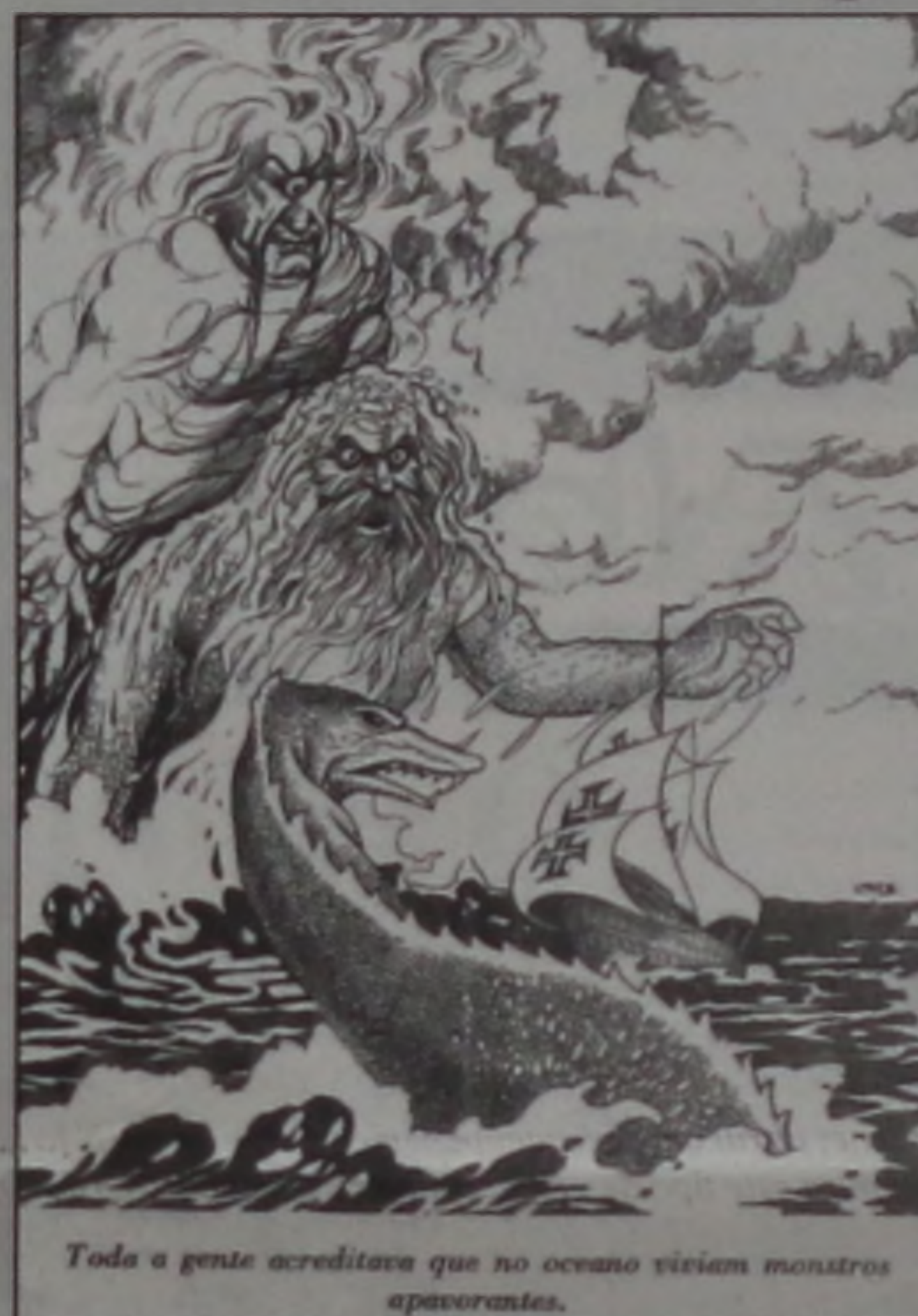
Toda a gente acreditava que no oceano viviam monstros apavorantes.

Depois de ter em mãos a navegação à vela con-