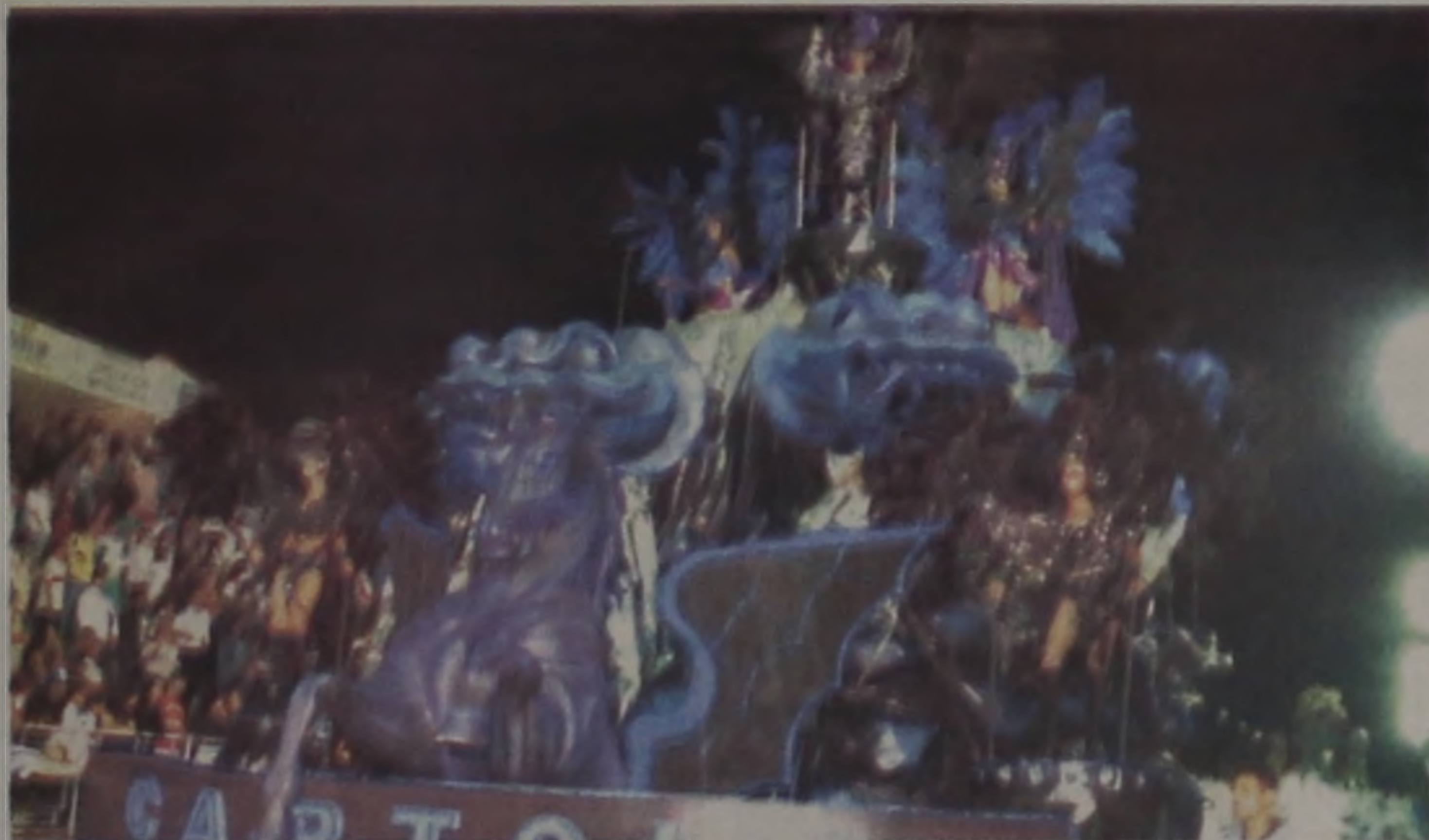
Cartola que venceu com nota máxima em todos os quesitos

Na contagem final, a Cartola somou 180 pontos, seguida pela Coroa com 169