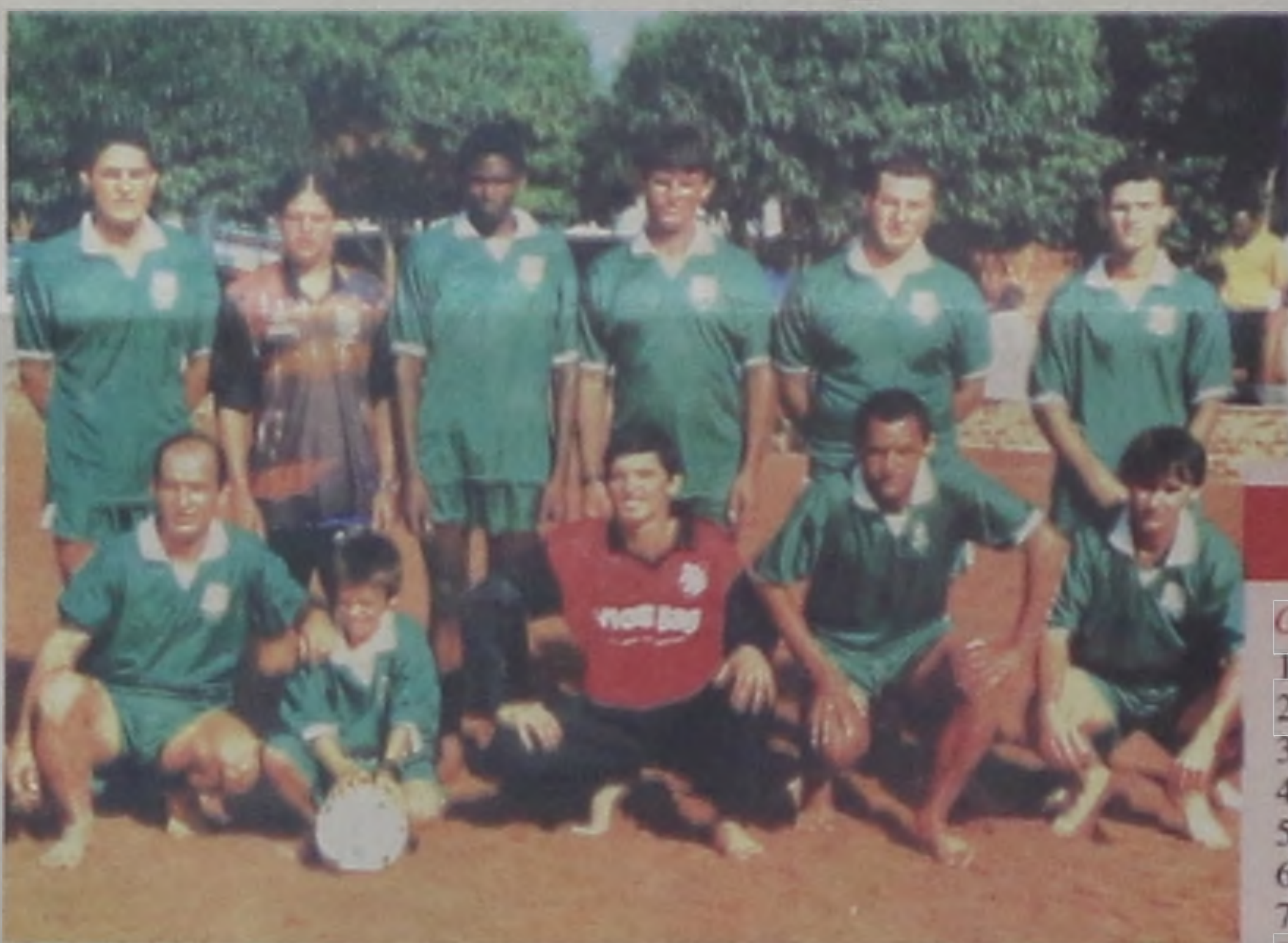
Na foto, jogadores da equipe de Macatuba