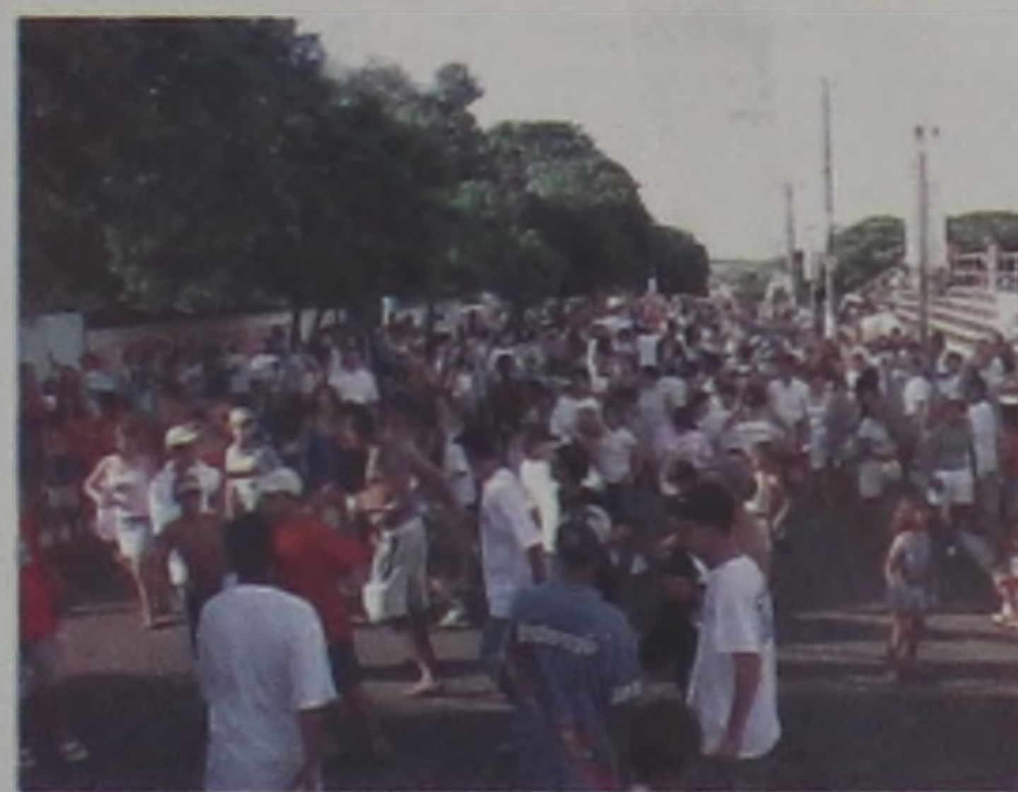
As matinês reuniu pessoas das mais variadas idades

feitos cerca de 120 atendimentos pelo plantão 192 (ambulância), no período compreendido entre as