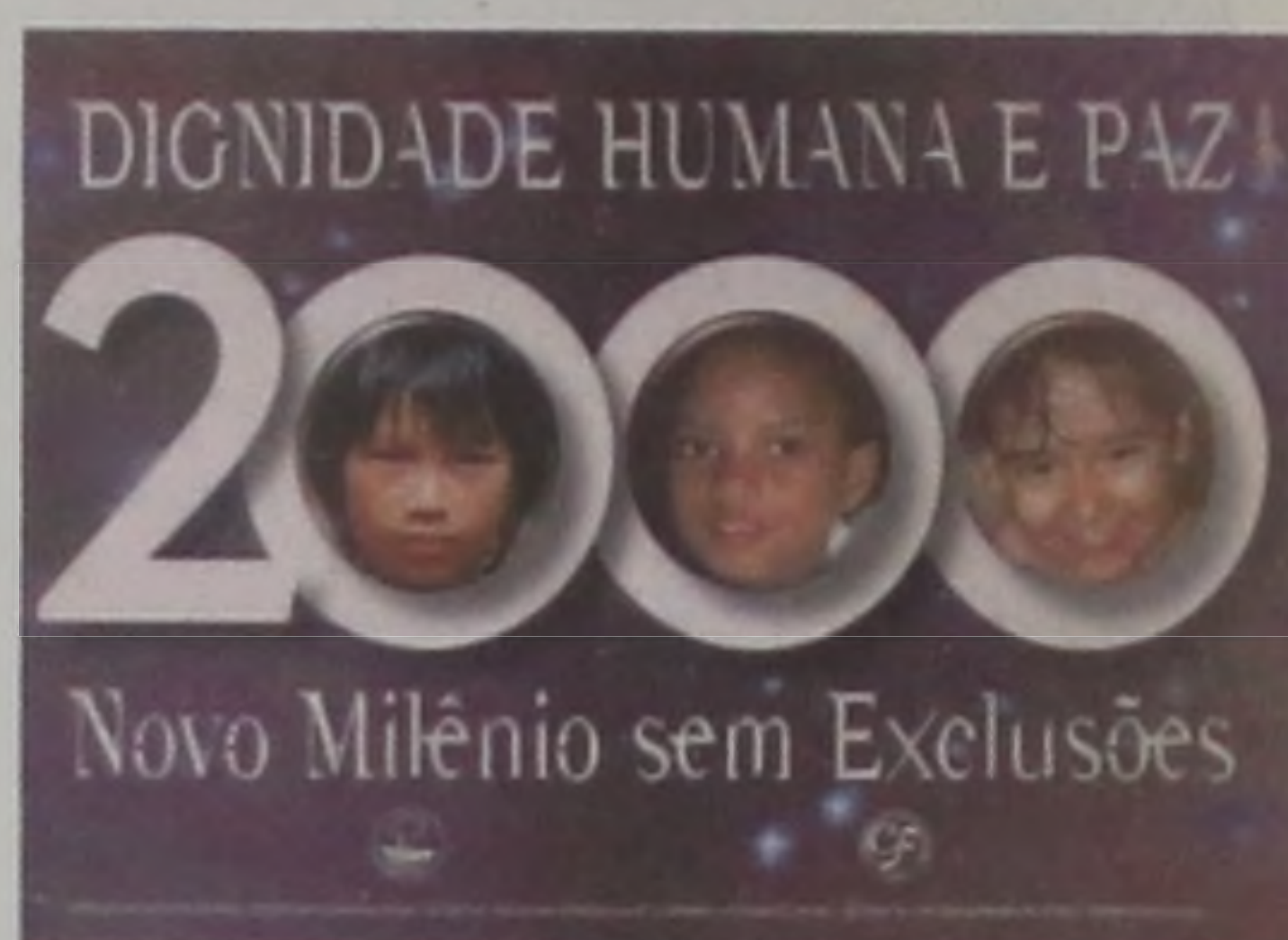
O cartaz da CF

Segundo Padre Carlos, algumas pesquisas apontam a questão da violência, depois do desemprego, como o maior problema da sociedade atual. "A diminuição da violência não é fruto da repressão e de alianças políticas. No pensamento dos profetas bíblicos, a paz é Dom de Deus e fruto