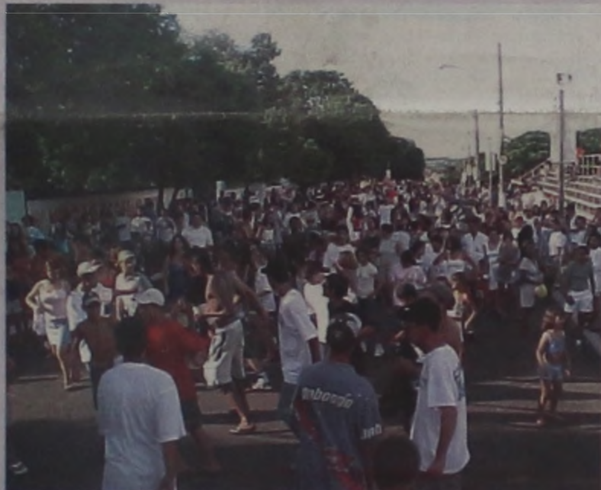
Muita animação marcaram as tardes de Carnaval na rua

Cerca de 10 mil pessoas participaram do Carnaval Família, realizado entre os dias 3 e 7 de março, durante as 5 noites e 2 matinês.