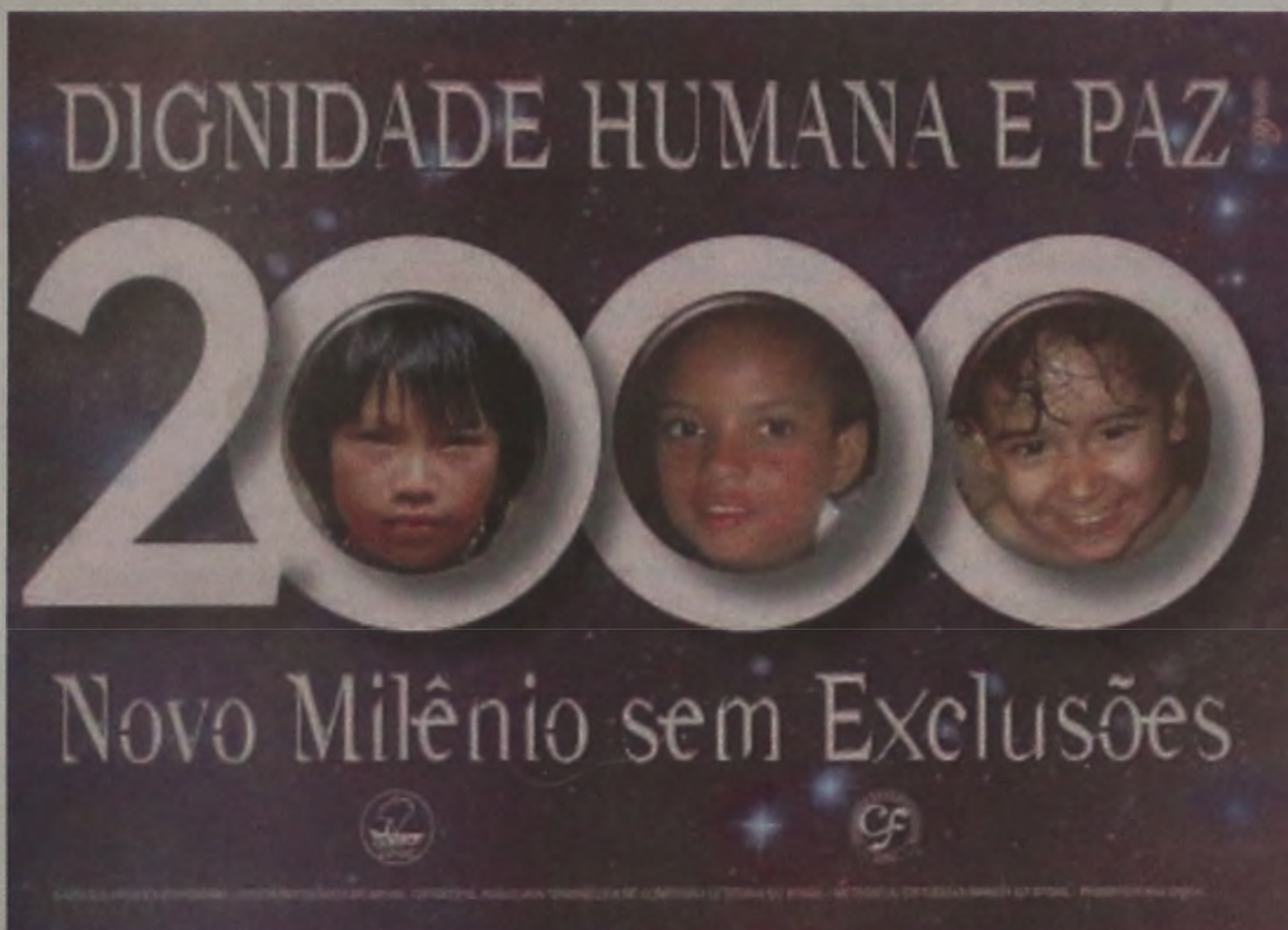
"O Cartaz da Campanha da Fraternidade indica a passagem do milênio, evidenciando o ano 2000 colocado no centro, sobre o fundo azul do universo"

Este foi o quinto título da escola. Em segundo lugar ficou a Coroa Imperial, com 169 pontos. Não haverá rebaixamento das escolas de samba para o próximo ano. Matéria pág. 14