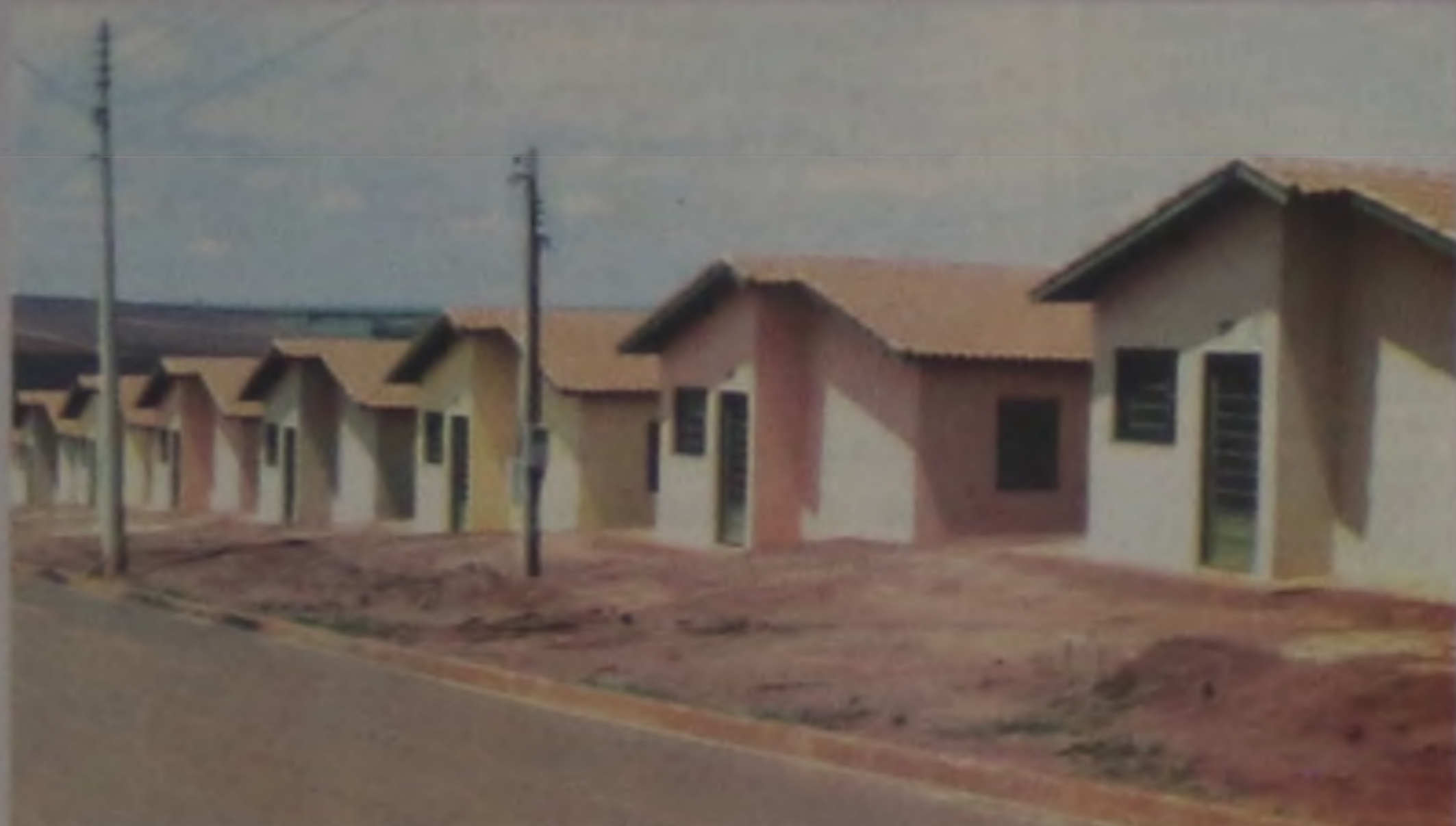
Casas populares construídas pela Construtora Marimbondo