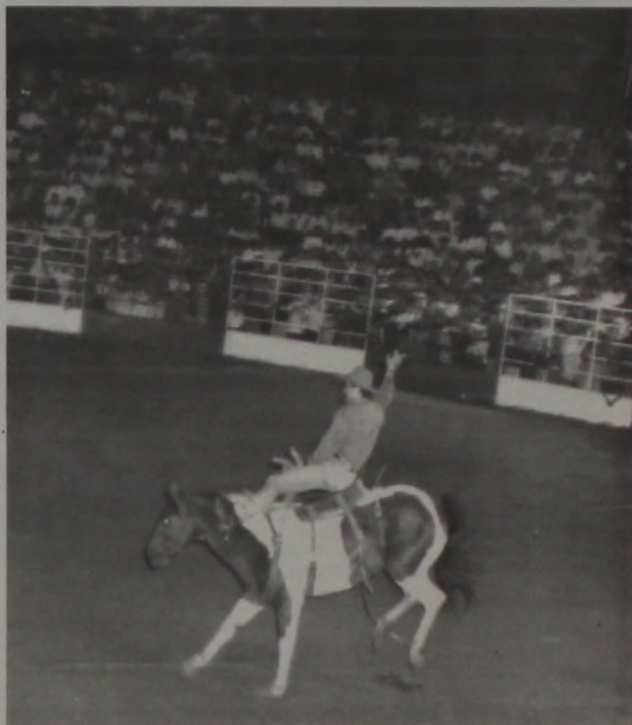
Arrojados e bravos peões estarão presentes na XXIII Facilpa

mos anos da feira, os pecuaristas terão oportunidade de realizar negócios, comprando e vendendo gado nos leilões da Facilpa. Este ano, serão realizados dois leilões, um de gado leiteiro e outro de carneiros, as datas ainda não foram definidas.