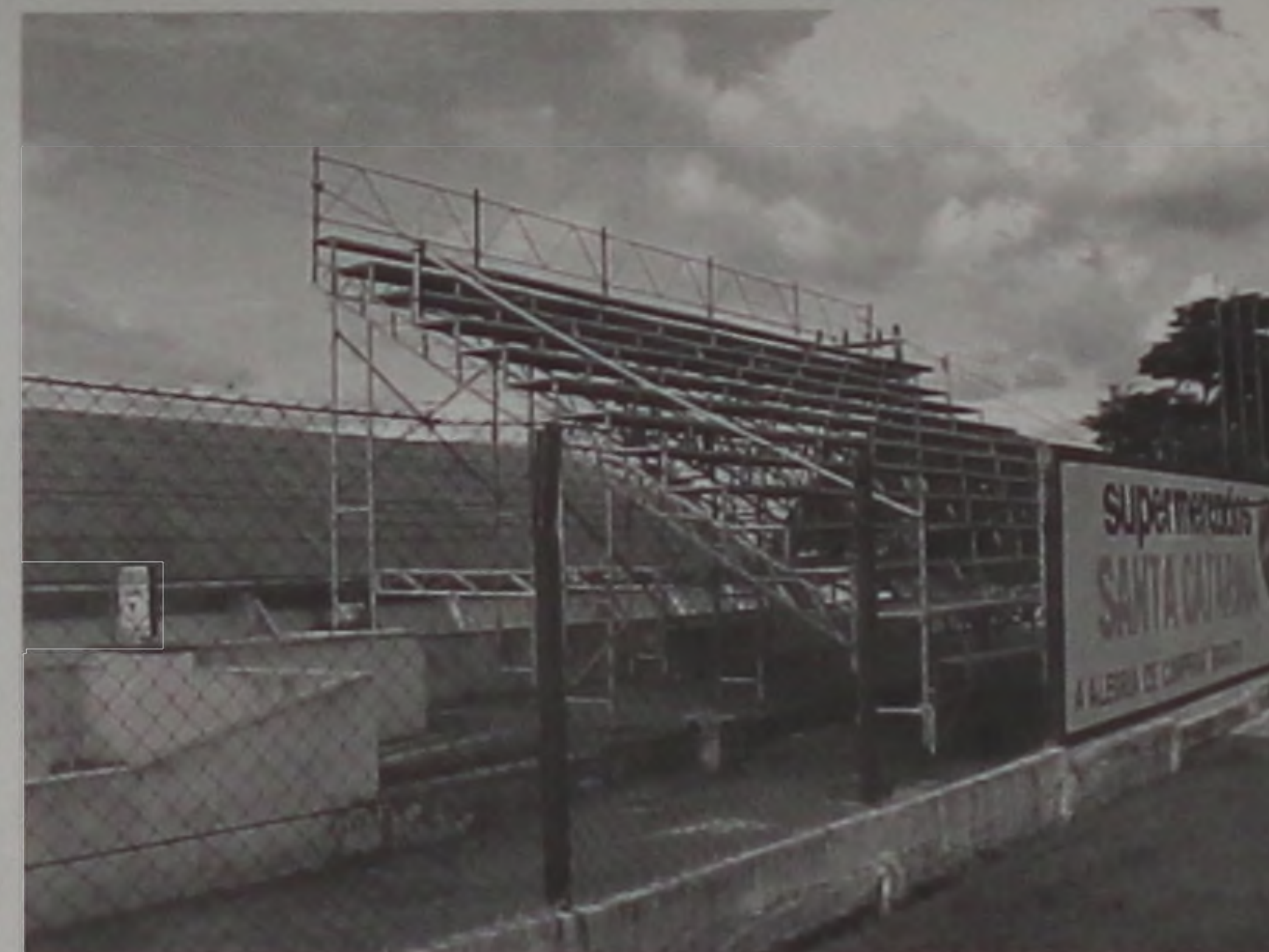
Arquibancadas improvisadas no Bregão