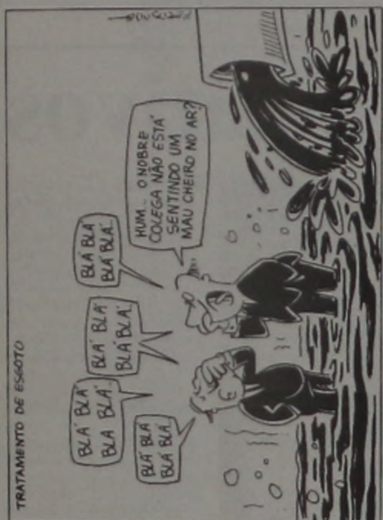
Charge extraída do Jornal da Cidade do dia 23/03, feita pelo chargista Eduardo.