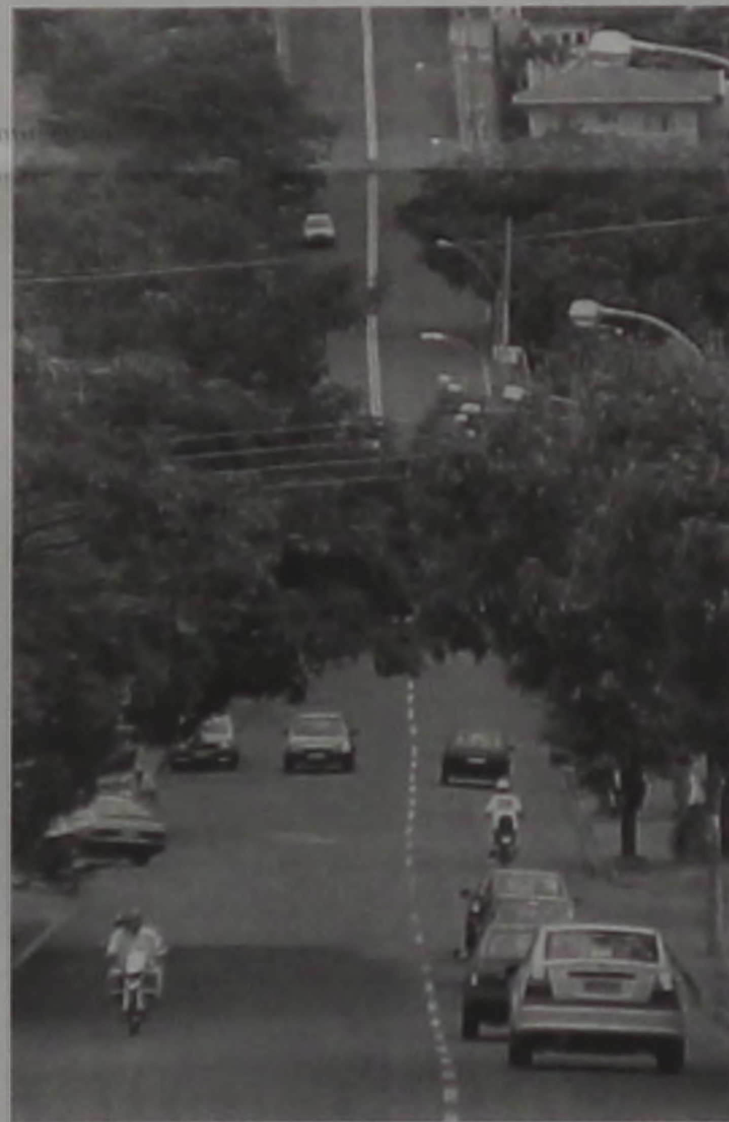
Veículos trafegam na rua 28 de Janeiro

Na avenida 25 de Janeiro, as faixas de pedes-