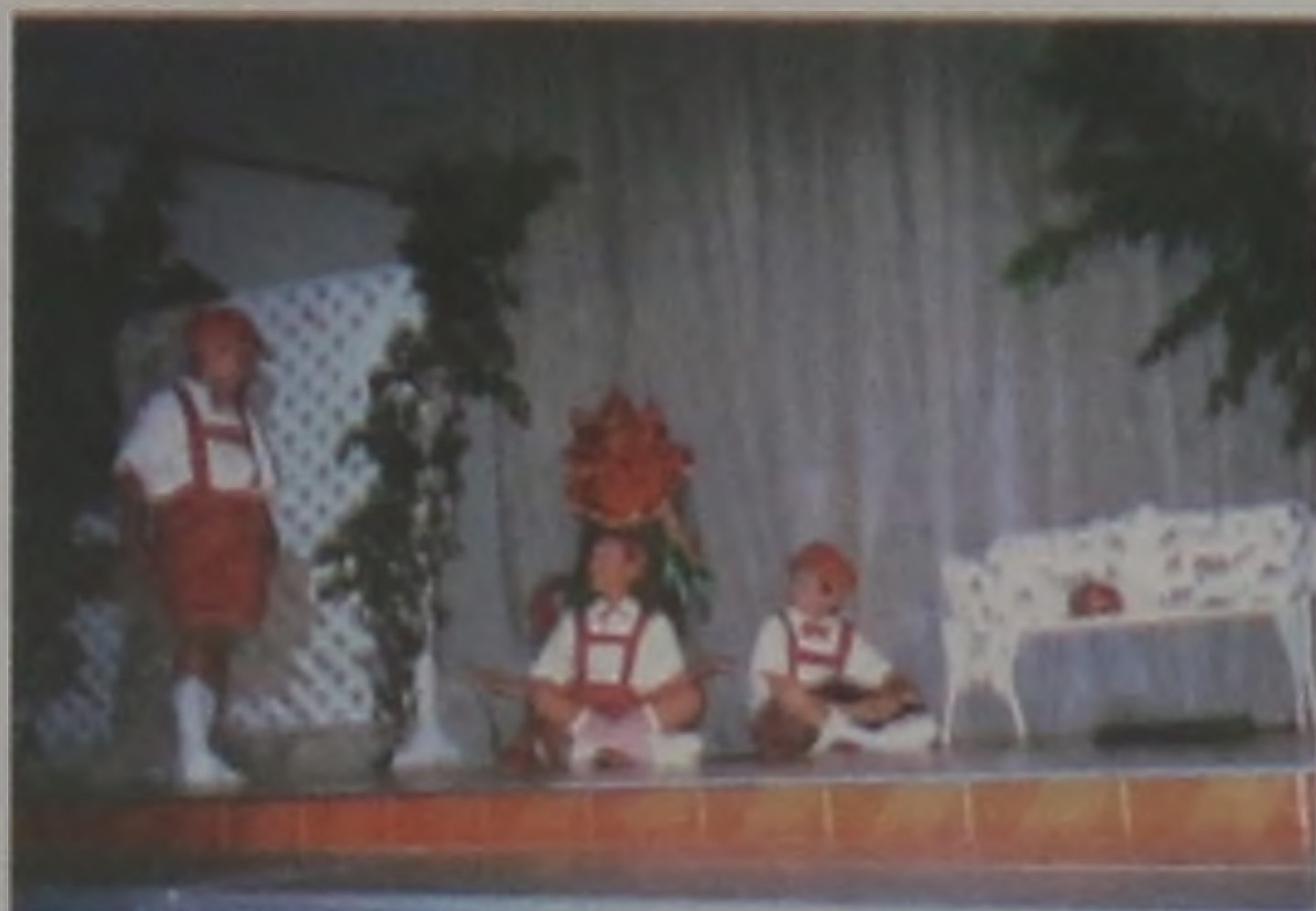
Encenação do "Palhacinho Triste"