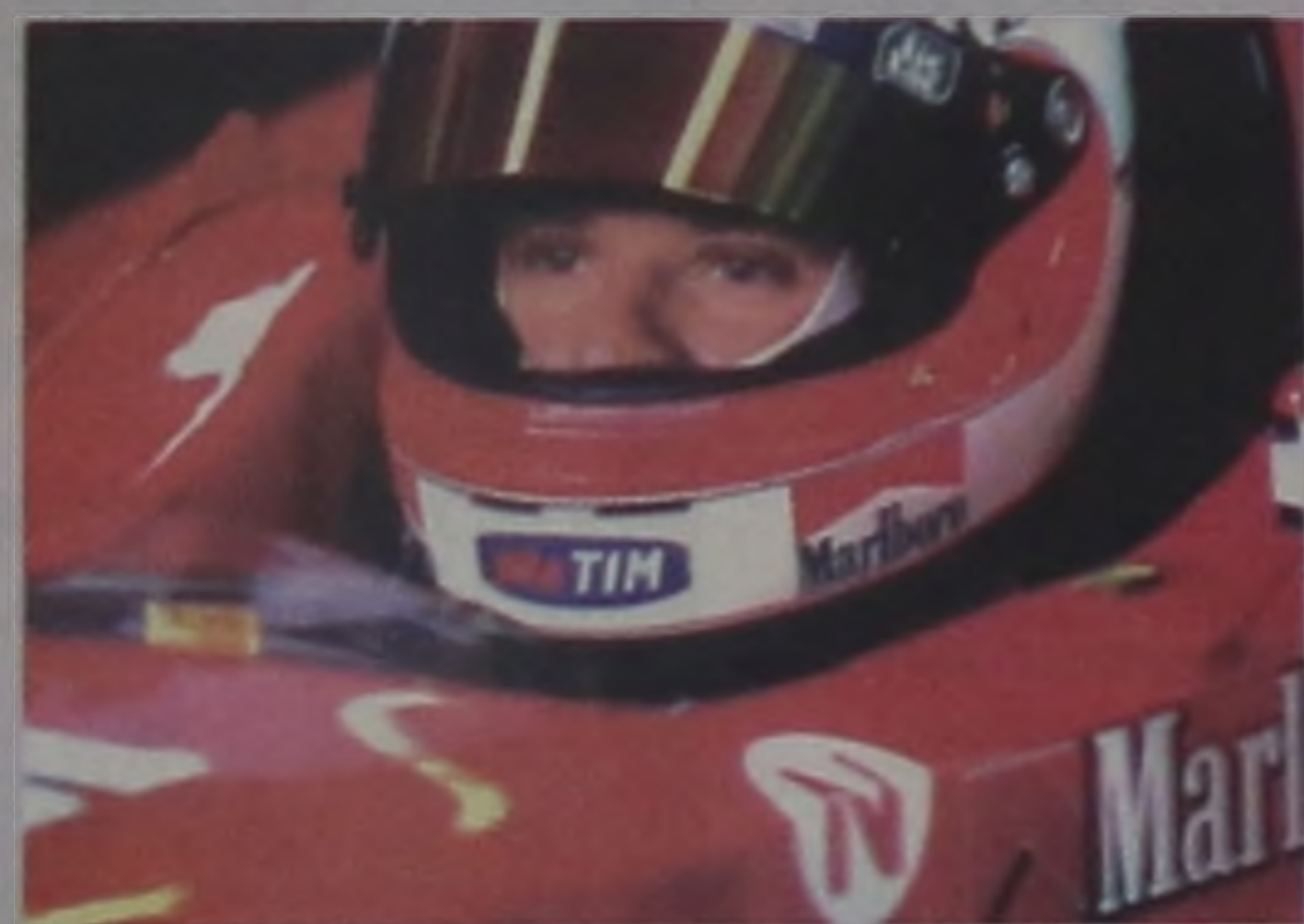
Rubinho Barrichello, esperança brasileira no GP do Brasil