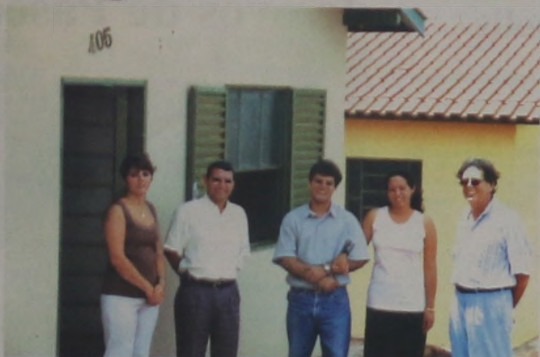
Gerente da Caixa na entrega das casas populares

Outro conjunto está sendo construído pela Cons-