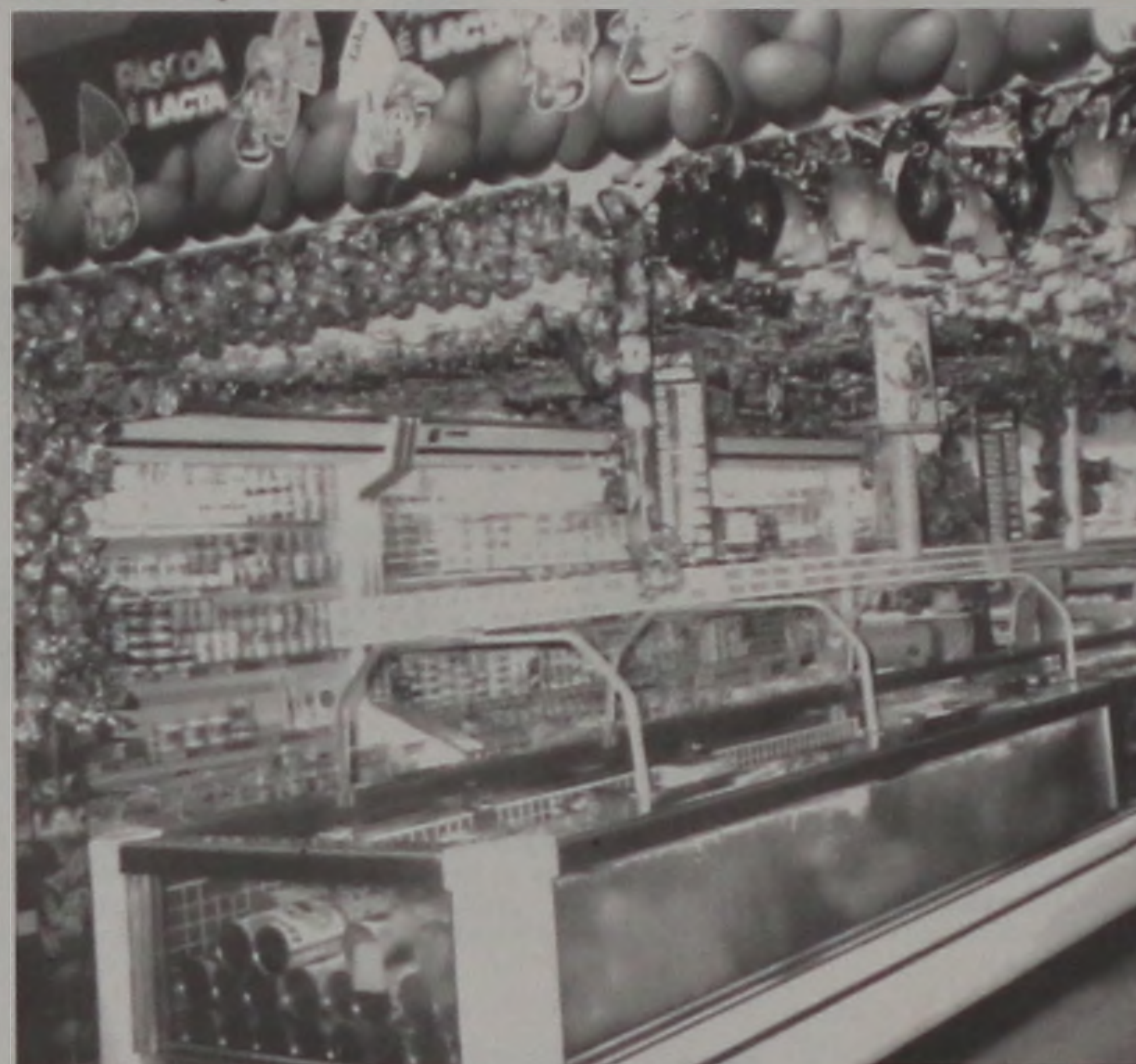
Ovos de Páscoa já se encontram nos supermercados