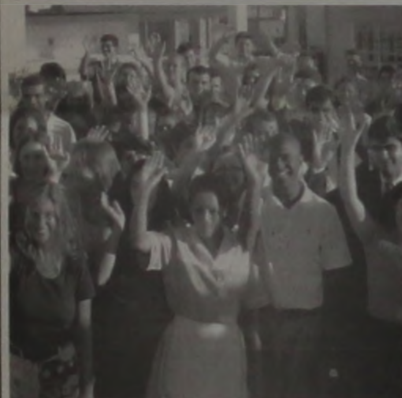
Eles torciam contra a Estação de Tratamento de Esgoto e agora souberam do arquivamento do projeto

Por falar no Roque Júnior, lembrei do prefeito de Pratânia Roque Joner. Tudo lá está uma maravilha e a festa dos 3 anos vale até prá Lençóis. O gaúcho tá fazendo Pratânia "dar no couro" em matéria de progresso e tá "descendo a sola" no desenvolvimento. A Câmara ajuda.