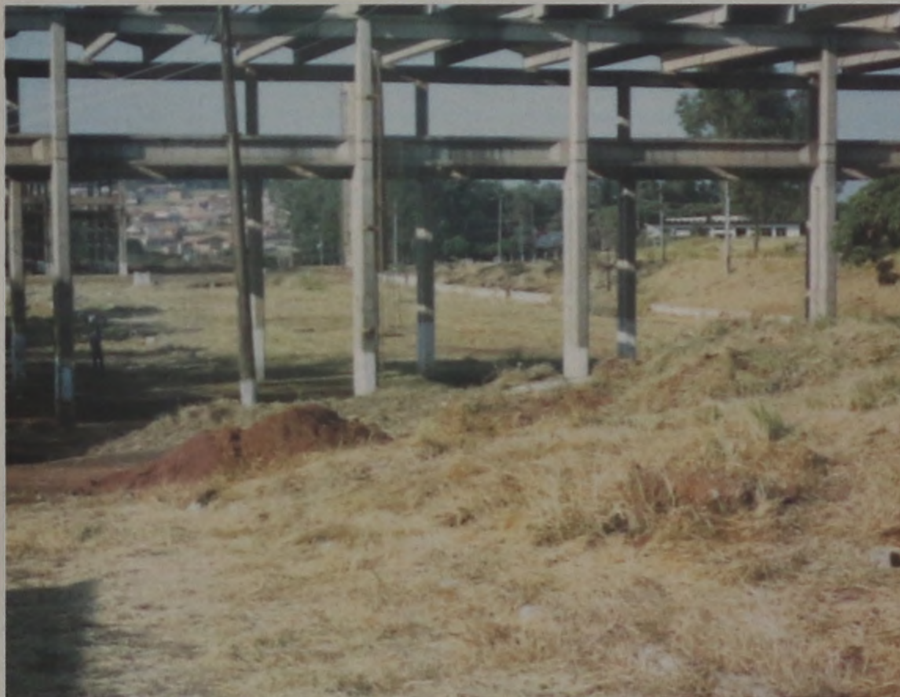
Área da Sidelpa que há mais de 15 anos está desocupada, poderá continuar como está: abandonada

Os vereadores rejeitaram, na última segunda-feira o projeto que destinava parte das instalações da Sidelpa para a Support Informática. A decisão levou a empresa a suspender seu programa de instalação da indústria de montagem de computadores em nossa cidade. Inviabilizado esse empreendimento, resta agora aos senhores vereadores, esclarecer o que pretendem fazer do imóvel da antiga metalúrgica.