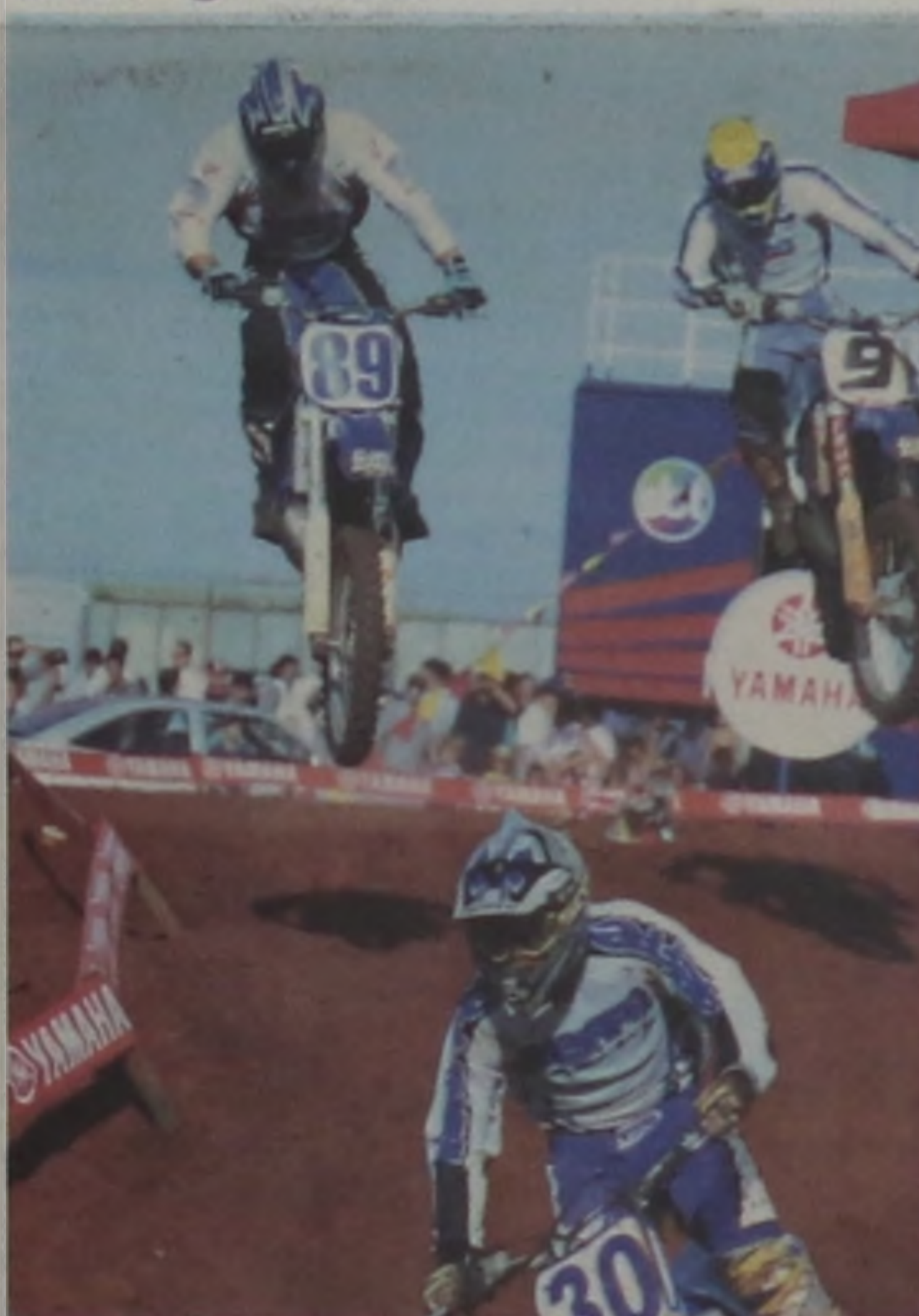
Grandes feras do motociclismo nacional estarão em Lençóis Paulista no próximo dia 18 de junho, onde a cidade sediará a 4ª Etapa da Copa SBT de Arena Cross. Pág. 9