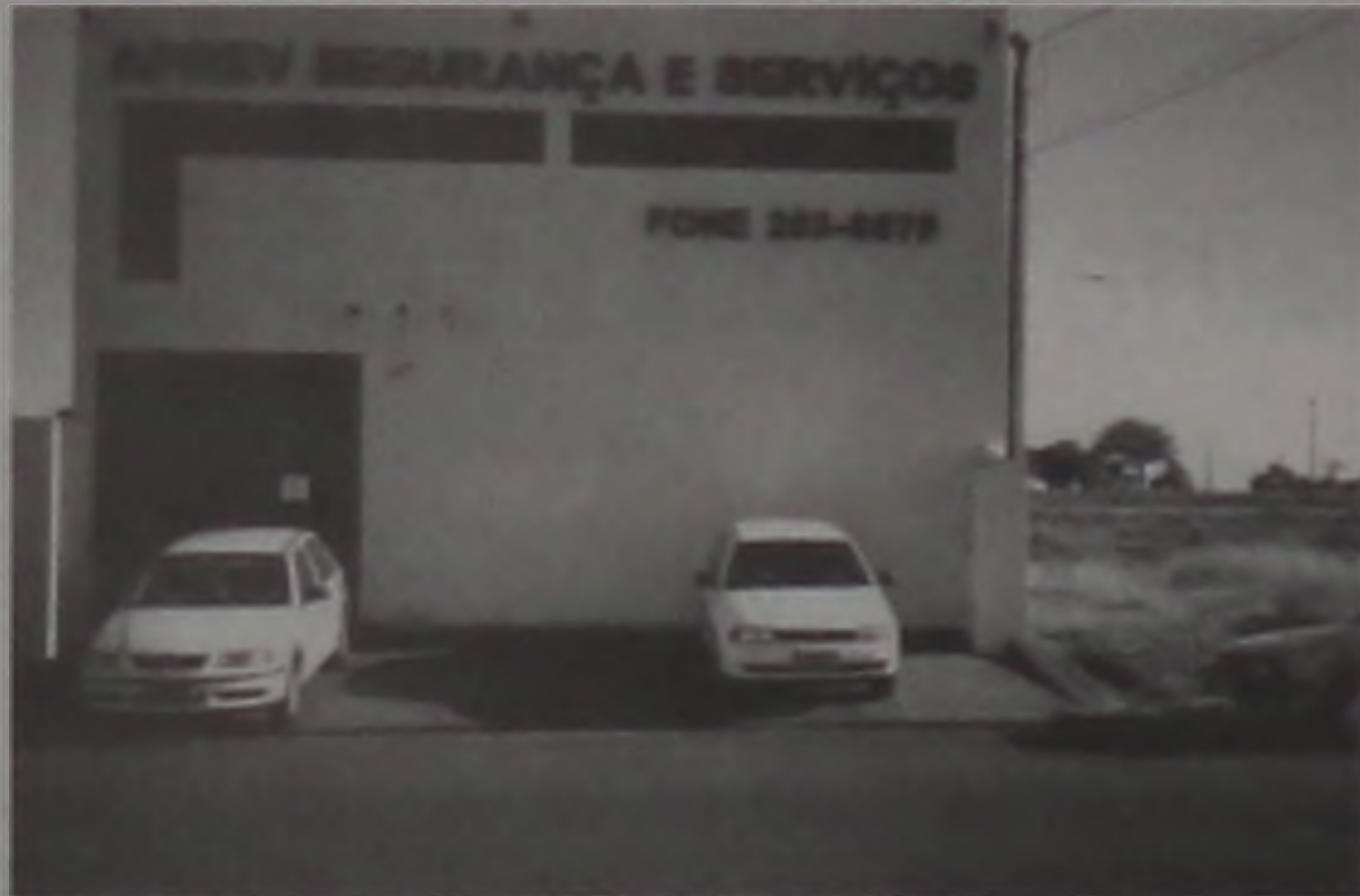
Fachada das novas instalações da Aprev

COMPRANDO NO COMÉRCIO DE LENÇÓIS PAULISTA VOGÊ CONTRIBUI PARA O DESENVOLVIMENTO DE NOSSA CIDADE