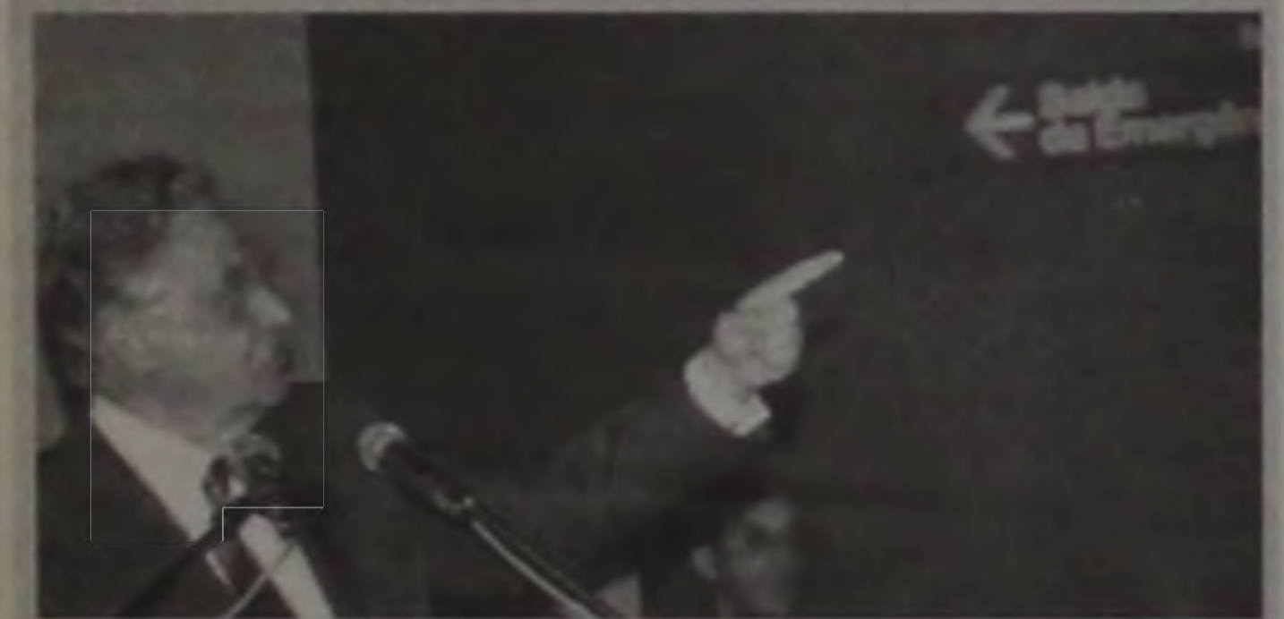
Se a coisa apertar, eu saio por lá?

E adorei aquela enquete política na TV: "Quem é a pessoa capacitada para a Prefeitura de São Paulo?". Aí aparece uma baiana e diz: "LUIZA ERUNDINA. Foi ela que construiu nossa casa!". E outra: "LUIZA ERUNDINA, ela que ajudou nas obras onde a gente mora!". Ué... então além de prefeita aquela vez, ainda Erundina foi também servente de pedreiro?!