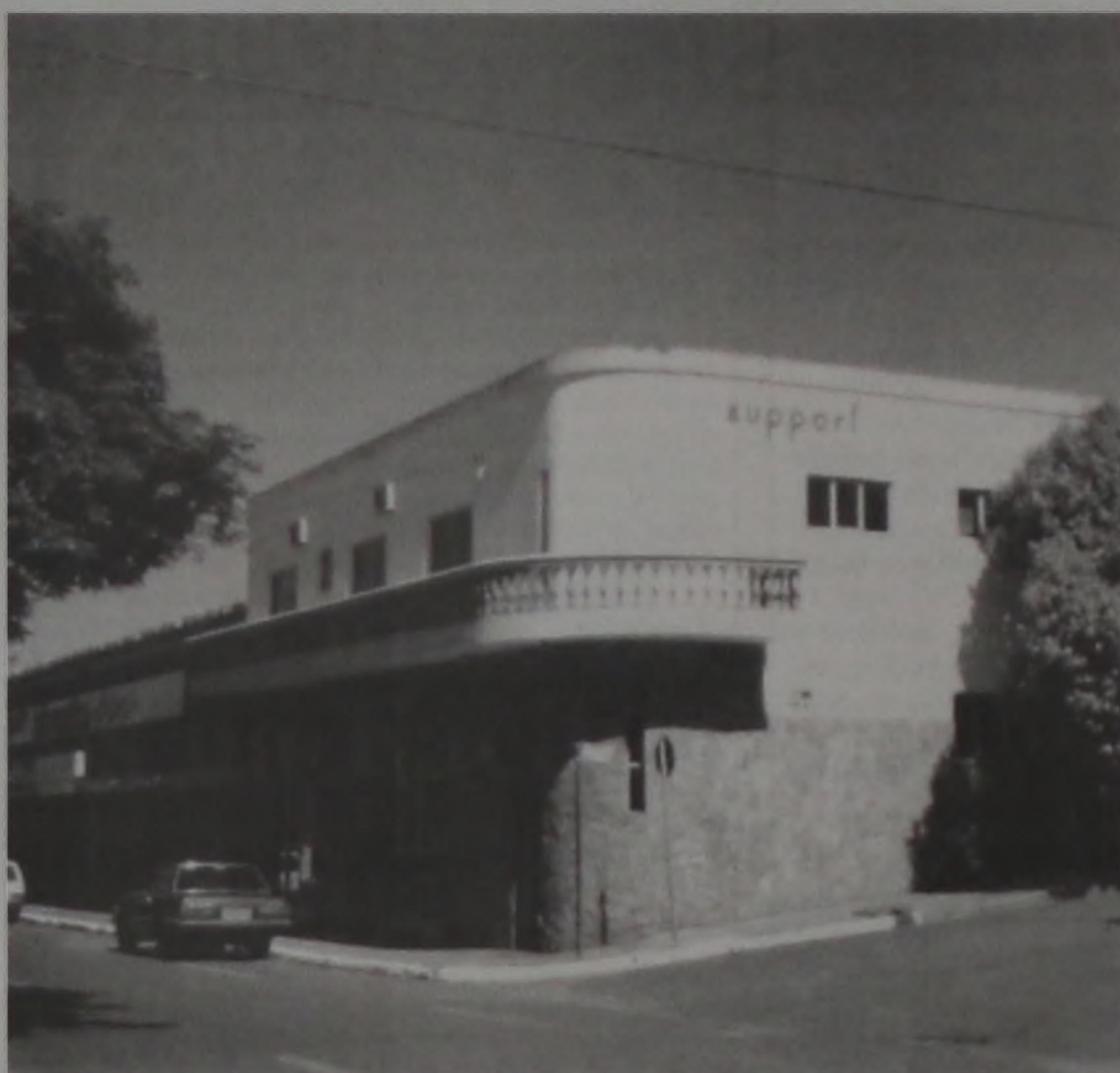
Diretores da Support lamentam a posição dos vereadores da oposição

Seria conveniente que alguns dos vereadores contrários à ocupação do terreno da ex-metalúrgica também dessem ao povo