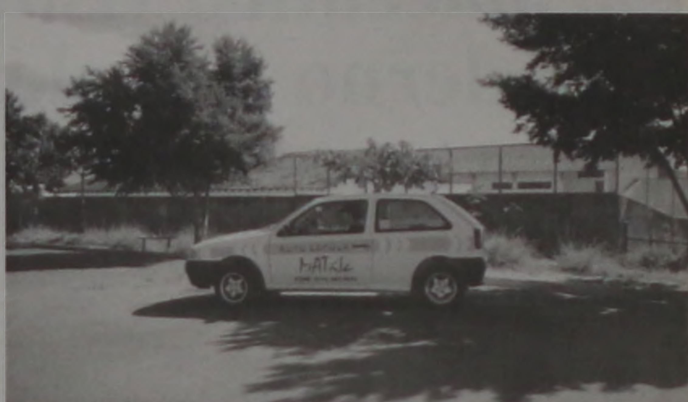
Alunos agora terão que fazer no mínimo 15 aulas práticas

A Empresa está colocando em prática o Disque CPFL que atenderá os consu-