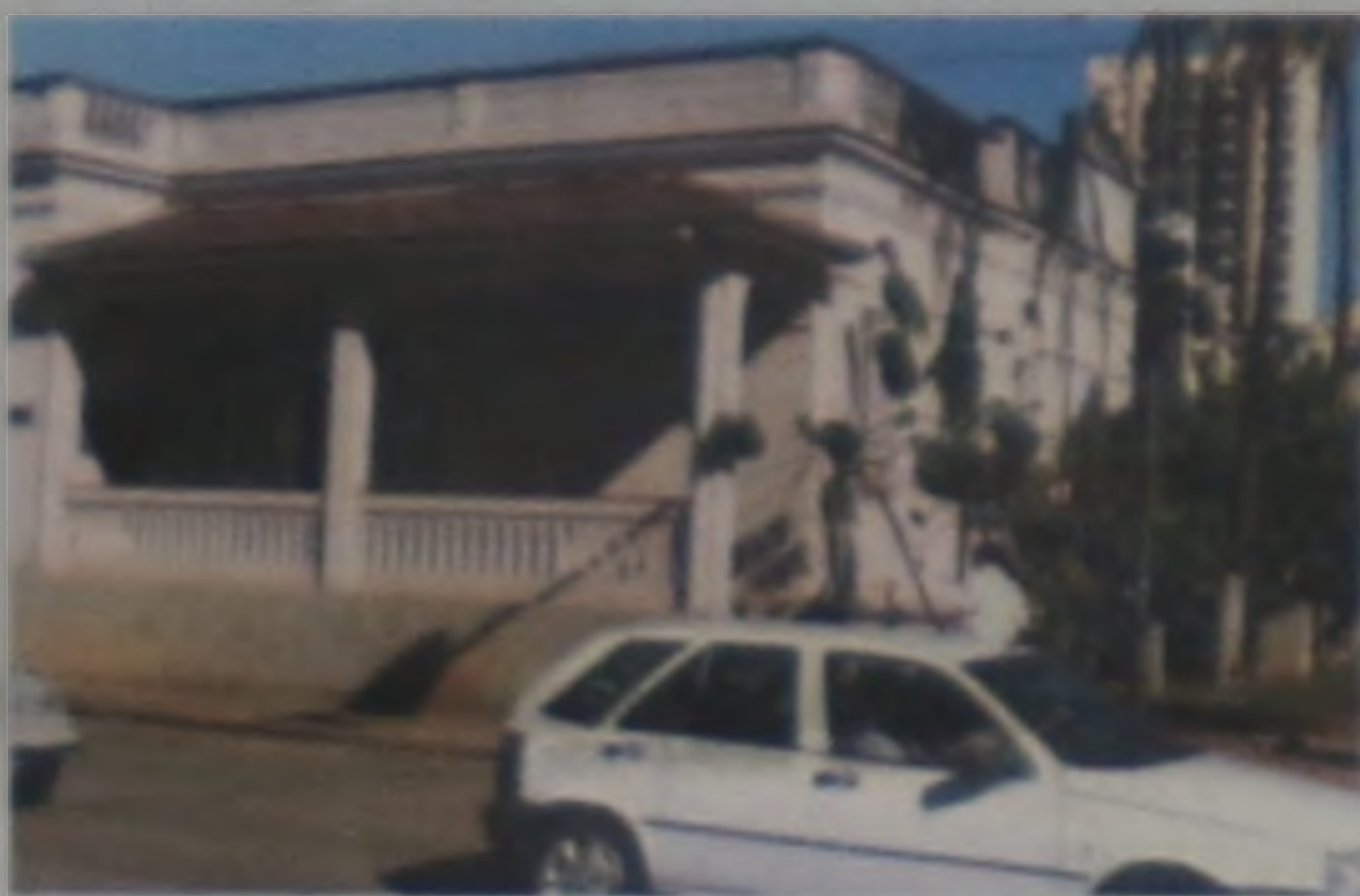
Museu Histórico Alexandre Chitto

"O ICOM - Comitê Internacional de Museus, vinculado à UNESCO - definiu universalmente museu, como instituição permanente, sem fins lucrativos, a serviço da sociedade que tem como objetivo receber doações, pesquisar, documentar, conservar e expor para fins de educação e lazer, objetos culturais e científicos".