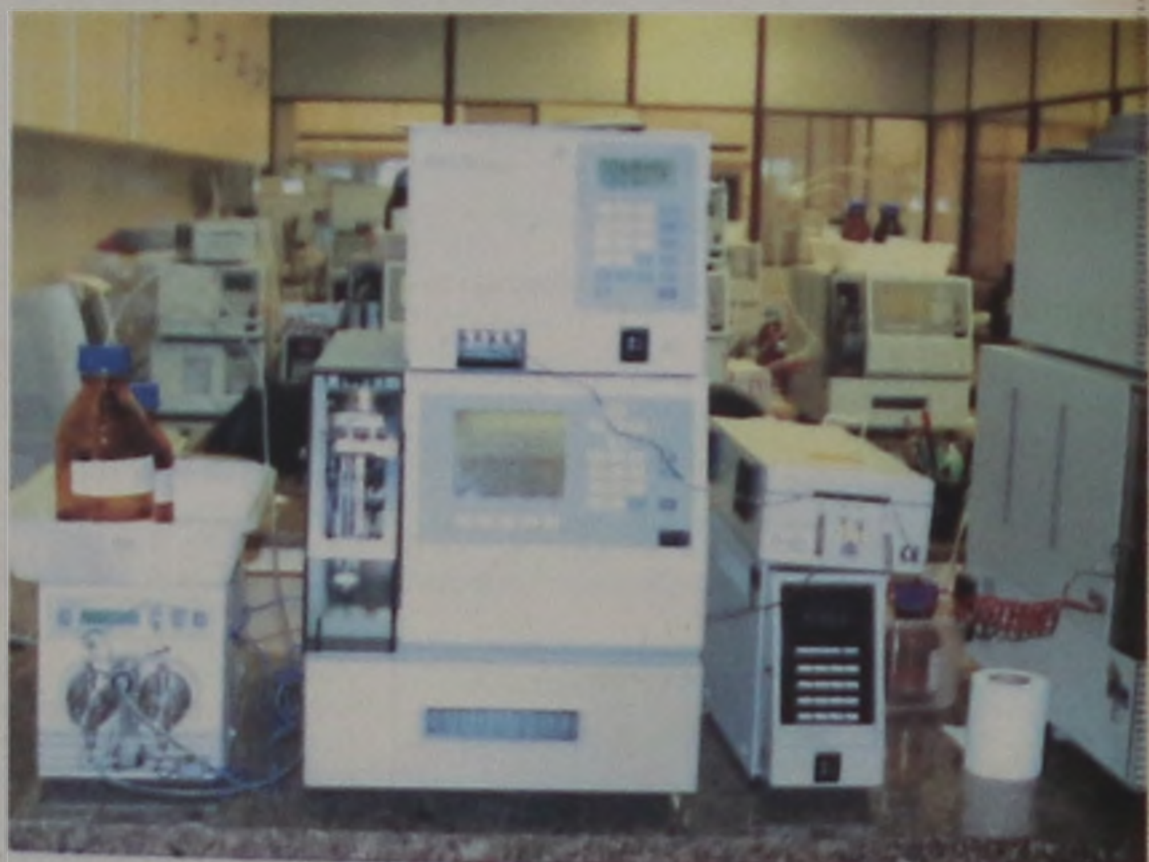
Aparelhagem avançada do laboratório da EMS

Os usuários de medicamentos segundo Campa-