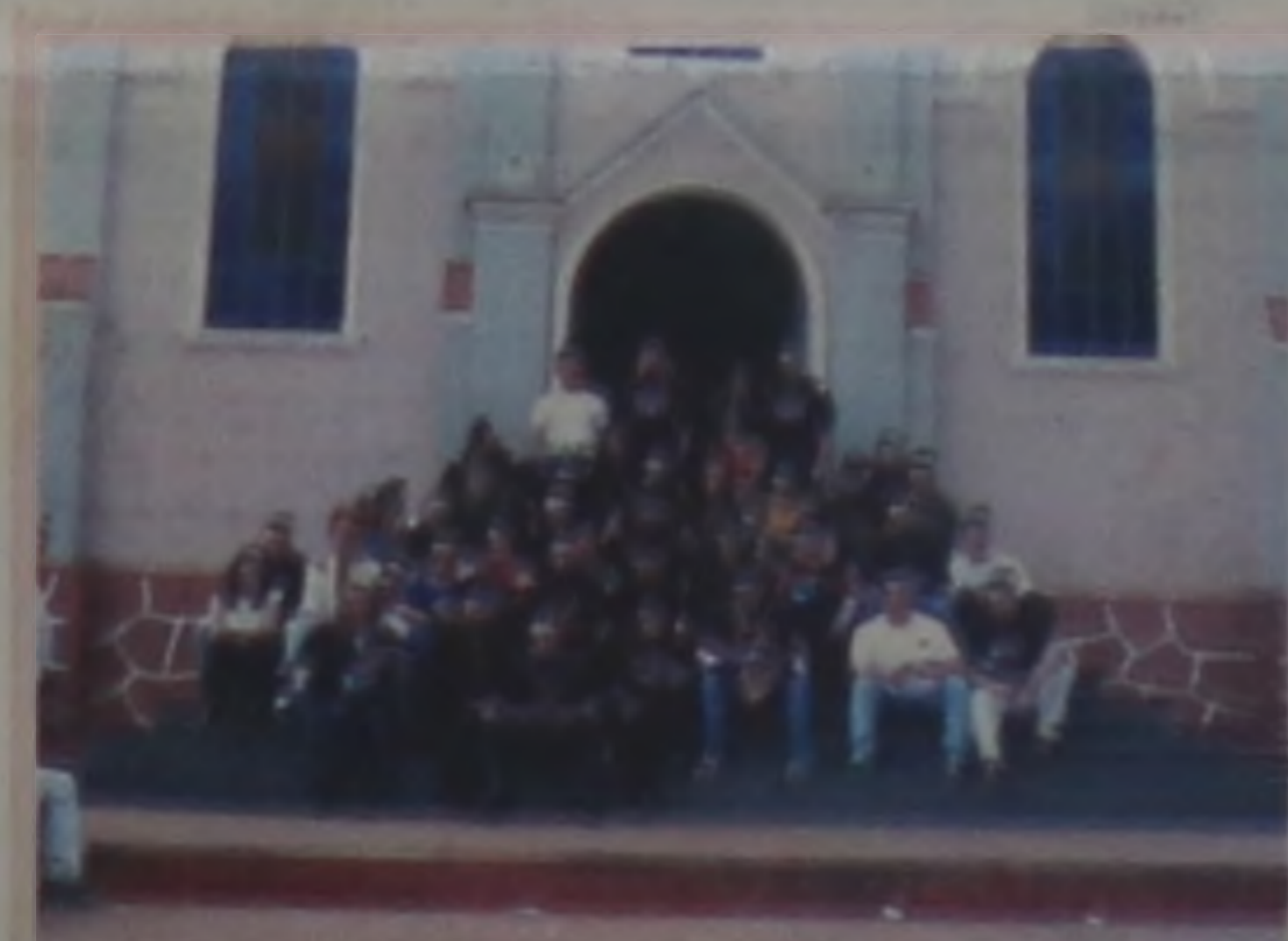
Os integrantes do Zuando Moto Clube de Lençóis esteve no último final de semana prestigiando a Festa em Louvor aos Padroeiros Senhor Bom Jesus e São Benedito, realizada em Alfredo Guedes.