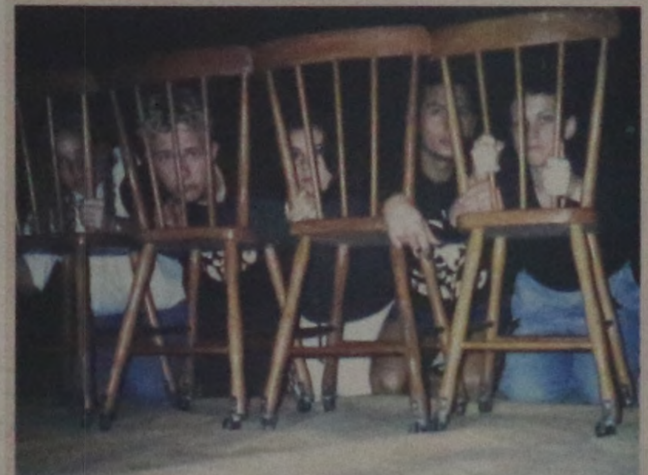
Elenco do Grupo Atos &amp; Cenas

Nos dias 19 e 20, 26 e 27 de agosto, o grupo teatral Atos & Cenas estará se apresentando na Casa da Cultura "Profª Maria Bove Coneglian".