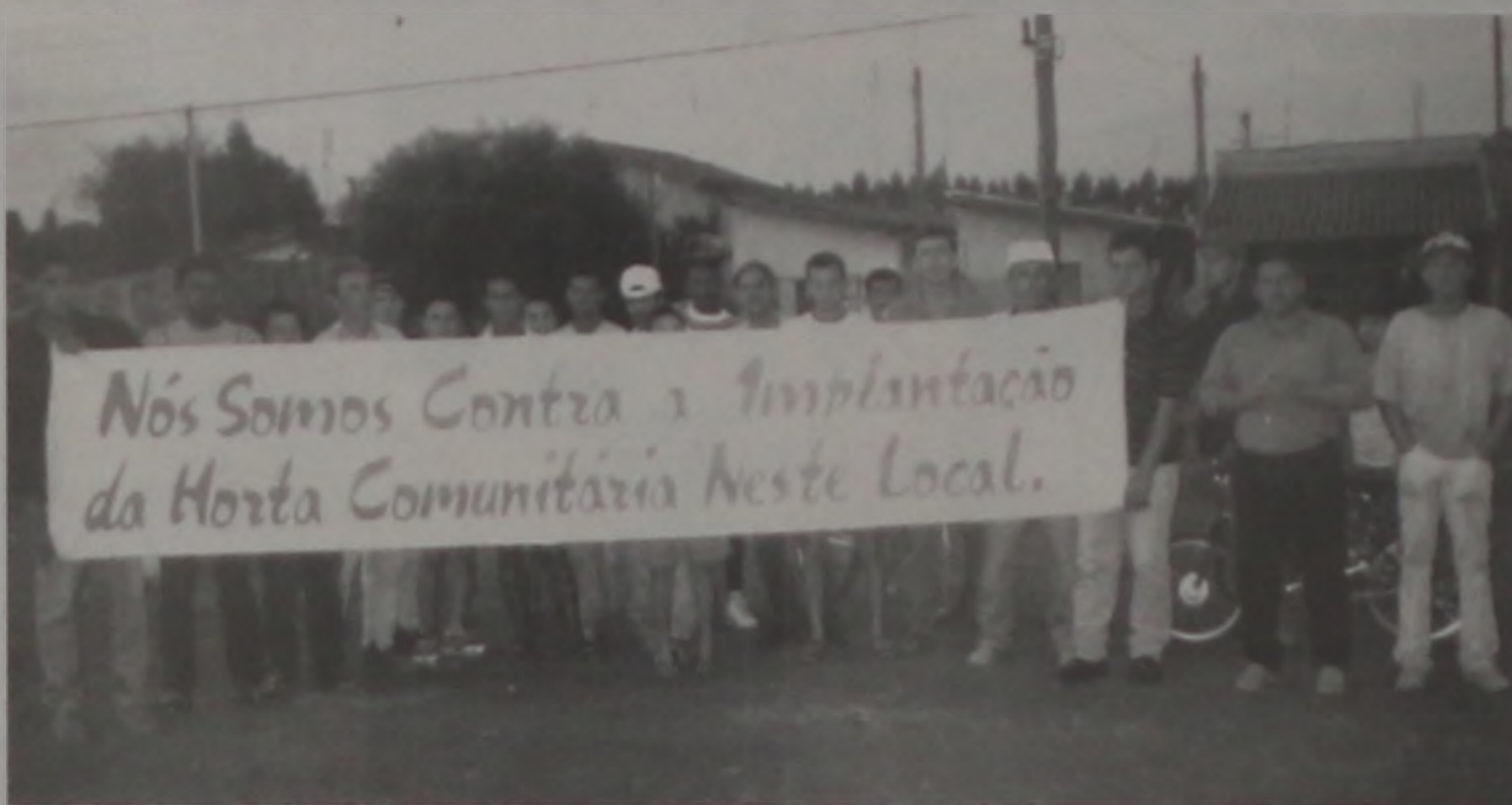
Moradores em protesto no Jardim das Nações

O local indicado para que fosse construída a horta, que fica entre a avenida Estados Unidos e rua Colombia foi idéia da Associação dos Moradores. Entretanto, a idéia não veio de encontro aos anseios dos moradores no Jardim das Nações. O fato de não concordarem com a realização dessa horta no local não quer dizer que eles são contra o benefício que a horta poderá trazer. O maior problema é a área na qual alguns membros da Associação estão querendo plantar. A área, segundo moradores daquele bairro deveria ser feita uma área de lazer, pois as crianças e moradores em geral não tem um local para descontração.