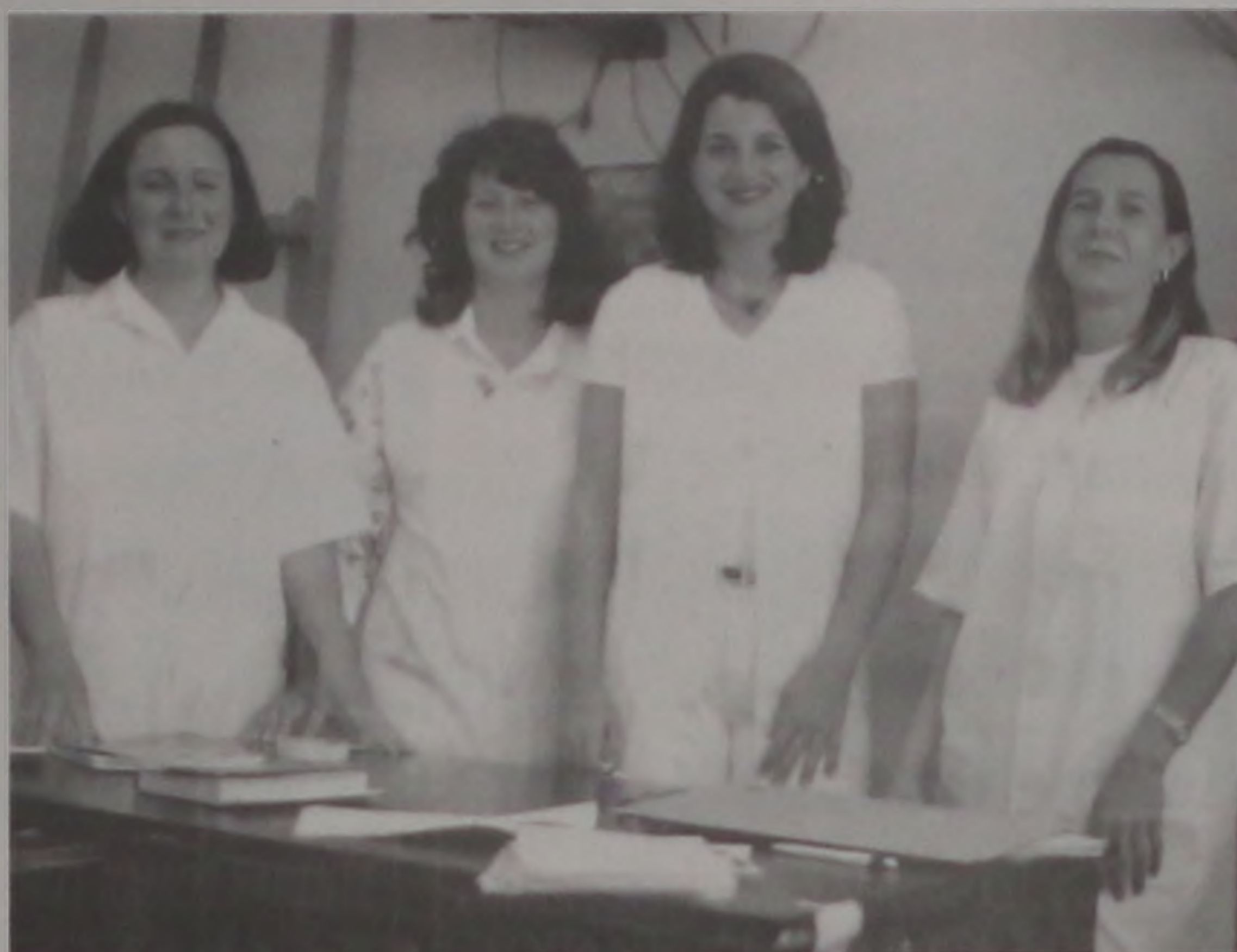
Enfermeiras responsáveis pela vacinação

Cerca de 120 funcionários estarão envolvidos nesta campanha, entre funcionários da saúde e educação com apoio da coordenadoria de saúde. As enfermeiras responsáveis pela organização