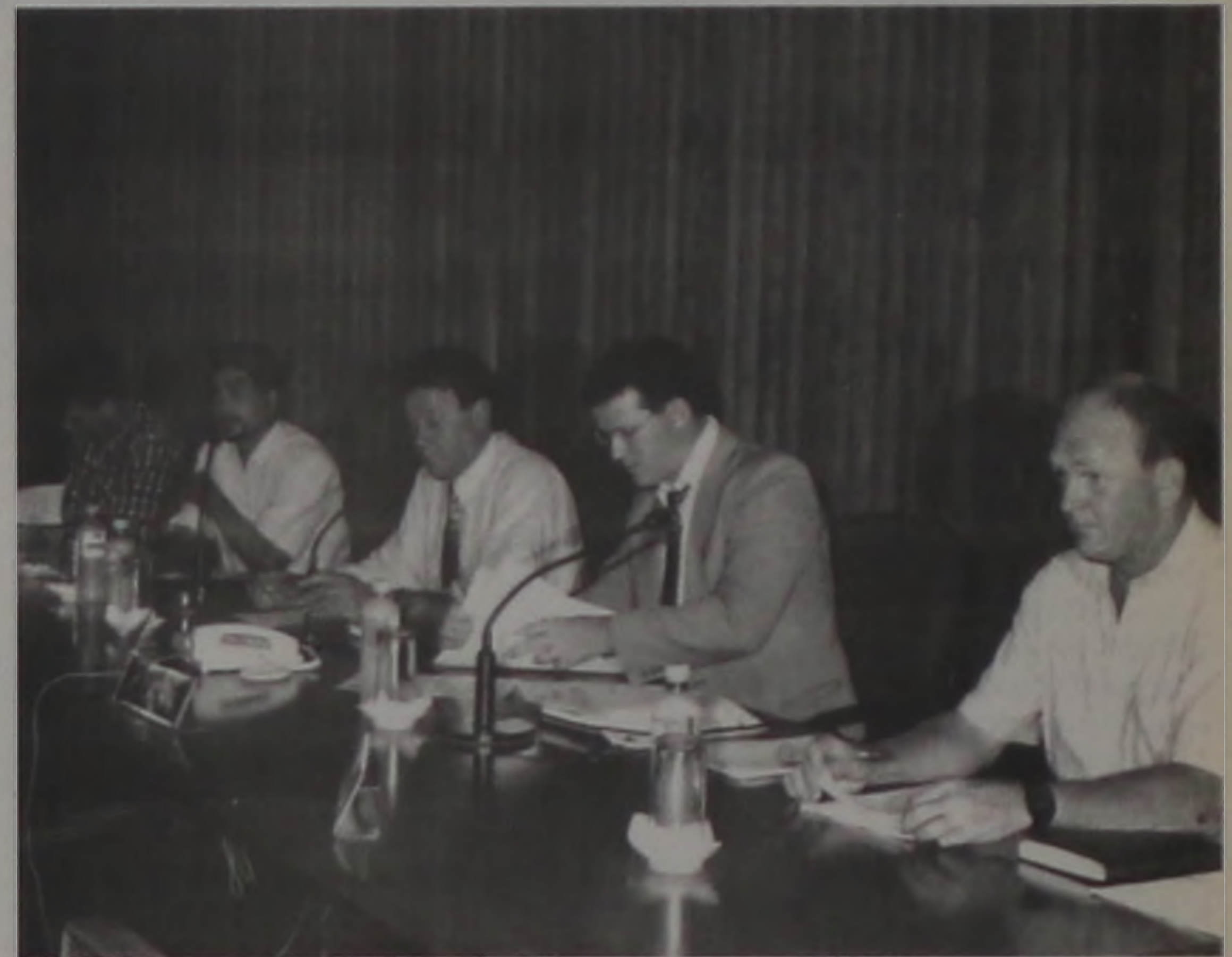
Mesa diretora da Câmara

Além da expectativa normal que toda sessão da Câmara causa, a primeira sessão deste segundo semestre marcou a volta do recesso e assim como as demais até outubro, as sessões terão uma atenção redobrada da Justiça Eleitoral, candidatos a vereador e da imprensa local.