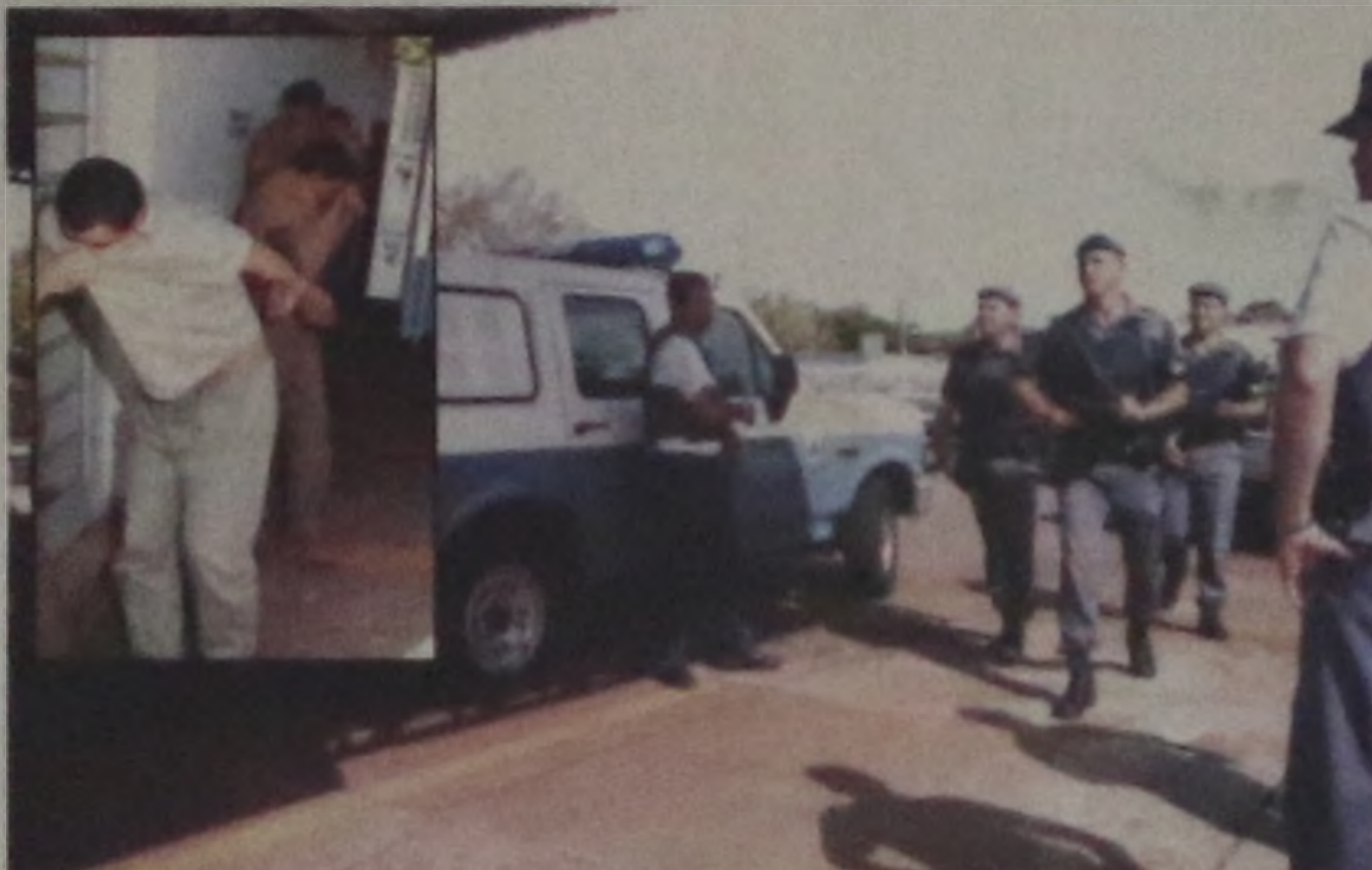
A foto mostra o forte aparato policial montado para remoção dos transgressores