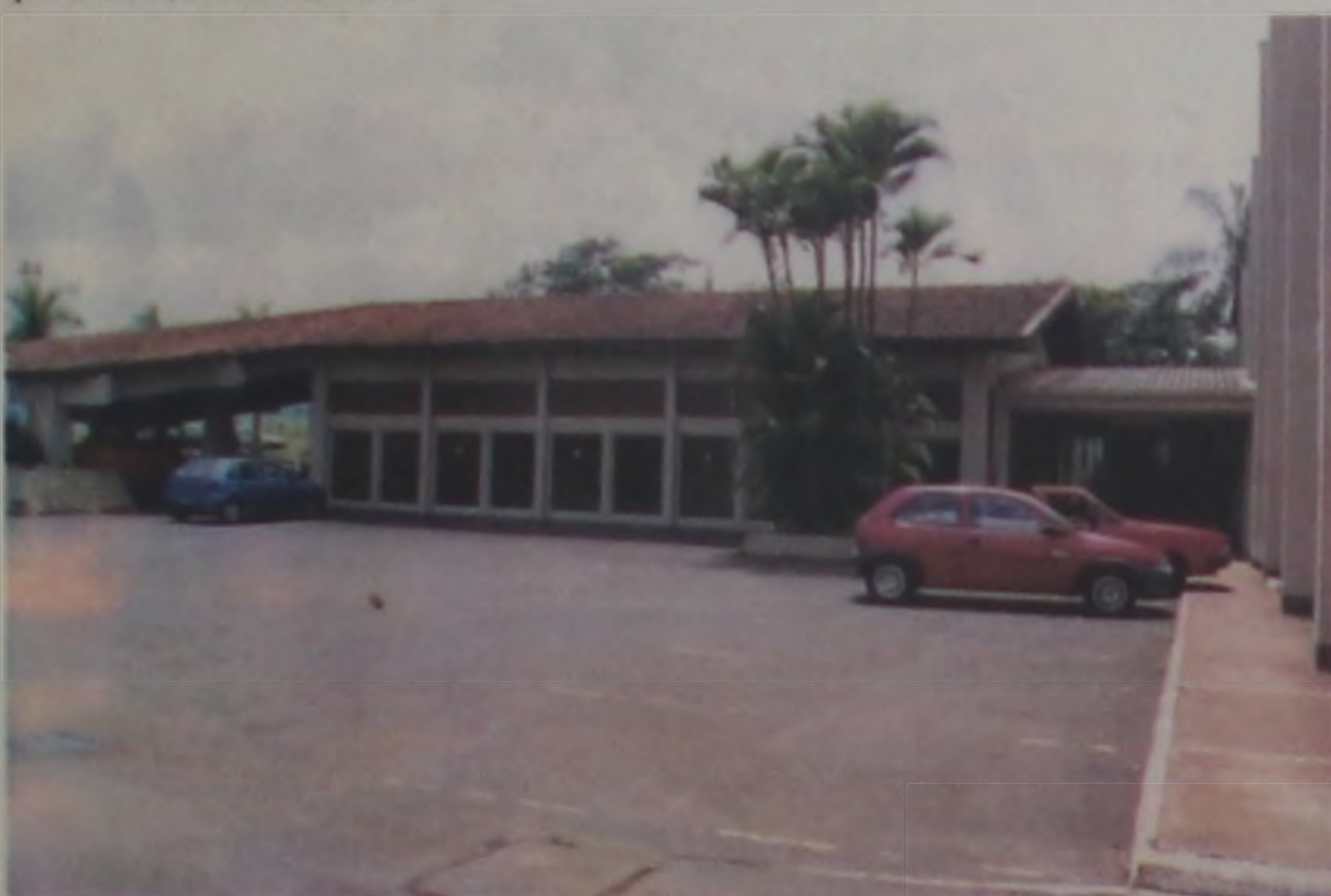
Ampla espaço da futura instalação da Salca

Monari aproveitou a oportunidade e agradeceu a to-