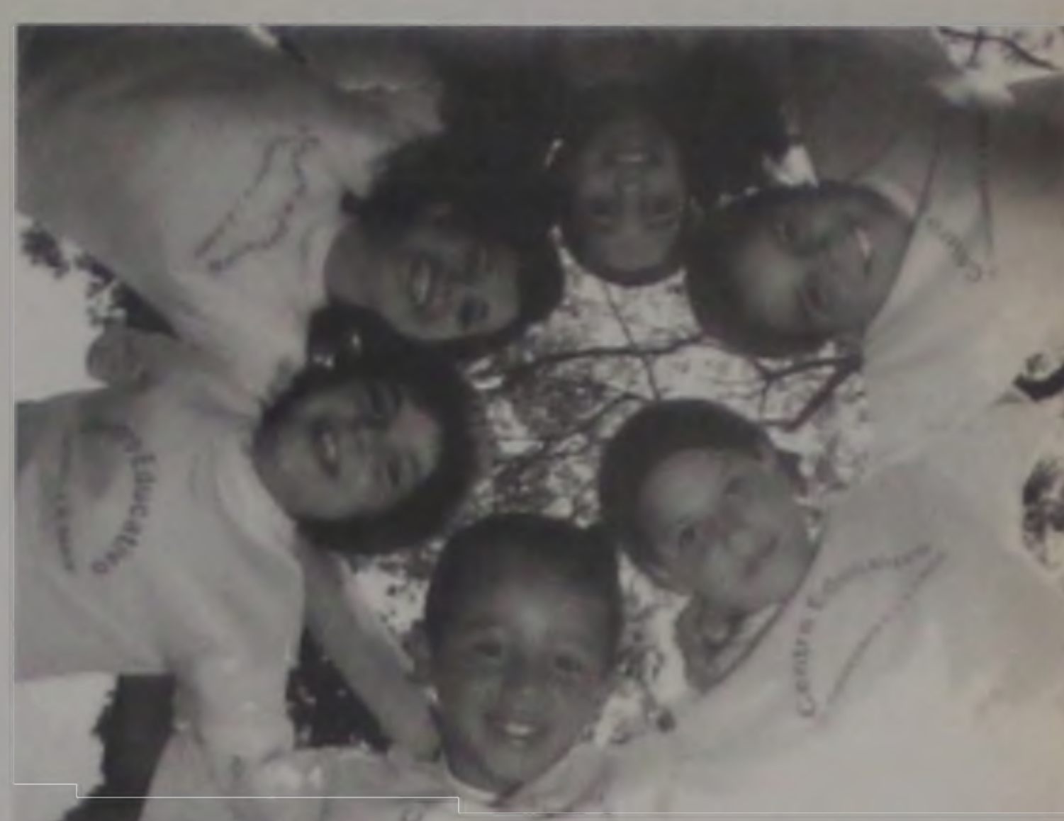
Integração e harmonia entre os alunos

Estes projetos participaram do prêmio Itaú-