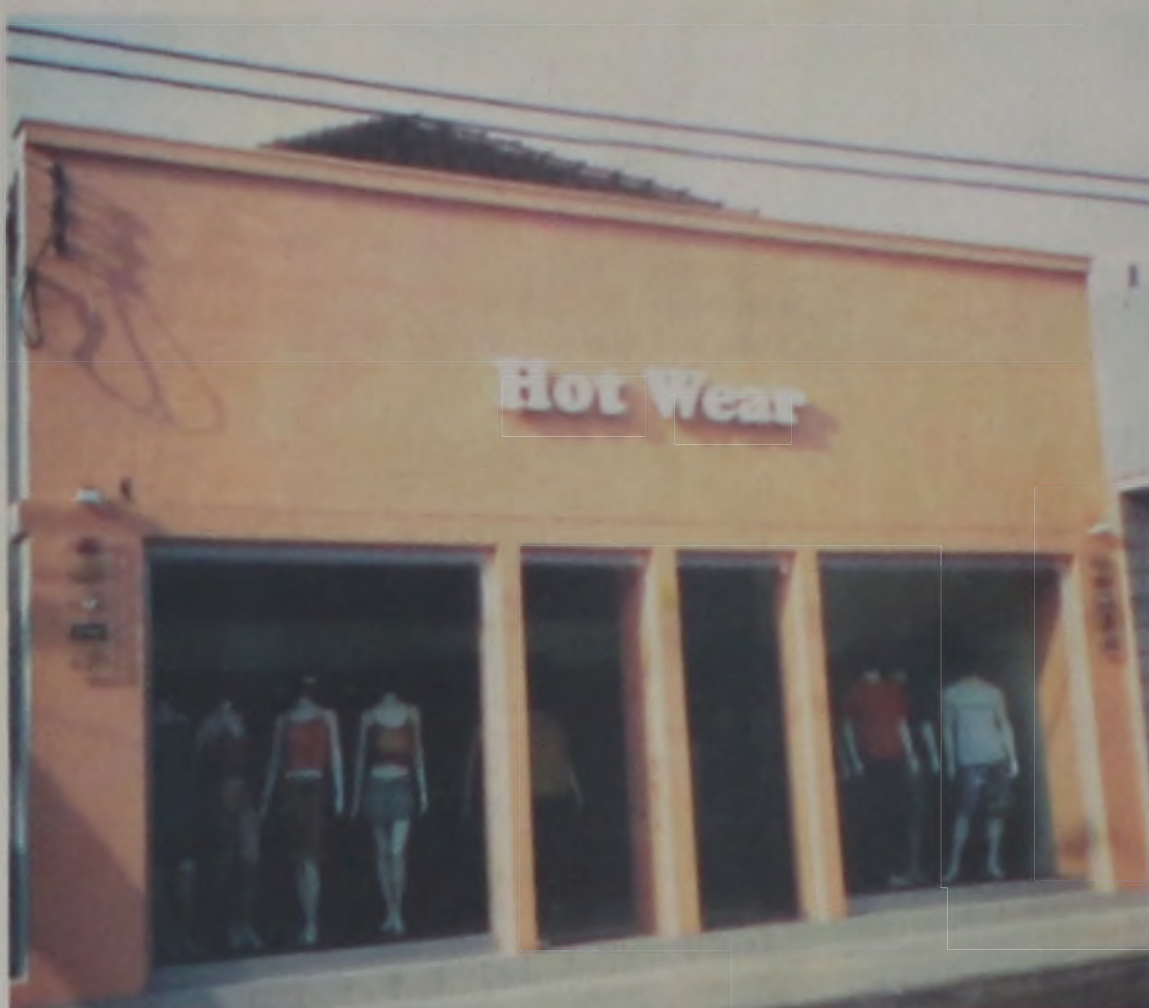
Novas instalações da loja Hot Wear