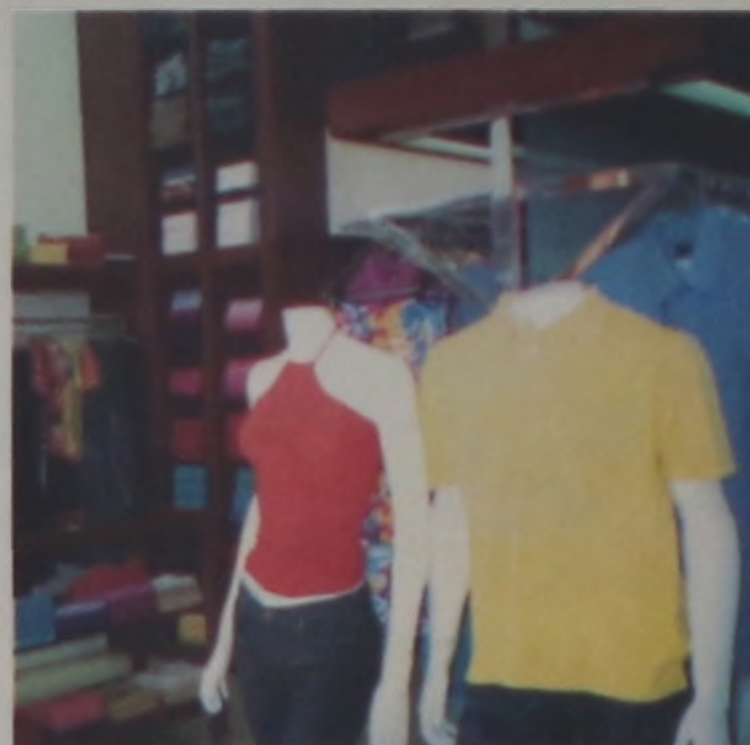
Moda feminina e masculina de variadas marcas e modelos

São Paulo, que realizaram a habilitação de treinamento da equipe de vendedoras e a disposição dos produtos da nova loja.