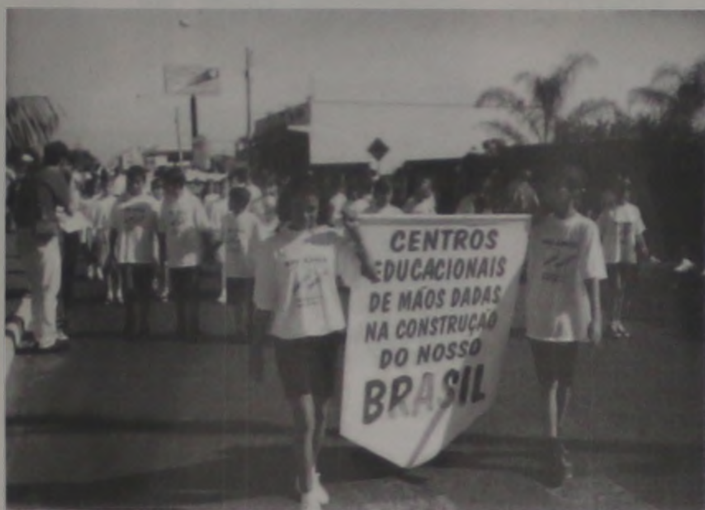
Alunos representando os Centros Educacionais