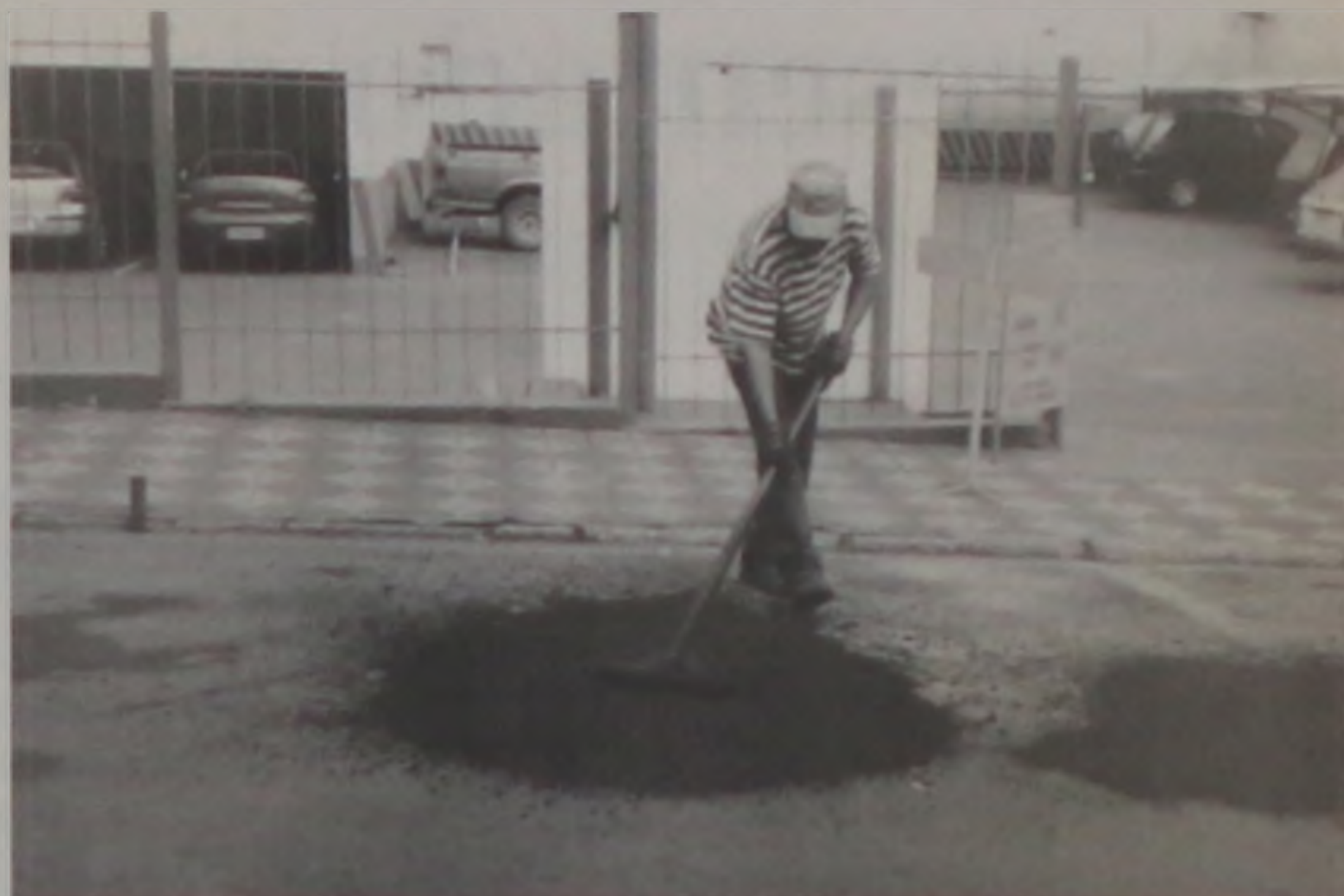
A operação tapa buracos atuou no centro da cidade

de Oliveira Capucho e a rua Degleir Martins Tangerino e rua José Rossi, onde está localizada a rede mestre construída junto ao antigo "buracão" como forma definitiva de interromper o processo de erosão que há cerca de 10 anos afetava aquela área. As verbas para esta etapa são verbas oriundas dos convênios com o Fehidro, cerca de R$ 108 mil e mais R$ 14 mil liberados pela Loteria da Habitação, com um participação de aproximadamente R$ 25 mil em recursos municipais.