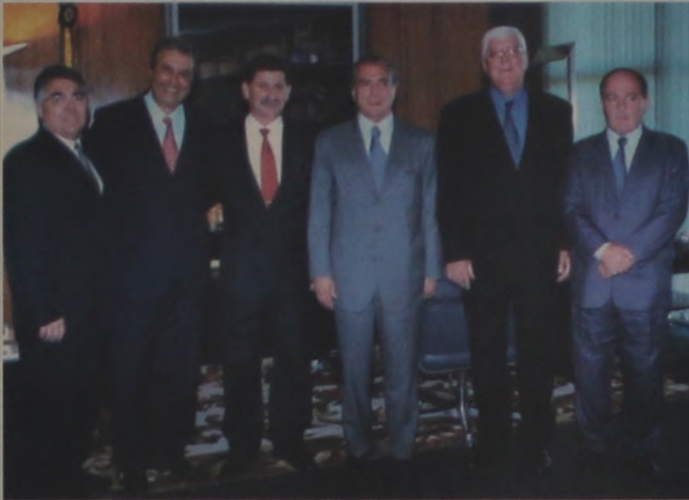
Ao centro Vaca, Michel Temer e representantes de Lençóis Paulista

Ainda para Borebi, junto ao Ministério da Cultura, foi solicitado instrumentos musicais para a complementação da Banda Municipal de Borebi, estando aguardando somente o