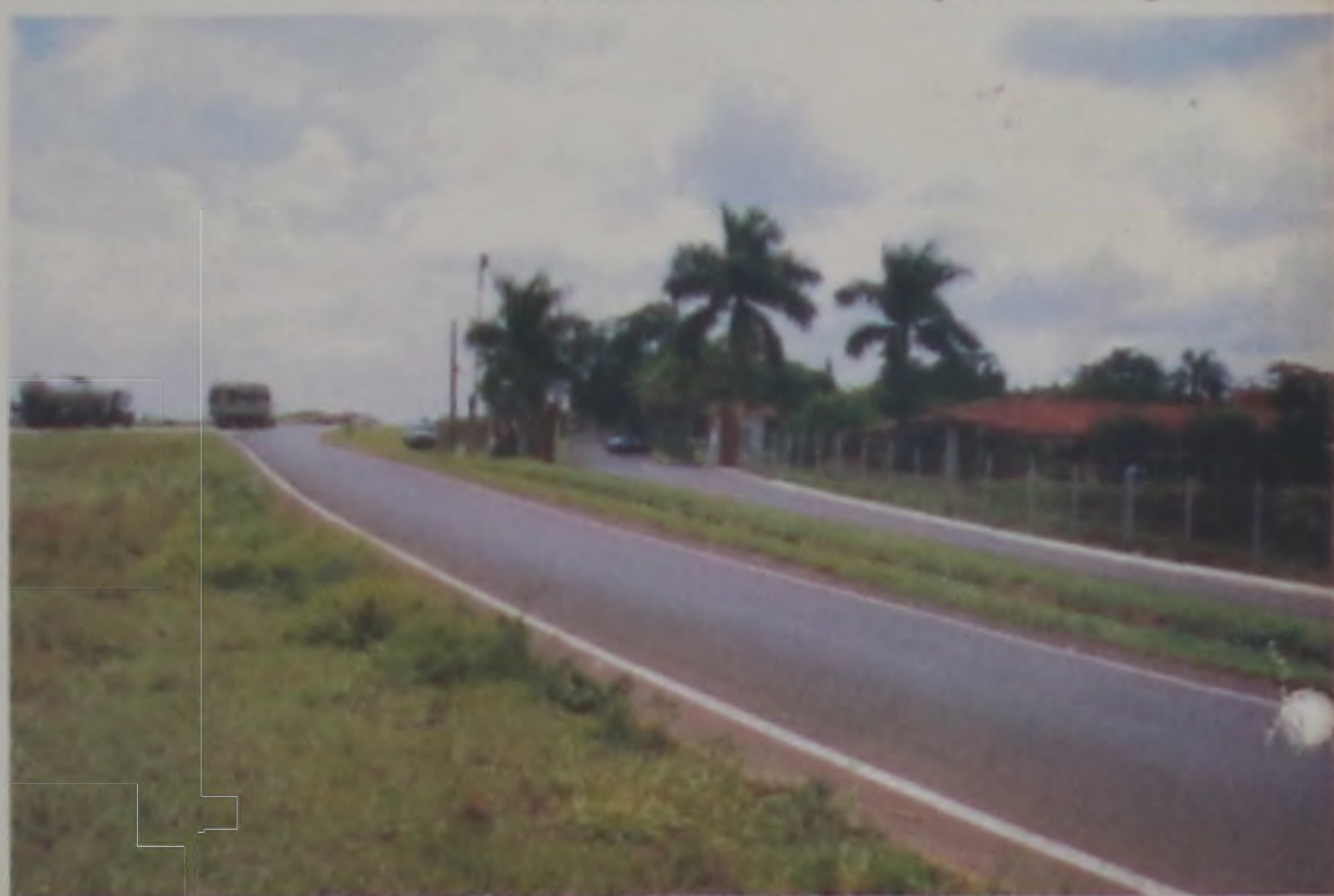
A Salca estará às margens da Rodovia Marechal Rondon

lhos desde muito cedo com um caminhão de doces de seu falecido pai. Como desde então possuía jeito para negócios, montou na cidade de Bauru a Chocochic, distribuidora do Chile Adams, mas vendeu sua parte