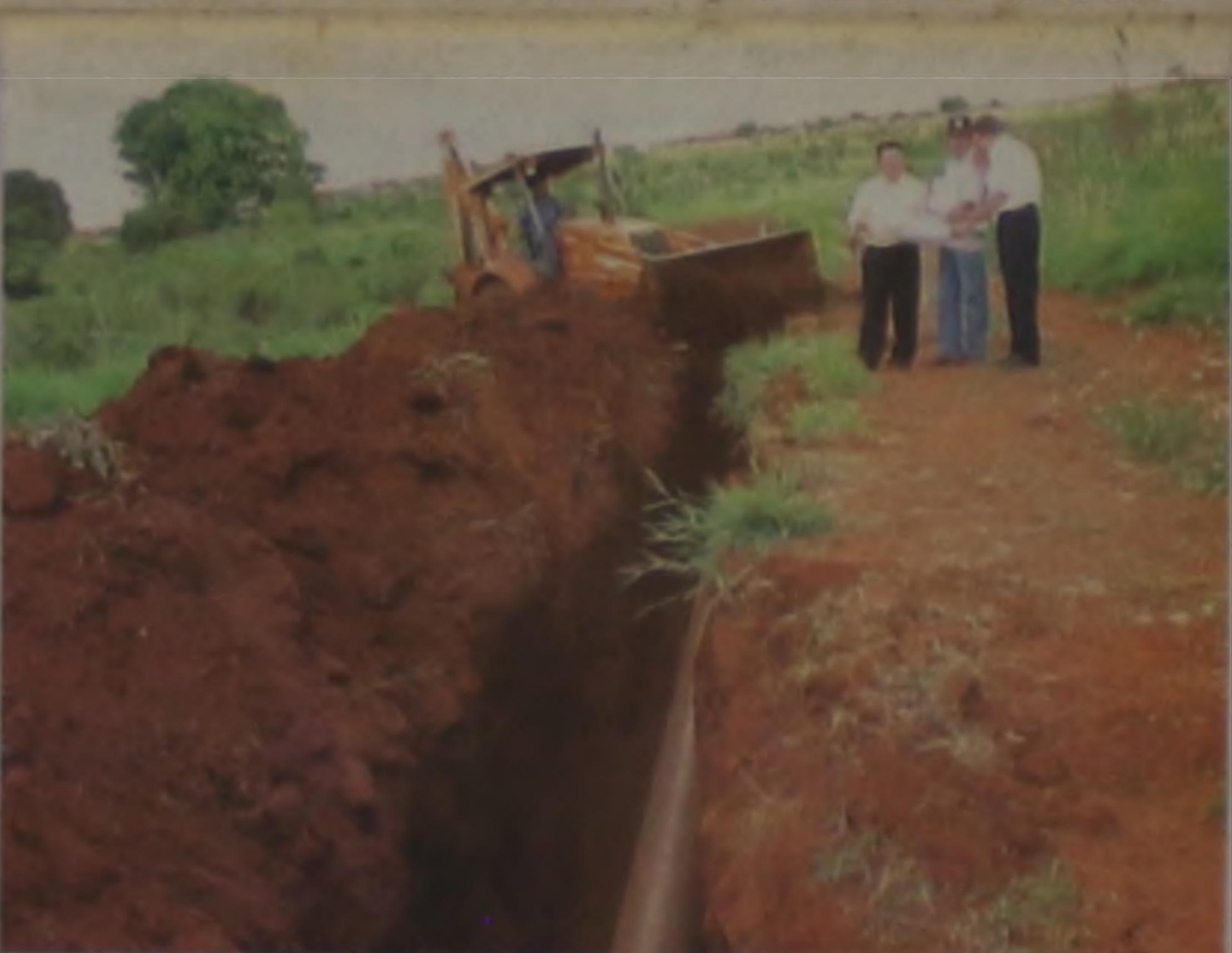
A construção de emissário deverá ter a sua primeira etapa concluída dentro 30 dias