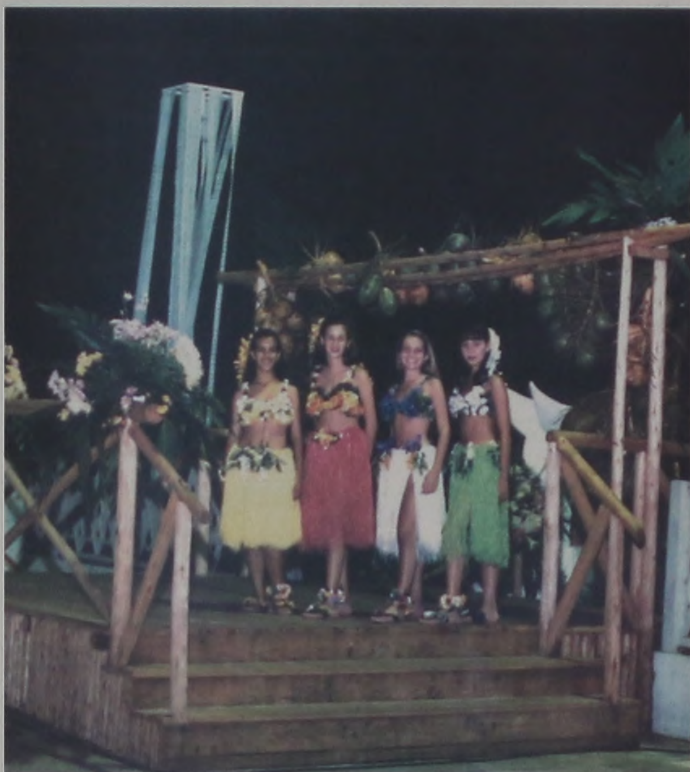
Diretoria do Clube espera cerca de 4 mil pessoas