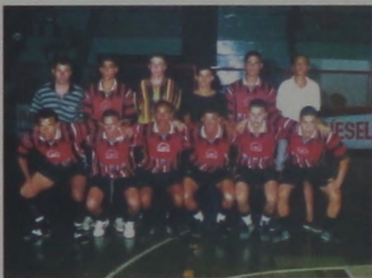
Equipe de Presidente Alves, considerada uma das mais fortes da competição

A representação de Presidente Alves largou na frente na primeira partida das semifinais da 1ª. Copa Cidade do Livro de Futsal. Em partida realizada na segunda-feira, 6 o time visitante venceu o Grêmio Lwart por 4 a 3 em partida emocionante que foi acompanhada por um