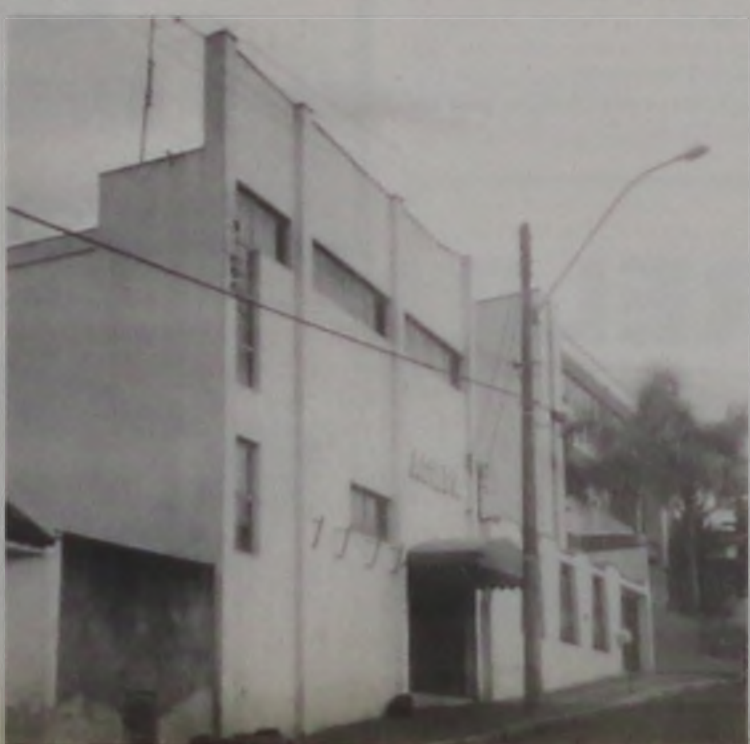
Prédio da acilpa em Lençóis

A Acilpa espera que neste ano, as vendas sejam su-