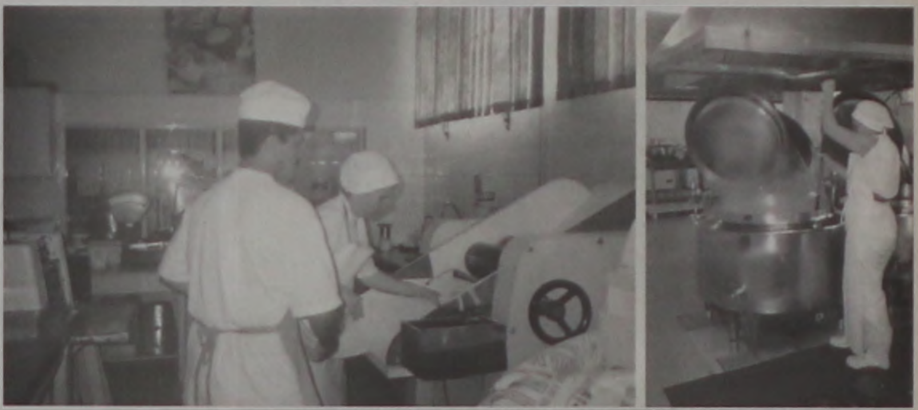
Além da merenda escolar a Cozinha Piloto produz mais de 12 mil pães por dia