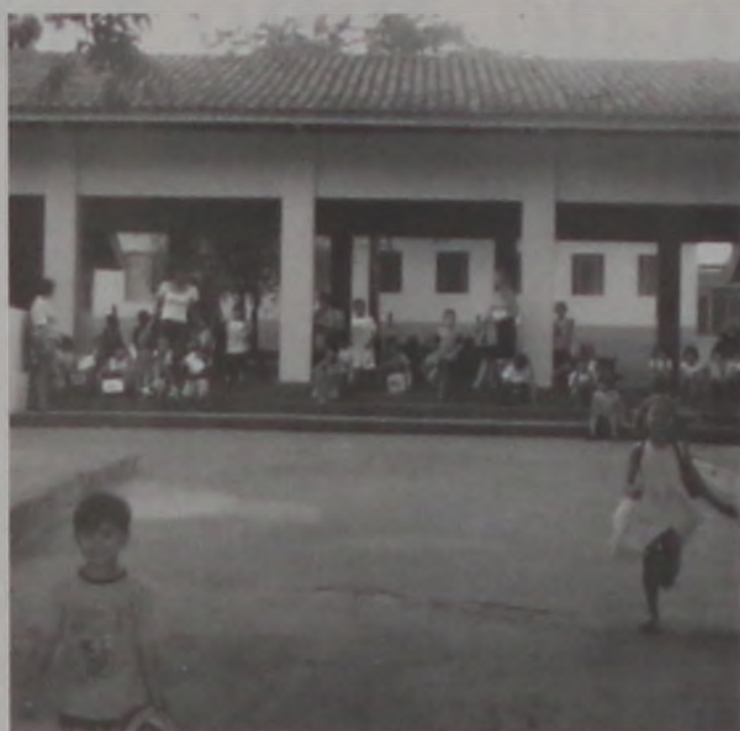
As escolas mantiveram abertas as inscrições até o dia 10

Atualmente a rede municipal conta com 7 escolas que atenderão alunos para a 1ª série. Para 2001 serão 8 escolas de ensino fundamental na rede Municipal de ensino. De acordo com a Diretora Municipal de Educação, serão disponibilizadas para o atendimento de 1ª série, 31 salas de aula com aproximadamente 32 alunos cada classe. Cerca de mil alunos estarão entrando na 1ª série da rede municipal no início de 2001.