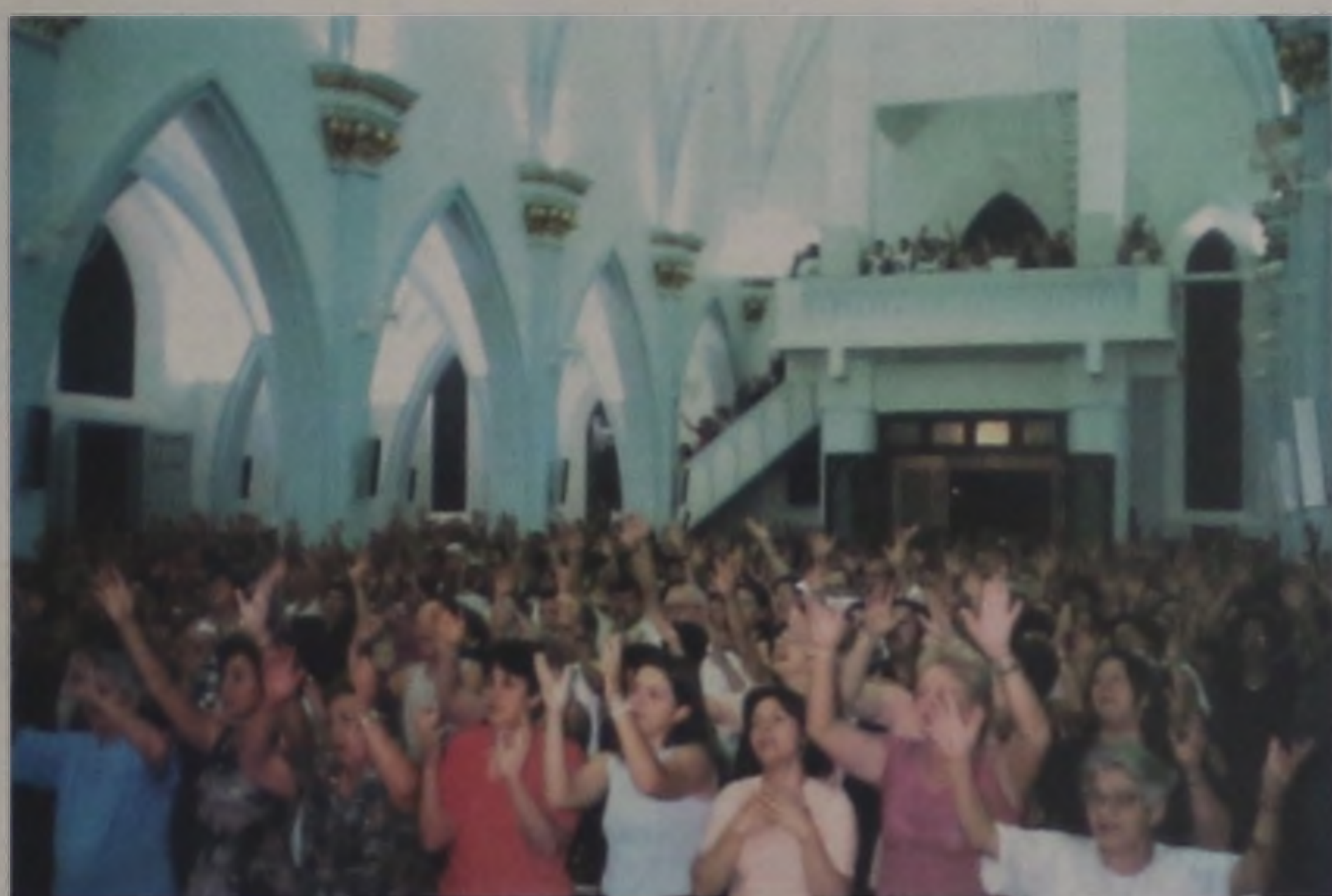
Fiéis no momento de grande louvor

Questionado sobre o significado do Cerco de Jericó, Padre Carlos disse que esta foi uma experiência que nasceu na igreja no ano de 1979 quando o Papa João Paulo II recém eleito queria visitar a Polônia mas o governo comunista não permitia a sua entrada. Os católicos poloneses daquela época, inspirados na bíblia realizaram sete dias e por sete noites ininterruptas de oração pedindo que o governo liberasse a entrada do Papa e derrubassem a muralha na qual não deixavam eles verem a importância da visita. Os católicos poloneses inspiraram-se também na passagem da bíblia no livro de Josué, que narra a época em que o povo de Deus, após sair da escravidão do Egito, partiram em busca da cidade