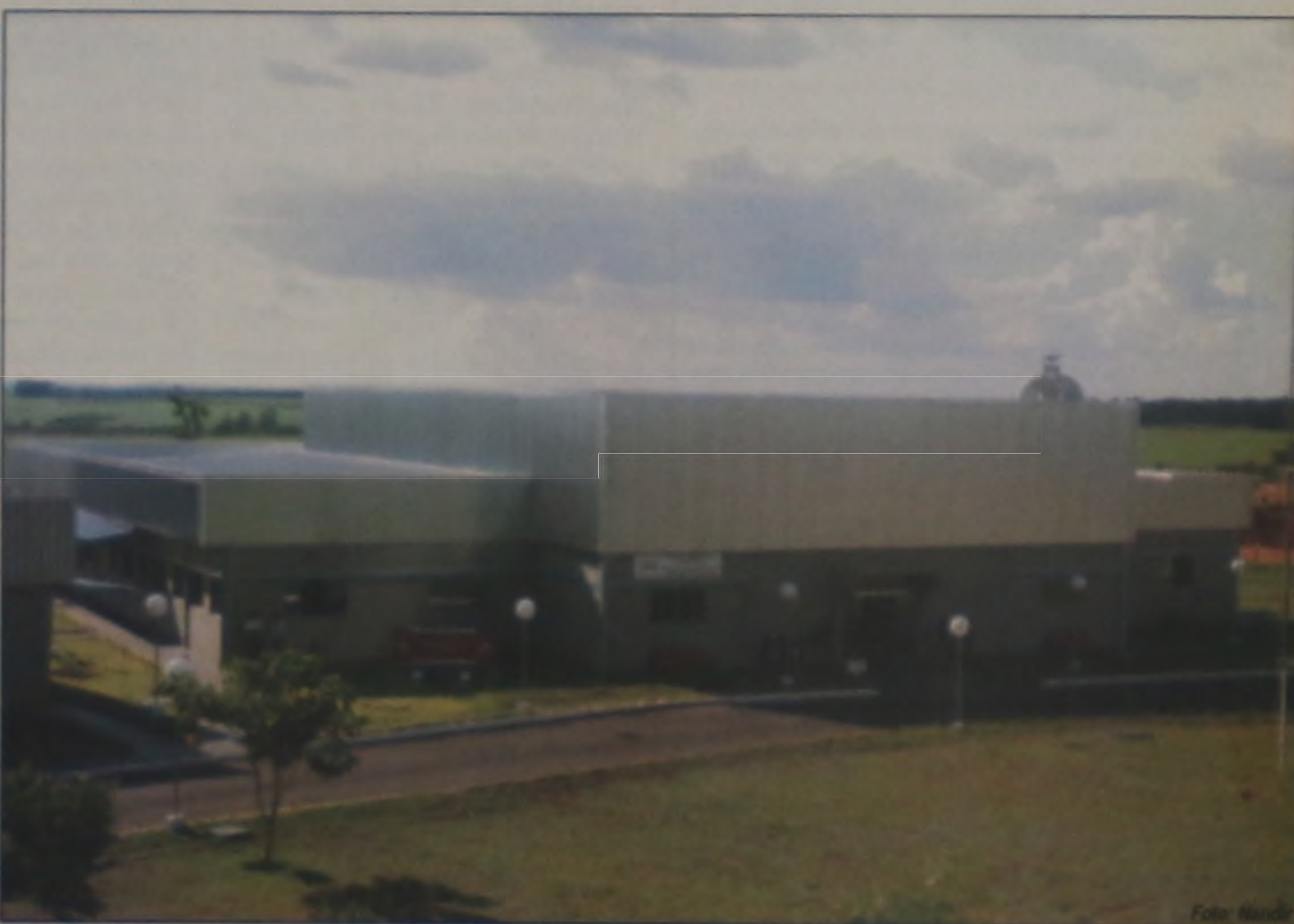
As novas instalações do senai somam 2.200 m 2