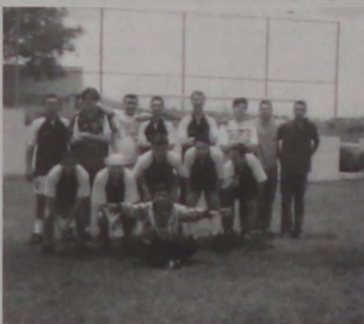
A equipe de futebol do TLC de Lençóis em partida amistosa derrotou a agremiação do TLC de Botucatu por 3 a 0 no último final de semana. Valeu galera!