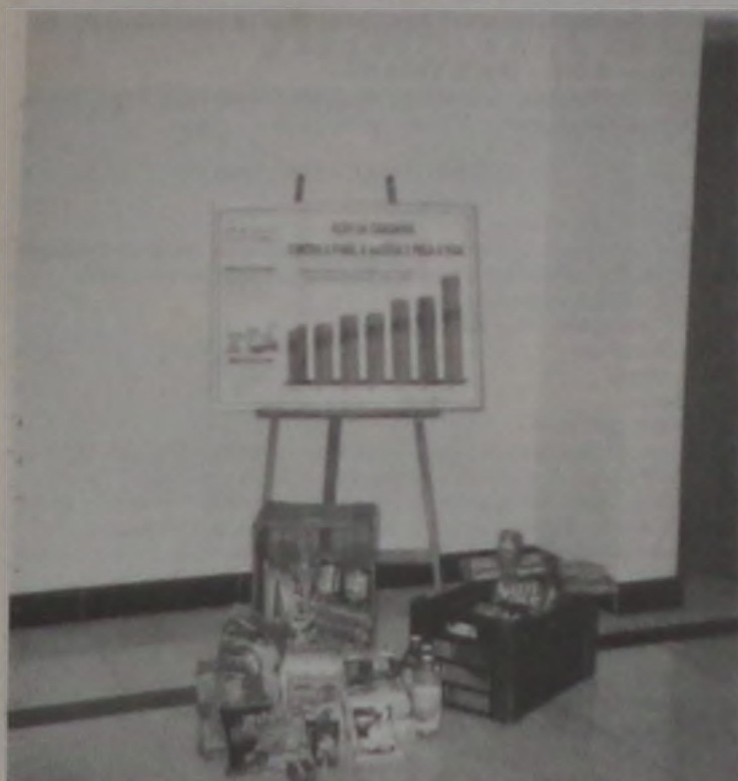
Alimentos que compõem a cesta básica

O movimento de cidadãos voluntários que integram a Ação da Cidadania Contra a Fome, a Miséria e pela Vida em Lençóis Paulista estão realizando um trabalho significativo.