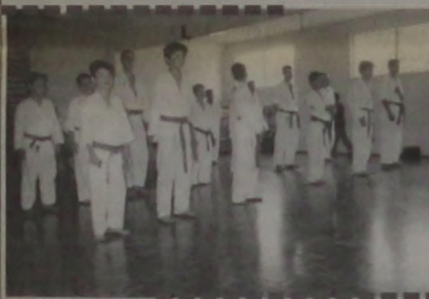
Entrega da faixa aos alunos de Karatê da Esportem Academia no dia 10/12.

Rua 28 de Abril, nº 249 - Fone: 263-0455