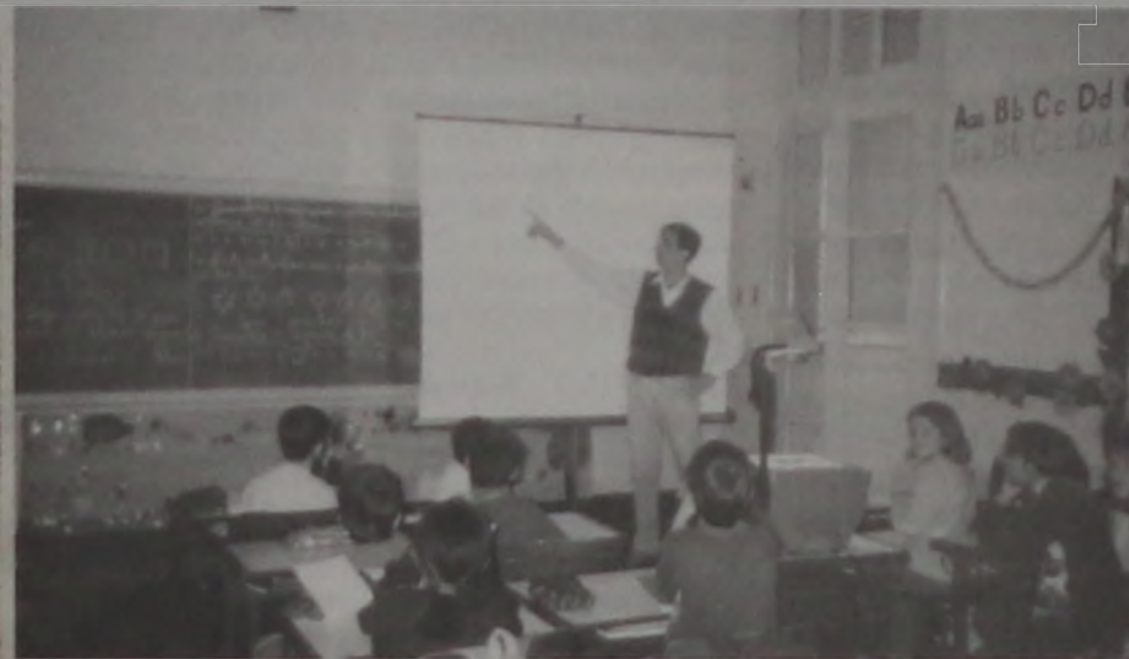
Participação de um Amigo da Escola

Com a doação de equipamento para uso de multimídia feita pela Acilpa à Escola Municipal "Esperança de Oliveira" e sua implantação proporcionada pela Prefeitura Municipal os alunos passaram a ter aulas mais atrativas.