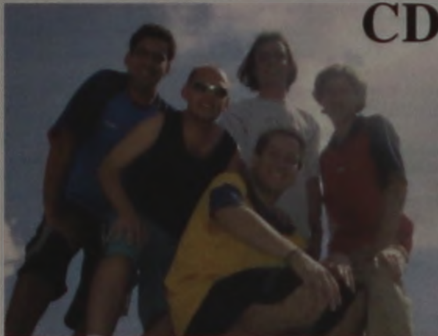
Integrantes da banda Mr. Zaap

tará lançando o trabalho de seu CD oficialmente na manhã de hoje no Planet Sound onde estarão proporcionando uma manhã de autógrafos a partir das 10h00. O grupo também estará divulgando seus trabalhos no Clube Esportivo Marimbondo, no dia 13 de janeiro com o tradicional Baile das Férias, onde estarão também divulgando os CDs.