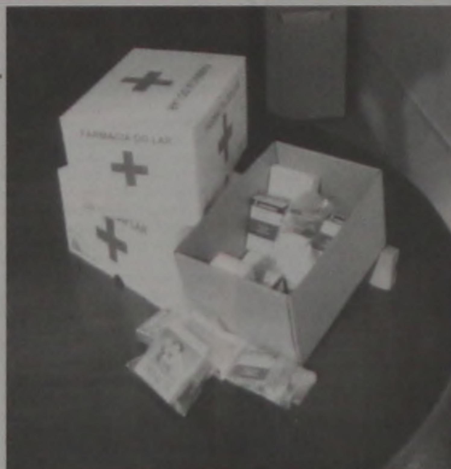
Medicamentos do Banco de Remédios

No último domingo, 10 os voluntários da Ação e Cidadania Contra a Fome entregaram dezenas de cestas básicas com gêneros natalícios para várias famílias. Além de alimentos, os voluntários entregam também remédios. Os organizadores da campanha pedem a colaboração da população