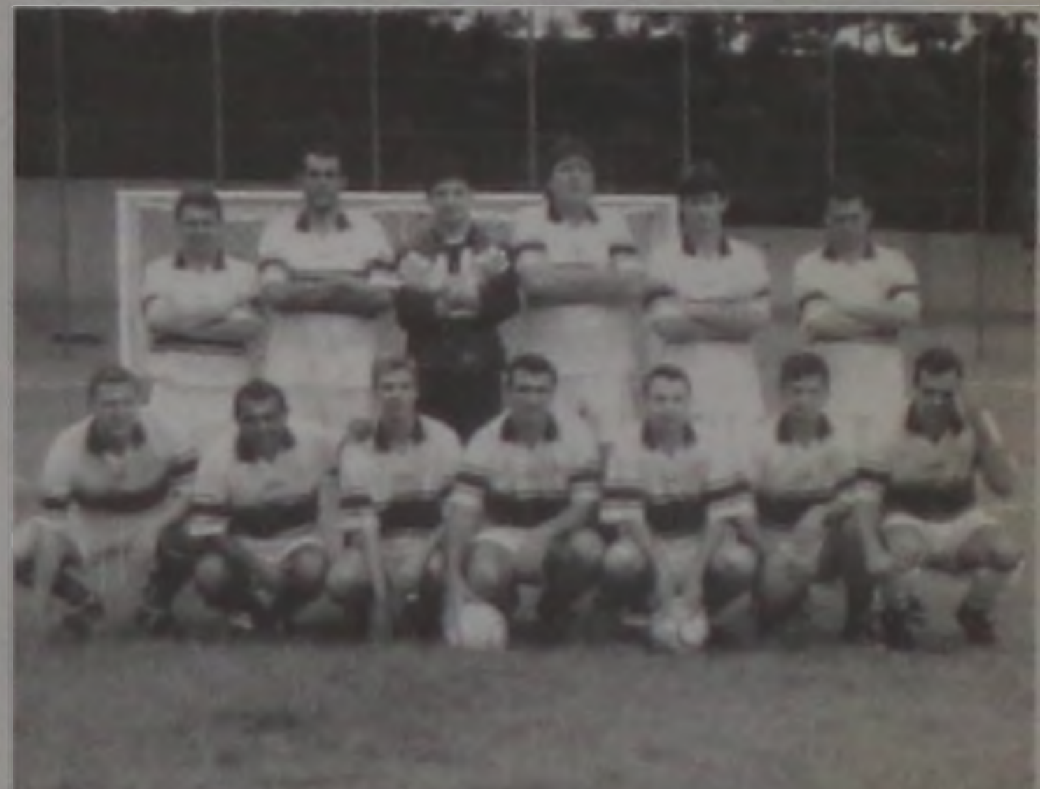
Equipe do Fluminense, vice-campeã da competição