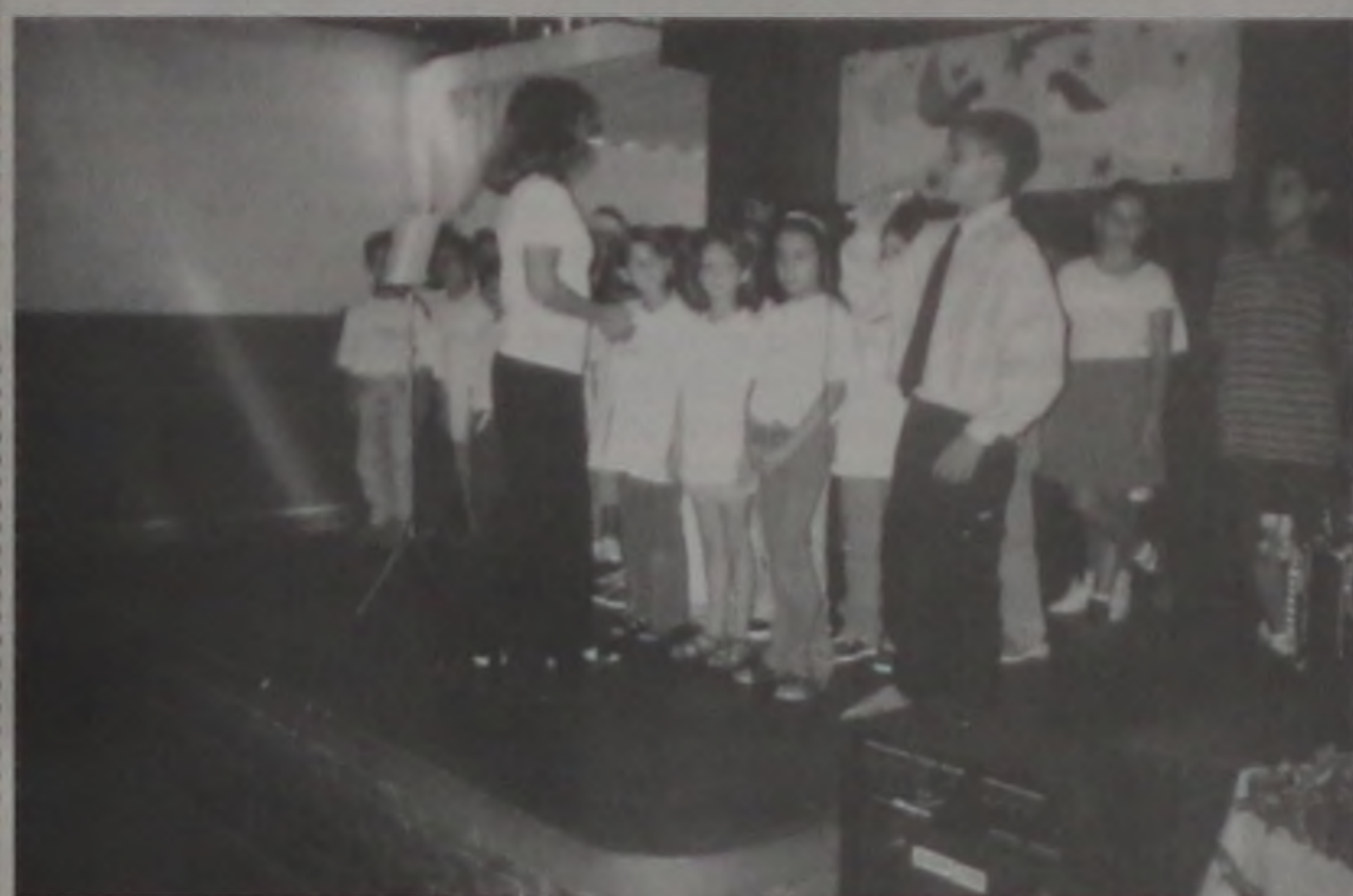
Descontração nas aulas do ensino fundamental