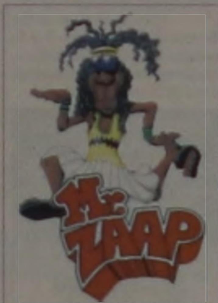
Capa do CD "O bicho vai pega"

A agenda do Mr. Zaap está praticamente tomada. Hoje a noite a banda se apresenta em Domélia, dia 23 estarão tocando na cidade de Pederneras, dando uma folga até o início de janeiro, onde esta-