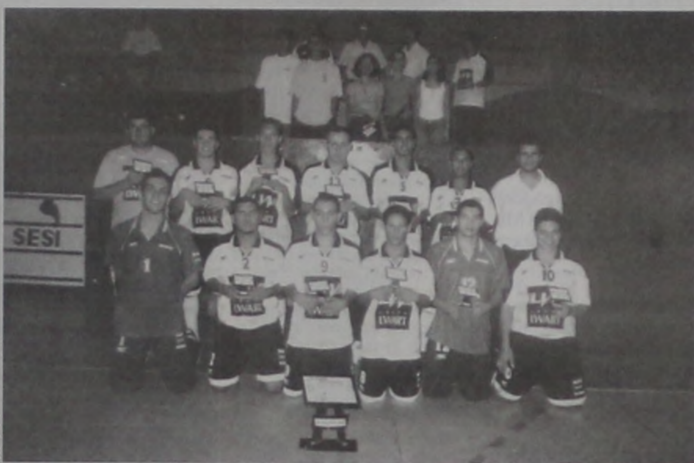
Jogadores e Comissão Técnica do Grêmio Lwart/UME

Vale ressaltar que no ano passado o time do Grêmio Lwart/UME sagrou-se vice-campeão da competição, dos 10 jogos disputados a equipe apenas perdeu um. Neste ano a equipe não deu chances para os adversários e venceu todos os jogos, num total de 10, em uma competição que reuniu cerca de 48 equipes.