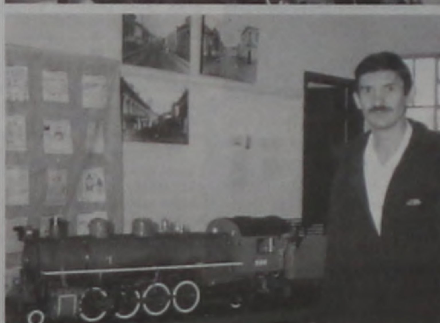
Irmãos Bottan ao lado de suas locomotivas

interesse teve em minha infância, eu vi muitas locomotivas passando pela cidade, sou apaixonado", falou.