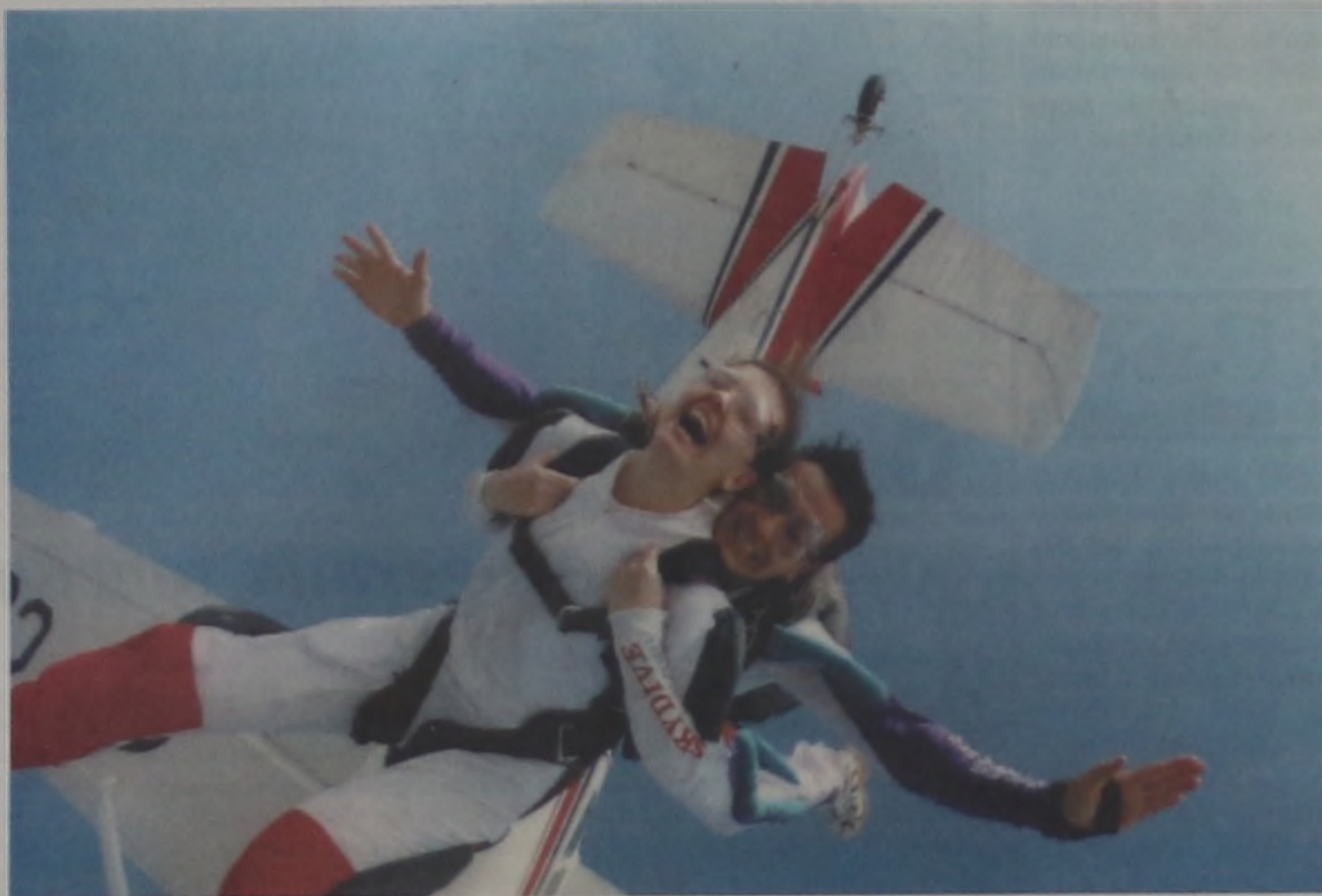
AEROMOTORSHOW - Um grande evento esportivo realizado pela Skydive está marcado para os dias 4 e 5 de agosto na cidade de Agudos. Em sua terceira edição, o Aeromotorshow trará três aeronaves lançando 120 paraquedistas, vindos de diferentes partes do país. Outra atração será a grande final do Campeonato Paulista de Motocross, campeonato de som automotivo, autocross e de off road com jipes, picapes e outros veículos 4x4. Como nem tudo é movido a motor, haverá espaço para todas as tribos. Para os apaixonados por bicicletas, haverá um encontro que deverá resultar numa competição radical. O Skydive Radical Center fica no km 330 da rodovia Marechal Rondon, entre Agudos e Bauru.

Opinião.....PÁGINA 2 Palanque.....PÁGINA 3 Esporte.....PÁGINA 4 Política.....PÁGINA 5 Entretenimento.....PÁG. 6 Bairro.....PÁGINA 7 Fluxo/Cultura..PÁGS 8 e 9 Classiico....PÁGS 10 e 11 Geral.....PÁGINA 12