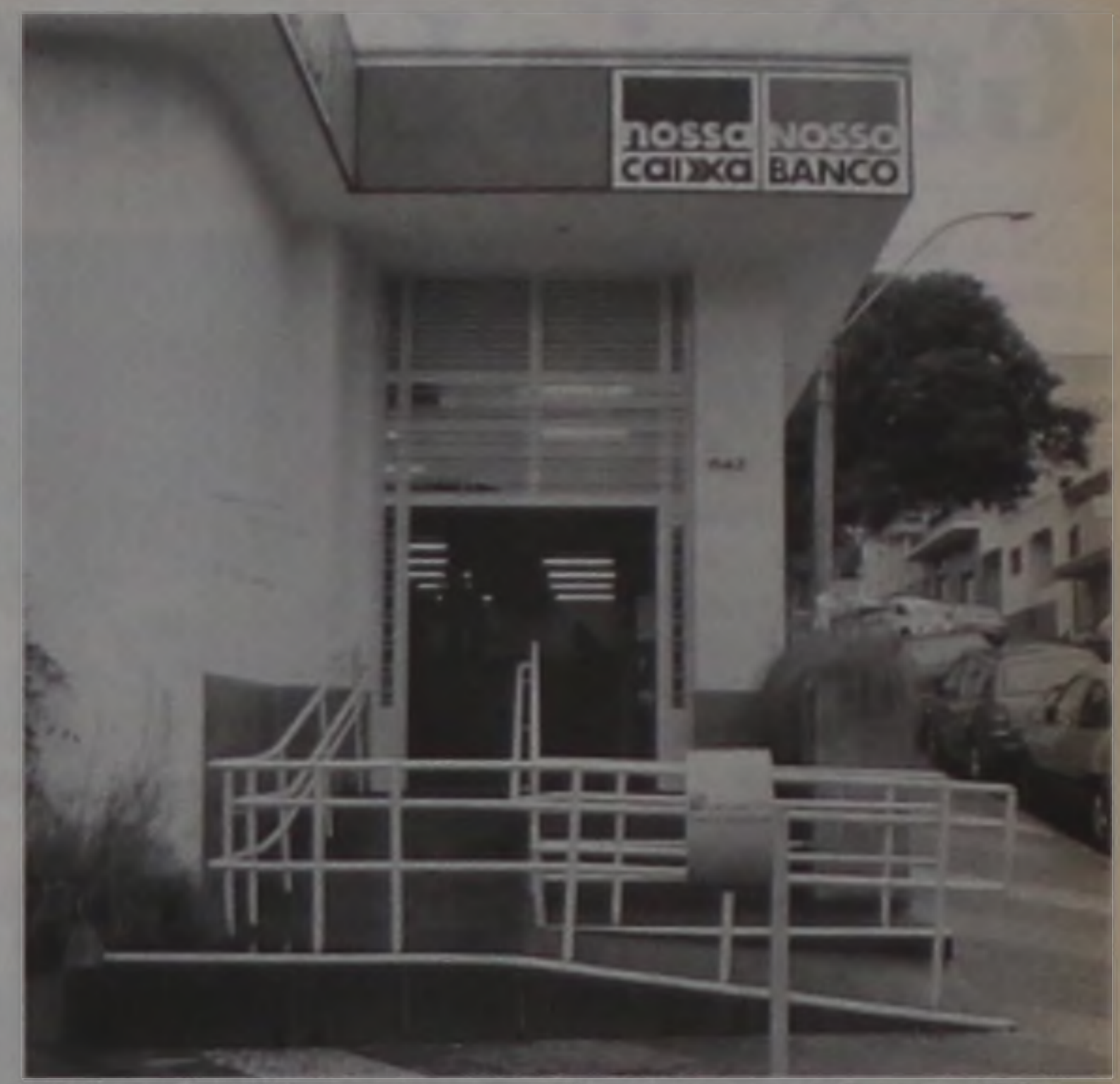
Nossa Caixa já possui a rampa de acesso para deficientes físicos

De acordo com o projeto, serão priorizados terminais rodoviários, serviços de assistência à saúde, serviço educacional, praças e centros culturais, centros esportivos, conjuntos habitacionais e principais vias públicas, dentre elas, a rua 15 de Novembro, Vinte