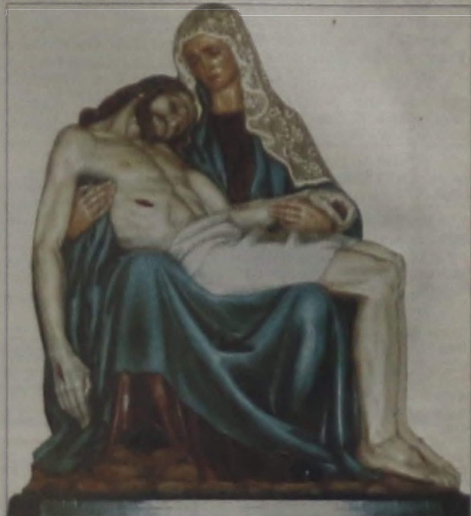
Imagem de Nossa Senhora da Piedade