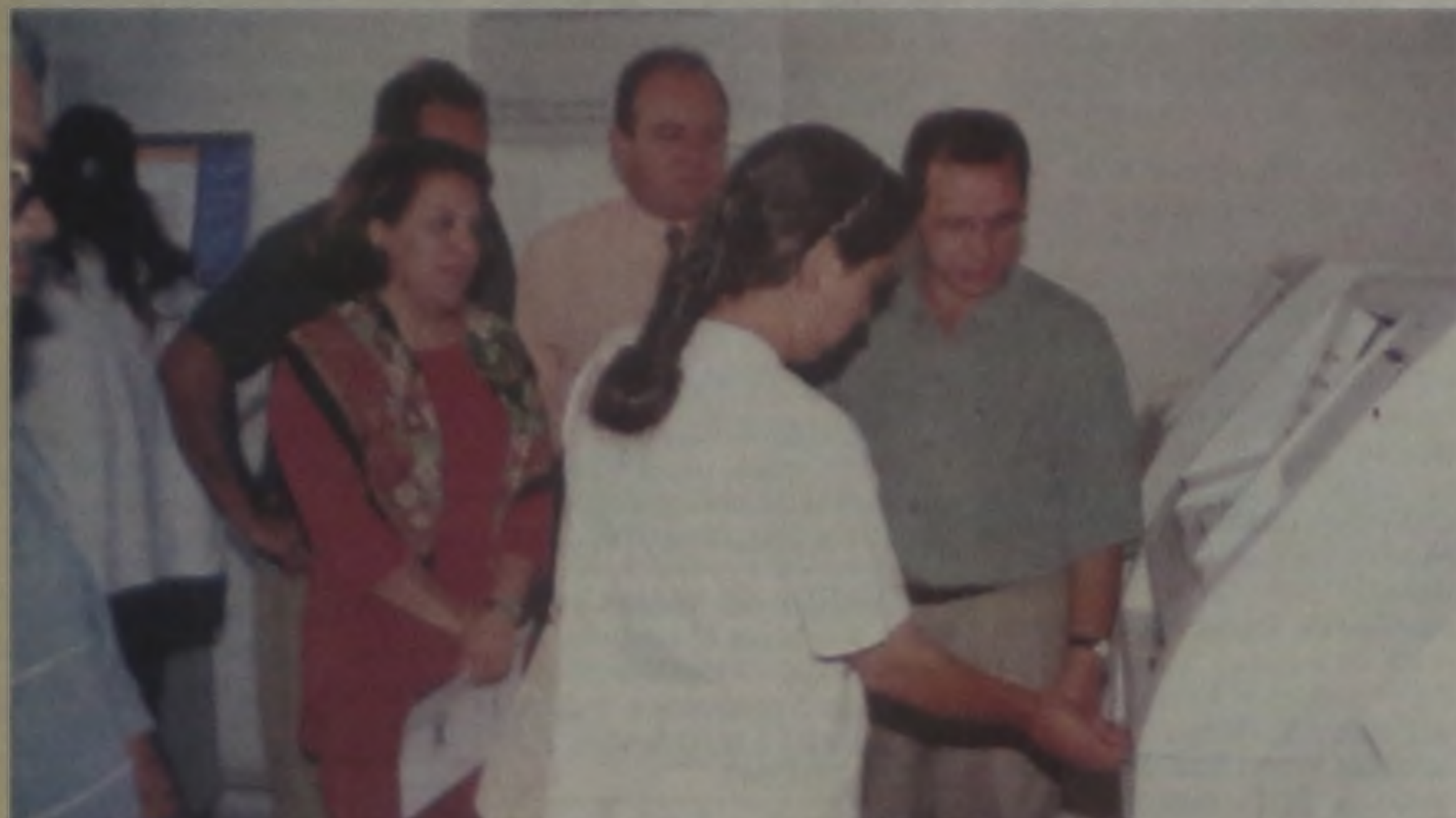
Primeiro cartão da Bolsa Escola sendo entregue

A Caixa Econômica Federal (CEF) de Lençóis Paulista realizou na terça-feira, 28 a entrega dos cartões do Programa Bolsa Escola, programa que destina dinheiro para as famílias carentes manterem os filhos na escola. O programa vai atender 986 crianças de 579 famílias selecionadas no Município. Cada família recebe R$